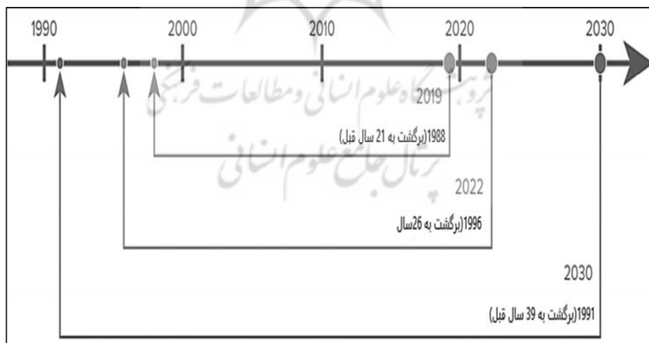
شکل (۲): تداوم جنگ و تأثیر آن بر توسعه یمن

اقتصاد، سیستم مراقبت‌های بهداشتی، زیرساخت‌ها، حاکمیت قانون و حکومت در یمن ویران شده است. در کنار این مسائل، مضرترین تأثیرات حمله عربستان بر روی عرضه مواد غذایی است. از آنجایی که یمن برای بیش از ۹۰ درصد محصولات غذایی خود به واردات متکی است، محاصره‌ها و بمباران‌های جنگ از حمل و نقل پایدار مواد غذایی از بنادر جلوگیری می‌کند. گزارش بین‌المللی آکسفام ۱ نشان می‌دهد که دو سوم جمعیت یمن نمی‌توانند پیش‌بینی کنند که وعده غذایی بعدی‌شان از کجا خواهد آمد. فقدان ابتدایی‌ترین امکانات مالی و قیمت بالای مواد غذایی در کنار هم تهدیدی واقعی برای ۱۸ میلیون نفر از جمعیت ۳۰ میلیونی یمن ایجاد کرده است. (OXFAM, 2017: 2) همچنین یمن از شیوع بیماری‌های مرگبار، خشونت، فقر و آواره شدن جمعیت رنج می‌برد. مهم‌ترین تأثیر حمله ائتلاف نظامی بر توسعه یمن است. تأثیرات این حمله آن را در میان مخرب‌ترین جنگ‌ها از پایان جنگ سرد قرار داده است. اگر این جنگ تا پایان سال ۲۰۲۲ ادامه یابد، توسعه یمن حدود سه دهه عقب خواهد افتاد و یمن به سال ۱۹۹۶ باز خواهد گشت.