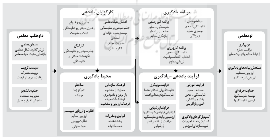
شکل ۱. الگوی نهایی تضمین کیفیت آماده‌سازی دانشجو-معلمان در نظام تربیت معلم

طراحی شد و مؤلفه‌های به‌دست آمده در این سه مرحله سازمان‌دهی شدند (شکل ۱).