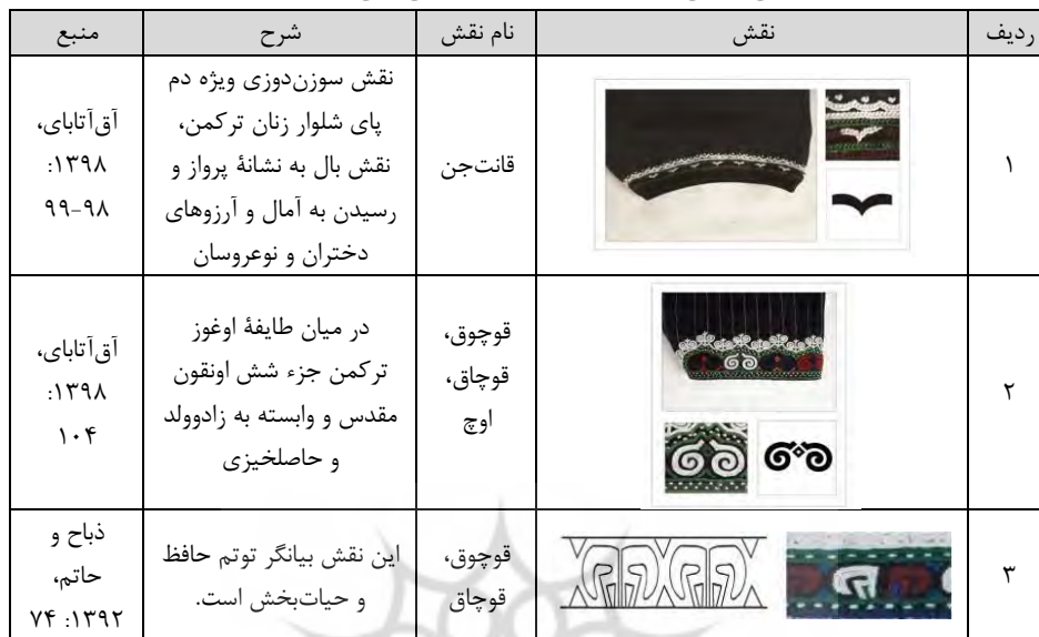
جدول ۲. بررسی برخی نقوش سوزن‌دوزی و قالی‌بافی زنان ترکمن و مفهوم آن