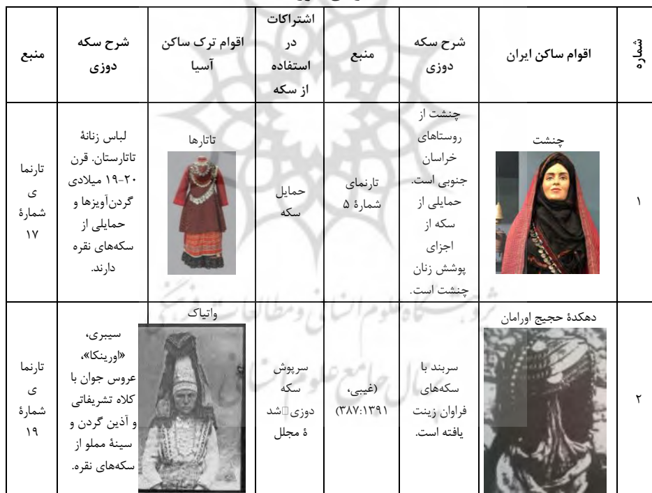
جدول ۳. شباهت انواع سکه‌دوزی در پوشش زنان ساکن ایران و زنان اقوام ساکن اطراف دریای خزر

لباس‌های زنان کوکوشنیک ابریشم‌دوزی شده و با سنگ‌ها و مروارید تزئین شده است. سکه‌های نقره را نیز به لباس خود می‌دوزند و کلاهی به نام کیتچکی دارند که در جلو طلادوزی شده و با مهره‌های چندرنگ تزئین شده است. همچنین نوعی کلاه به نام سرپوش دارند که ۳۰-۴۰ روبل روی آن می‌دوزند و گاه به دلیل ارزش بالای آن از مادر به دختر به ارث می‌رسد (تارنمای شماره ۹). در روستاهای نزدیکی شهرک پچورا در استان پسکوف، زنان متأهل سر خود را با یکپارچه چیت می‌بندند و روی سینه پیراهن آنان با یک صفحه فلزی مخصوص پوشانده شده است که آن نیز مانند یک ارثیه ارزشمند مملو از سکه‌های نقره است. همچنین گردنبندهایی از مهره سنگی می‌پوشند که روی آن‌ها سکه نقره و مدال آویزان کرده‌اند (همان). همان‌طور که در جدول ۳ مشاهده می‌کنید، استفاده از سکه در پوشش زنان ترک رایج است.