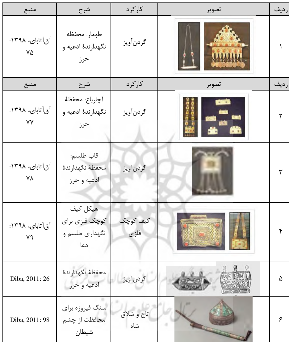
جدول ۱. برخی زیورآلات زنان و مردان ترک و ترکمن که نشان‌دهنده کارکرد حفاظتی اشیا برای فرد پوشنده هستند