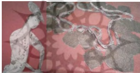
شکل ۱. سمت راست، بخشی از مینیاتور دوره صفوی جوانی با چهل بسم‌الله

وجود داشت، سکه‌ها و فلزاتی که به نقش پرنده‌گان قدرتمند شکاری مزین شده بودند، برای اتصال به لباس انتخاب می‌شدند. در حکومت صفوی نیز این رسم میان زنان ایرانی به نشانه‌ حمایت از آداب و رسوم ترکان یا به دلیل کسب قدرت‌های ماورایی و جنبه‌ حفاظتی که با صدای برخورد سکه‌ها ایجاد می‌شد امتداد یافته است که با توجه به شواهد احتمال رواج به دلایل ماورایی بیشتر است؛ زیرا در این دوره و در میان زیورآلات صفویه شاهد ورود عناصری هستیم که به لحاظ فرم قرارگیری روی بدن مانند زیورآلات ترکی و از نظر محتوا و شیوه کارکرد می‌توان گفت تحت تأثیر صوفیان و دراویش قزل‌باش هستند و حتی در مینیاتورها نیز منعکس شده‌اند؛ مانند آویز چهل بسم‌الله که جنبه‌ تقدس دارد و ممکن است برای حفظ فرد از شر نیروهای منفی ابداع و استفاده شده باشد؛ هم به دلیل تقدس عدد چهل در میان دراویش و هم از نظر قداست کلام. «در یک مینیاتور جوانی علاوه بر گوشواره زنجیر یا نوری با آویزهایی به شکل ازگیل با نقش چهل بسم‌الله دارد که از شانه‌ چپ به پهلو راست حمایل شده، این‌طور به نظر می‌آید که مرد از اشراف دربار و سقایی با این تعویذ است» (غیبی، ۱۳۹۱: ۲۹۴).