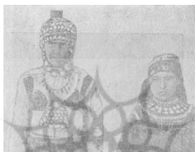
شکل ۳. زن و دختر چوواش با پوشش سکه‌دوزی شده (منطقه چیستوپولسکی استان کازان)

لباس‌های ترکان علاوه بر هدف محافظتی دارای کارکردهای نمادین و آیینی بود (ذابح و حاتم، ۱۳۹۲: ۶۹). انسان به مرور یاد گرفت از لباس برای خود حفاظتی به منظور عوامل نامرئی و ماورایی بسازد، از اشکالی که در اطراف می‌دید برای الگوگرفتن بهره برد و به مدد تزئینات متصل کردن آرایه‌هایی به پوشش خود با اطراف و عوامل طبیعی ارتباط برقرار کند (Toph, 1960: 3). مانند پوشش زنان چوواش که روپوشی زینت‌یافته با مدال‌های فلزی، سکه و مهره‌های سنگی بود و سرپوش آنان اغلب مهره‌دوزی می‌شد تا از خاصیت‌های سنگ‌ها نیز بهره کافی ببرند (تارنمای شماره ۸).