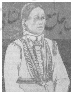
شکل ۴. زنی از کوهستان ماری استان کازان با آذین‌های سکه در سر و سینه

تیلور اعتقادات چوواش در تفاوت پوشش زنان و دختران آنان به خوبی دیده می‌شود. در شکل ۳ شخصی که در سمت راست قرار دارد، برای آذین لباس خود از سکه‌های کمتری در مقایسه با فرد سمت چپ بهره برده است. دختران چوواش در ساخت لباس‌های خود از برش‌های کمی استفاده می‌کنند. همچنین سطح گلدوزی‌شده کمتری را در لباس‌های خود به کار می‌برند (همان: ۳۶).