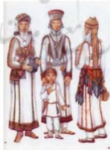
شکل ۲. پیراهن و کلاه زنانه منطقه ولگا بلغار که با آویزهای مختلف فلزی، سکه‌ها و... تزئین می‌شود

پوشش زنان ساکن دشت‌های گوبی و اطراف دریای خزر