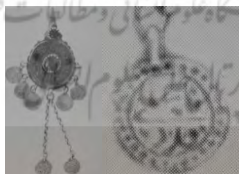
شکل ۵. آویز کلاه یا عرق‌چین زنان جنوب ایران با سکه‌هایی مزین به عبارت «یا علی