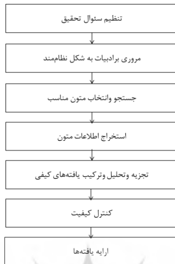
شکل ۱. مراحل اجرای روش فراترکیب

جامعه مورد بررسی در این پژوهش شامل همه پژوهش‌های انجام‌شده در حوزه عشق است. در مجموع ۲۱ پژوهش پذیرفته‌شده به کمک سامانه جست‌وجوی کتابخانه‌ها و پژوهشکده‌هایی مانند جهاد دانشگاهی (SID)، پایگاه نشریات کشور (magiran) و ایران‌داک (IranDoc) با کلمه ابعاد و انواع عشق در قسمت عنوان و محدود کردن جست‌وجو به زبان فارسی و محدوده سال‌های ۱۳۸۸-۱۴۰۰ به دست آمد. به دلیل محدودیت روش شناختی تنها پژوهش‌های کیفی بررسی شده‌اند. اطلاعات پژوهش‌های منتخب در جدول ۱ نشان داده شده است.