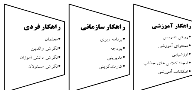
شکل ۳. راهکارهای بهبود اثربخشی روش تدریس ورزش در مدارس