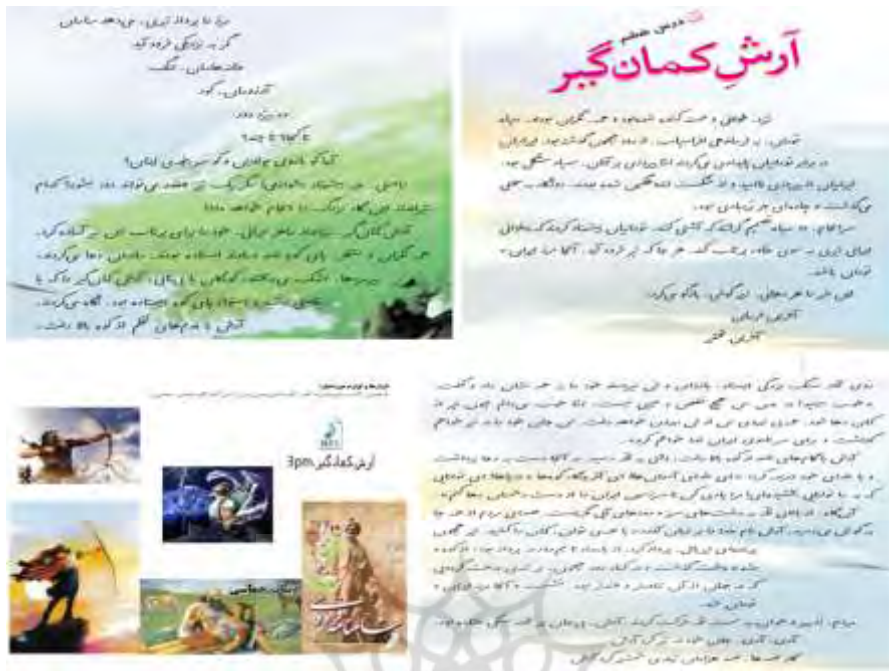
نمونه طرح درس مربوط به طرح خوانا (درس ۶ فارسی چهارم)