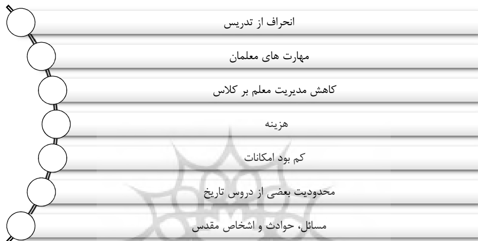
شکل شماره (۴): محدودیت‌های آموزش تاریخ با استفاده از کاریکاتورها

اصلاح متن درسی دروس تاریخ بر اساس مؤلفه‌های مناسب کاریکاتورها بنماید یا معلم خود با چاپ کاریکاتورهای لازم جهت تدریس هزینه کند که در هر دو حالت مسئله هزینه به صورت مشخصی مطرح داشت. با این حال استفاده تخته کلاسی می‌تواند این مسئله را تا حدودی برطرف نماید ولی قدرت طراحی معلمان مسئله دیگری است که در این راستا مطرح می‌شود. با توجه به وجود مسائل، حوادث و اشخاص مقدس و رویکردهای ایدئولوژیک در تاریخ و همچنین محدودیت بعضی از دروس تاریخ در این زمینه، امکان نشر هر کاریکاتوری از اشخاص و حوادث تاریخی در کلاس درس تاریخ مجاز نمی‌باشد.