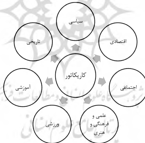
شکل شماره (۲): تقسیم‌بندی کاریکاتورها بر اساس موضوع

هنر طراحی کاریکاتور، اگر بتوانیم آن را هنری بنامیم، چیز جدیدی نیست که به دوران معاصر محدود باشد. از آنجاکه مردمان تمدن‌های باستان هیچ‌گونه مطبوعات روزانه یا طنز نداشتند، تماشای تئاتر در فضای باز، تزئین گلدان‌ها و سایر اشیاء روزمره مانند برنز و گلدان‌های تزئینی و نقاشی‌های دیواری، کانال‌های ارتباطی با مردم بودند. این رسانه دارای سابقه طولانی در تمدن بشری می‌باشد به طوری که تاریخچه کاریکاتور را می‌توان از زمان آشوریان، مصریان و یونانیان تا اواخر روم دانست (رابینسون، ۱۹۱۷: ۶۶). کاریکاتور نوعی تصویر کلیشه‌ای، هجوگونه، انتقاد و خنده‌دار است که شناخت کیفیت این کاریکاتورها می‌تواند در انتخاب کاریکاتورها برای اهداف یادگیری بسیار مفید باشد. کلمه رایج کاریکاتور کنونی از کلمه caricare (ایتالیایی) به معنای دادن تغییر اضافی یا اضافی گرفته شده و رسانه کاریکاتور رسانه‌ای است که از تصاویر برای تحریک تخیل دانش آموزان بهره می‌گیرد و یکی از انواع ارتباطات بصری ساده و مؤثر در رساندن پیام است (سیامسوری و موشین، ۲۰۱۶: ۲۰۸۱). کاریکاتورها انواع مختلفی دارند که می‌توان به کاریکاتورها سیاسی، اجتماعی، اقتصادی، ورزشی و... اشاره نمود.