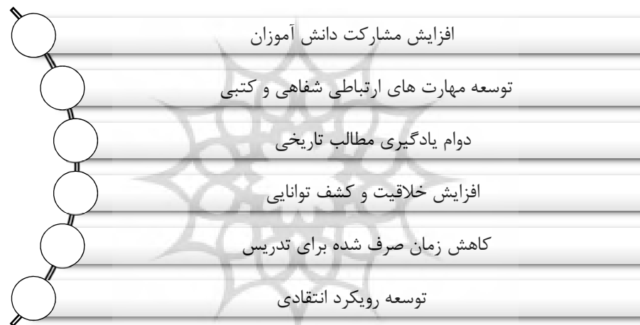
شکل شماره (۳): قابلیت‌های کاریکاتورها در آموزش تاریخ

می‌گیرند. یک کاریکاتور تاریخی با نشان دادن یک طرح تاریخی از افراد یا حوادث تاریخی میزان نامحدودی از مسائل و اطلاعات را به افراد منتقل می‌کند و زمان صرف شده برای یادگیری را کوتاه می‌کند و می‌توان برای درک موضوع و همچنین مراحل آماده‌سازی برای دوره یا تعیین آمادگی دانش آموزان و جلب توجه به موضوع استفاده کرد. کاریکاتور عنصر مهمی در کنترل درک شناختی و همچنین بهبود مهارت سواد است و با افزایش خلاقیت و کشف توانایی‌های آن‌ها، به مهارت‌های تفکر دانش آموزان کمک می‌کند. در تاریخ بسیاری از حوادث به میزان بسیاری در تمدن‌ها و حکومت، جوامع مختلف تکرار شده و هنگامی که به عنوان یک ماده آموزشی، کاریکاتور استفاده می‌شود، این فرصت را فراهم می‌کند تا رویدادهای روز و محصولات فرهنگ‌عامه را به کلاس بیاورید. به‌طور خلاصه کاریکاتورها؛ در ایجاد مفهوم اطلاعات، سازمان‌دهی و پیوند دادن اطلاعات مختلف بسیار مؤثر است (همان: ۲۰۲۰: ۱۹-۱۷).