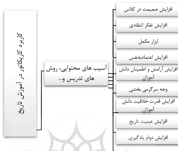
شکل شماره (۵): کاربرد کاریکاتور در آموزش تاریخ

در کشورمان را مرتفع کنند. در این راستا آشنایی و آموزش تکمیلی معلمان در مورد کاریکاتورها، طراحی دوره و واحدی برای دانشجویان دبیری تاریخ، اصلاح کتب درسی تاریخ و لزوم طراحی کاریکاتورهای آموزشی-تاریخی پیشنهاد می‌شود.