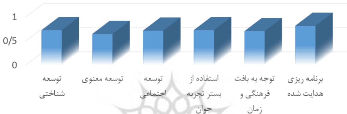
نمودار ۱. بررسی اعتبار بسته پژوهشی

و خارجی علمی، منابع الکترونیکی، کتاب، پایان‌نامه و مجلات مرتبط و در دسترس با موضوع پژوهش گردآوری و با توجه به این داده‌ها، آموزش‌های لازم در نظر گرفته شد. برای تعیین روایی کیفی محتوای بسته، از CVR استفاده شد. پس از نظرخواهی از ده متخصص مشاوره و روان‌شناس، روایی محتوایی