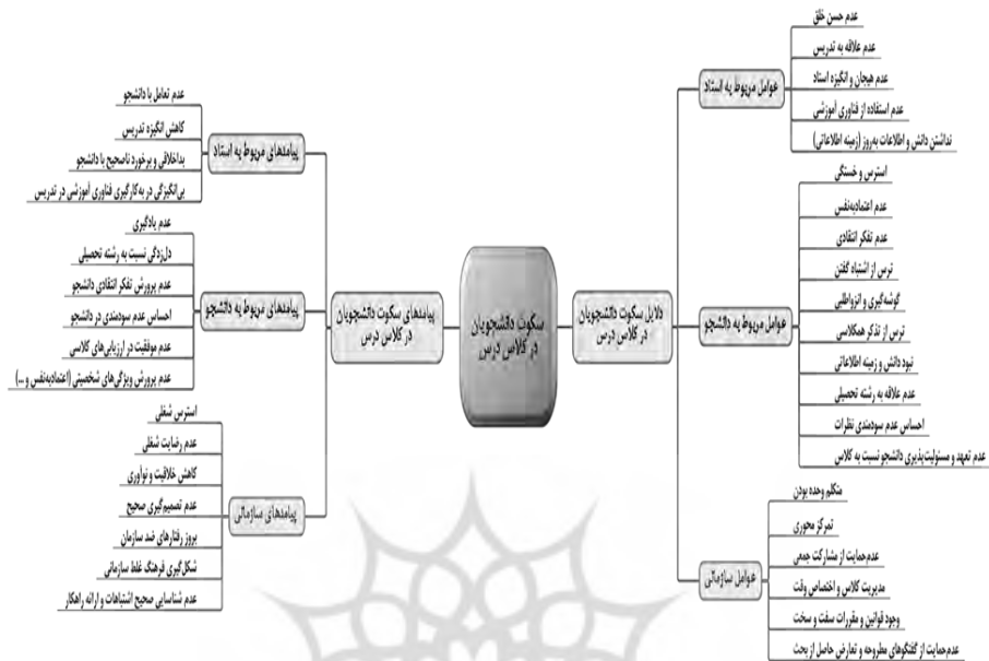
شکل ۲: نقشه مفهومی مستخرج از دلایل و پیامدهای سکوت دانشجویان در کلاس درس