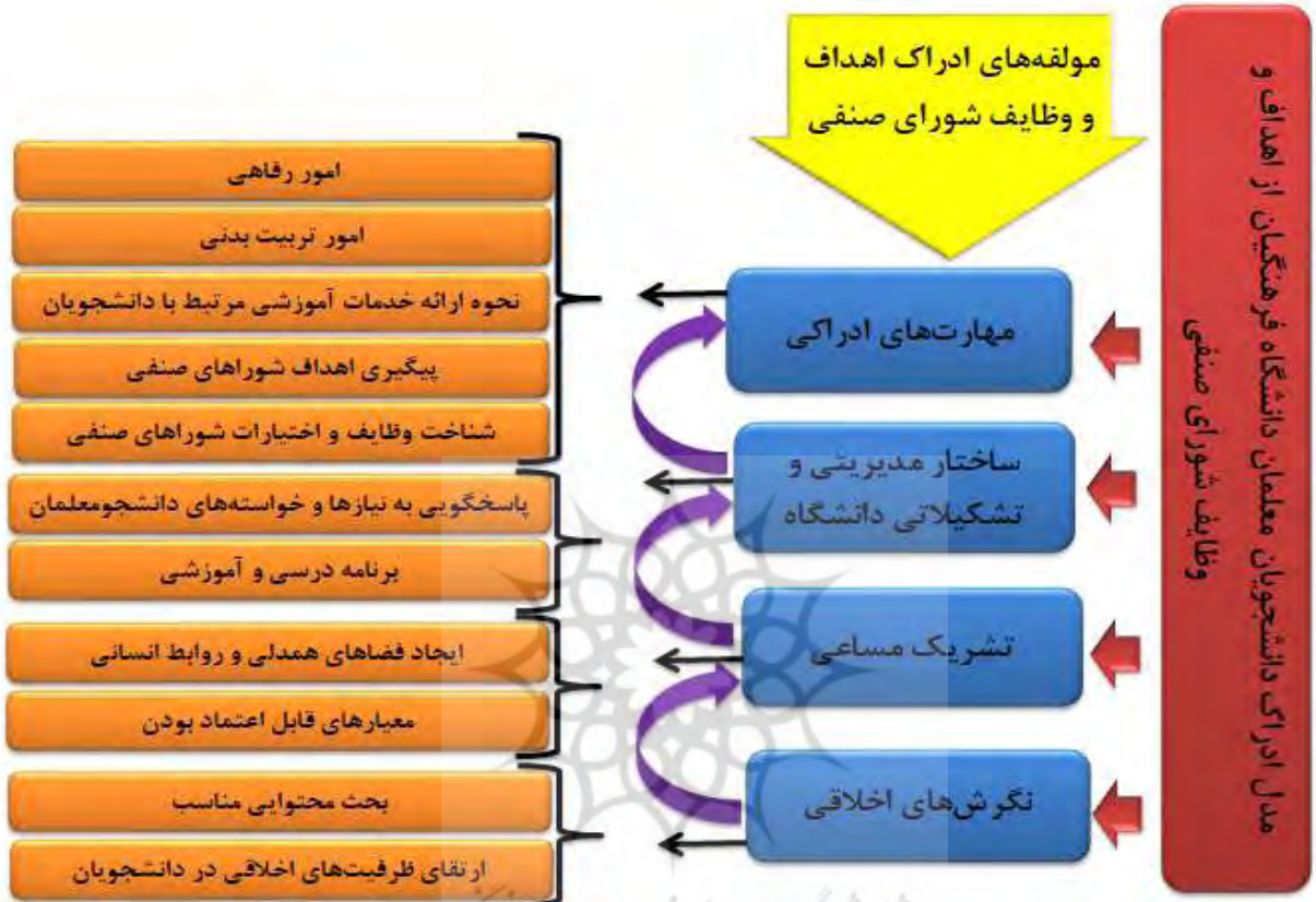
شکل (۲) مدل ادراک دانشجویان معلمان از اهداف و وظایف شورای صنفی دانشگاه فرهنگیان