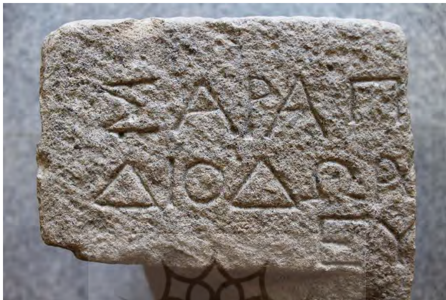
تصویر ۴: کتیبه یونانی روی سرستون مکشوفه همدان (شعبانی، ۱۳۹۶: ۹)

با وجود اینکه بخشی از کتیبه در نیمه شکسته شده قرار داشته و ما آن را در اختیار نداریم اما بازسازی هر سه سطر کاملاً امکان‌پذیر است. خوشبختانه شروع کتیبه کاملاً سالم است اما چند حرف انتهایی سطر اول و دوم آن که در نیمه شکسته شده قرار داشته است را در اختیار نداریم. بهر حال بازسازی سطور اول و دوم مبتنی بر فرضیات، اما با اعتبار بسیار زیادی همراه است. بازسازی سطر سوم نیز با باقی ماندن تنها دو حرف قطعی است. این دو حرف درست در میانه بخش آباکوس قرار گرفته‌اند (تصویر ۵).