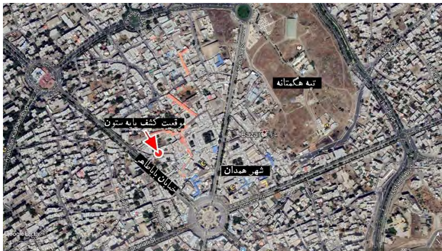
تصویر ۱: موقعیت کشف سرستون در نزدیکی مرکز شهر همدان (شعبانی، ۱۳۹۶: ۴)

از موقعیت و وضعیت اصلی قطعه سنگ به دلیل جابجایی آن توسط پیمانکار پروژه اطلاع دقیقی در دست نیست (تصویر ۲) اما با بررسی موقعیت قرارگیری احتمالی آن، به نظر می‌رسد این قطعه سنگ در عمق ۲۸۰ سانتیمتری از سطح معبر فعلی و درون یک لایه مضطرب باستان‌شناسی که حاوی داده‌های سفالی از دوران ساسانی و اسلامی بود قرار داشته است (شعبانی، ۱۳۹۶: ۷). اما بر اساس کشف حجم زیادی از سفالینه‌های منقوش ظریف دوران سلوکی از ترانسه تدفین واقع در ابتدای کوچه و همچنین تعدادی گمانه دیگر که در این بخش از شهر حفاری شده است، می‌توان اظهار نمود که این منطقه از شهر همدان در دوران سلوکی استقرار داشته است (شعبانی: ۱۴۰۱). از اینرو به نظر نمی‌رسد این قطعه سنگ از فاصله دوری به این نقطه منتقل شده و احتمالاً محل اصلی آن جایی در همین حوالی بوده است.