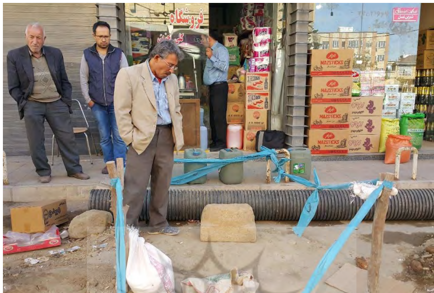
تصویر ۲: وضعیت سرستون بعد از خروج از محل اصلی خود (شعبانی، ۱۳۹۶: ۶)