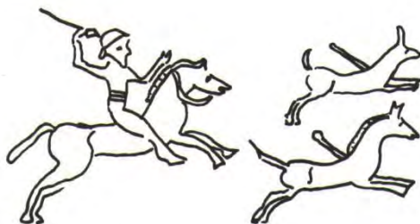
تصویر شماره ۲ (هینتس، ۱۳۸۷: ۳۵۷)

۱۵۲ پژوهش‌نامه فرهنگ و زبان‌های باستانی، سال سوم شماره اول، بهار و تابستان ۱۴۰۱