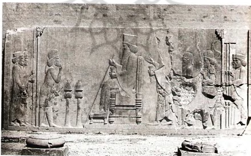
تصویر شماره ۳ (هینتس، ۱۳۸۷: ۲۹۴)