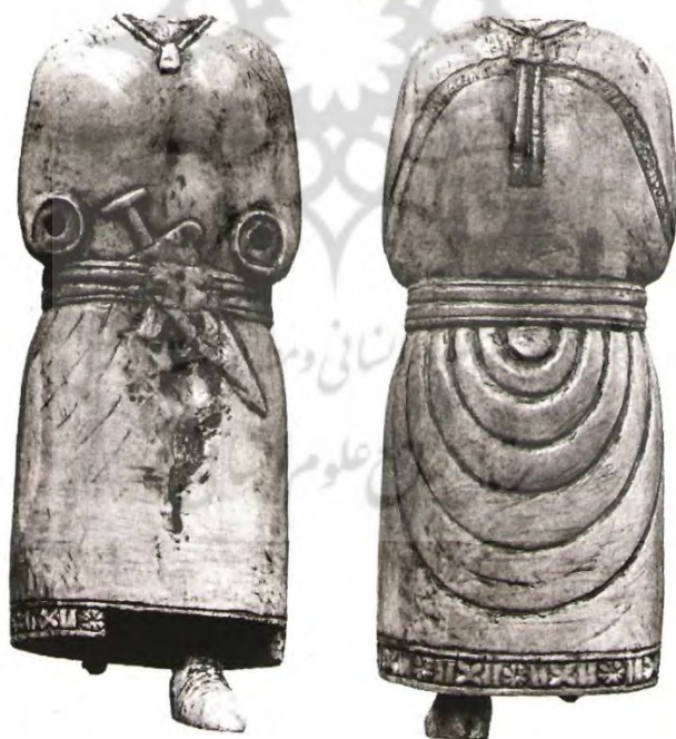
تصویر شماره ۱ (کخ، ۱۳۷۷: ۳۷)

آنها است. در بسیاری از لوحه‌ها به بازرسان بر می‌خوریم که از طرف دیوان مرکزی تخت جمشید به ایالات مختلف فرستاده می‌شدند و جیره سفر در بین راه دریافت می‌کردند. بازرسان و حساب‌رسان به صورت ماهیانه، دو سه ماه یکبار و سالیانه امور اداری را بررسی و کنترل می‌نمودند. یکی از روش‌های پیشرفته‌ای که در تخت‌جمشید و سایر مراکز شاهنشاهی انجام می‌شد، بایگانی اسناد و مدارک اداری و مالی بود. در هر زمان و مکان در صورتی که از نظر مالی و اداری مشکلی پیش می‌آمد یا اینکه کارمندی متهم به کم‌کاری و فساد می‌شد، بازرسان به بایگانی اسناد دسترسی داشته و می‌توانستند با بررسی مجدد، موضوع را روشن نمایند. بنابراین باروش کنترلی که در سیستم اداری هخامنشی در زمان داریوش بزرگ بوجود آمد، میزان سوءاستفاده پرسنل اداری و غیراداری به حداقل رسید.