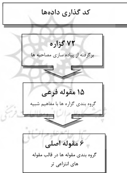
شکل ۴- تعداد گزاره ها، مقوله های فرعی و اصلی

تعداد گزاره ها و مقوله های فرعی و اصلی منتج از آنها به صورت سلسله مراتبی در شکل ۴ مورد اشاره قرار گرفته است.