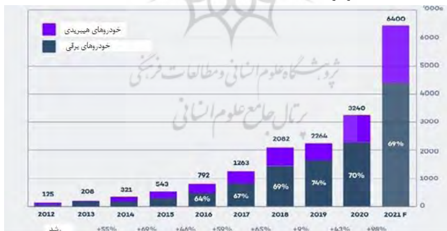
نمودار ۱- رشد فروش خودروهای برقی و هیبریدی در جهان (ارقام بر اساس واحد ۱۰۰۰ دستگاه است) (Jones 2021)

حمل و نقل عمومی ظرفیت بالایی را برای نفوذ قابل توجه فناوری‌های جایگزین به بازار به ویژه در زمینه اتوبوس‌های درون شهری ارائه می‌دهد. ابتکارات برای کاهش انتشار گازهای گلخانه‌ای، تعهدات مرتبط با پروتکل کیوتو و بی‌ثباتی در قیمت نفت، سیاست‌گذاران را وادار به اجرای فناوری‌های جایگزینی می‌کند که جایگزین تحرک وابسته به نفت خواهد شد. نگرانی تمام شدن منابع فسیلی از یک سوی و مسائل بفرنج زیست محیطی از سوی دیگر، استفاده از منابع سوختی غیرفسیلی و پاک تر را مطرح ساخته است. استفاده از خودروهای تمام الکتریکی به جای خودروهای احتراقی، به کارگرفتن انرژی خورشیدی، پیل‌های سوختی و ابرخان‌ها به عنوان روش‌های جایگزین، پیشنهاد شده‌اند. در این میان، خودروهای الکتریکی از جمله مؤثرترین راه‌حل‌های عملی برای کاهش استفاده از سوخت‌های فسیلی، افزایش بهره‌وری سوخت در خودروها و دستیابی به محیط زیست پاک می‌باشد. از این رو، خودروهای الکتریکی حائز جایگاه ویژه‌ای در اهداف بلندمدت کنترل آلودگی هوا و تغییرات اقلیمی کره زمین هستند. از سال ۲۰۲۵ خودروسازها در اتحادیه اروپا ملزم به برقی سازی خودروها خواهند بود و کلیه خودروسازان مطرح جهان سهم اعظم سبد فناوری خود را به فناوری برقی و هیبرید اختصاص خواهند داد (اوجانی ۱۴۰۰). بدون شک توسعه بازار خودروهای الکتریکی به عنوان عامل اصلی در توسعه این اکوسیستم شناخته می‌شود. تعداد خودروهای برقی فروش رفته در طول سال‌های گذشته رشد چشمگیری داشته و پیش‌بینی می‌شود در بسیاری از کشورهای جهان روند رو به رشد فروش این خودروها ادامه داشته باشد (نمودار ۱).