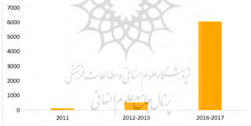
نمودار ۳- روند الکتریکی سازی اتوبوس‌های شهر Shenzhen چین (عابدی ۱۴۰۱)

تا سال ۲۰۲۰ نزدیک به ۹۸ درصد اتوبوس‌های الکتریکی جهان، در شهرهای چینی مستقر بودند. در سال ۲۰۱۷، ۱۷ درصد اتوبوس‌های شهری در حال گردش در چین، از نوع اتوبوس برقی بوده‌اند. در این سال در چین، ۹۰ هزار دستگاه اتوبوس تماماً برقی و ۱۶ هزار دستگاه اتوبوس هیبریدی ثبت شده است. شهر Shenzhen تعهد کرده بود که تا قبل از پایان ۲۰۱۷، صددرصد اتوبوس‌های خود را برقی نماید (۱۶۵۰۰ دستگاه اتوبوس). روند الکتریکی سازی اتوبوس‌های این شهر در نمودار ۳ نشان داده شده است.