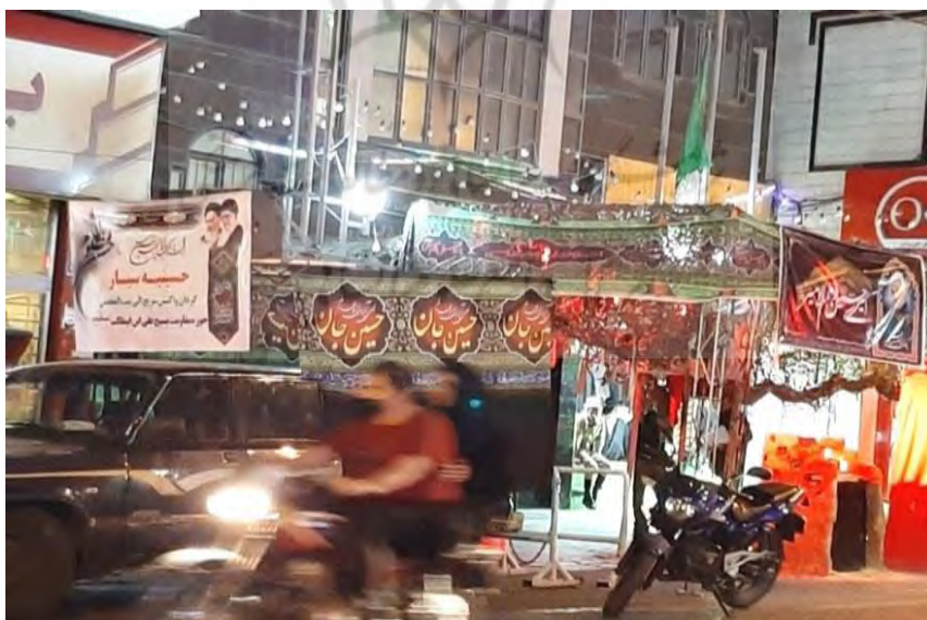
(تصویر از نگارنده، ماه محرم ۱۳۹۹ ش، تهران)