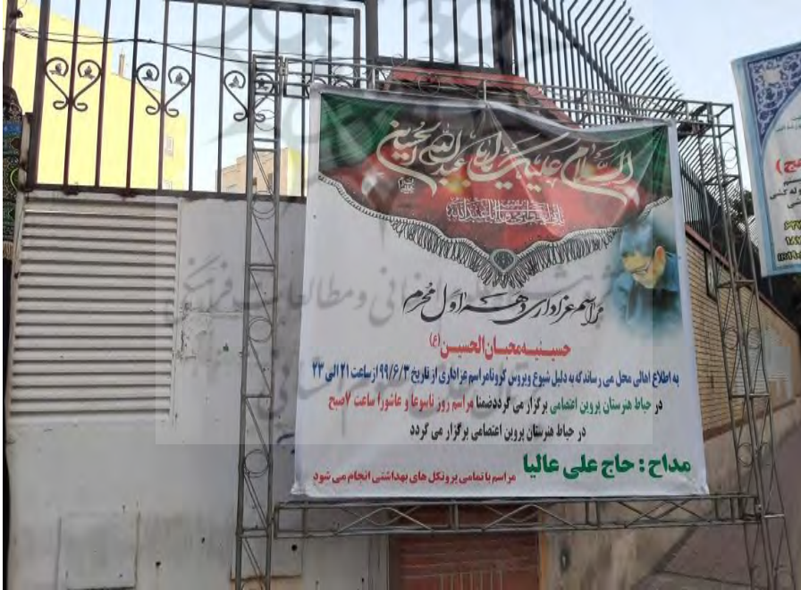
(تصاویر از نگارنده، ماه محرم ۱۳۹۹ ش، تهران)