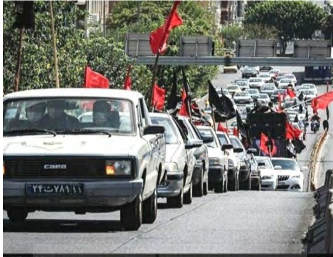
(تصویر: دسته عزاداری ماشینی هیات انصارالقائم تهران در روز تاسوعای حسینی، ۸ شهریور ۱۳۹۹)