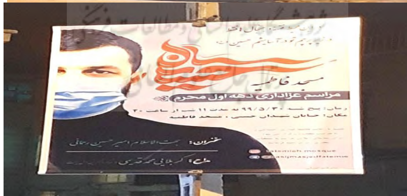
(تصاویر از نگارنده، محرم ۱۳۹۹ ش، تهران)