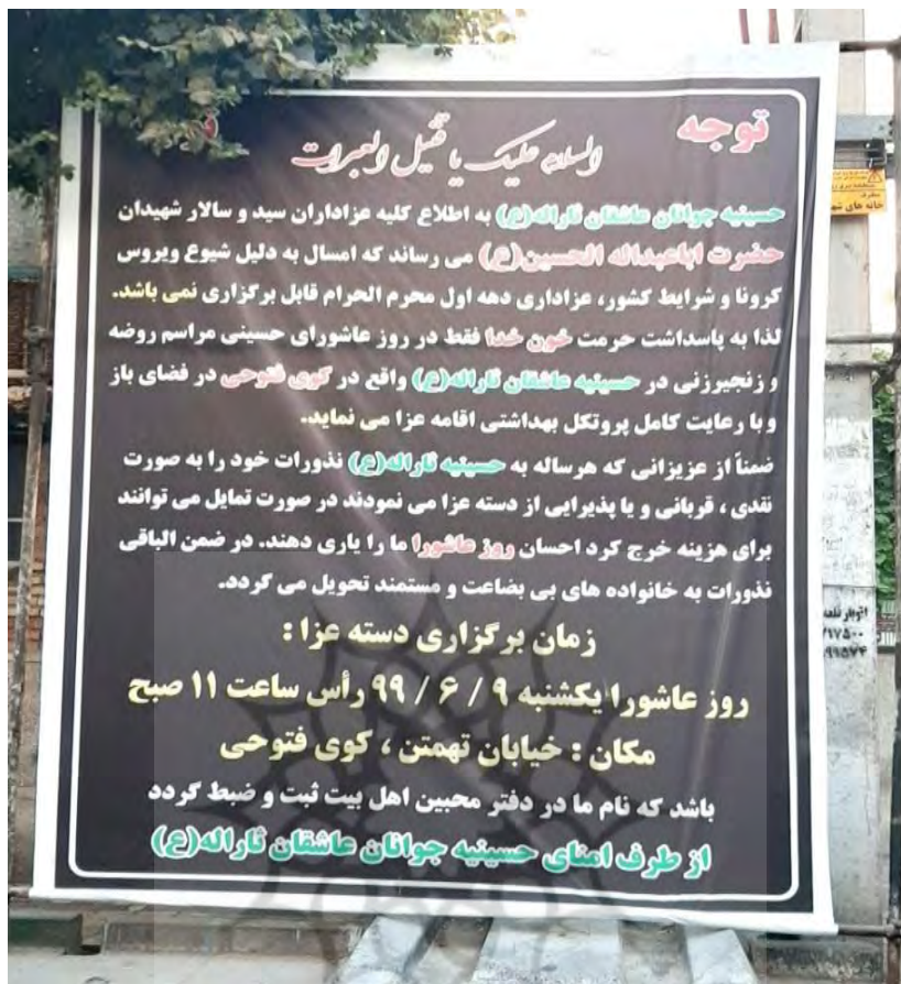
(محرم ۱۳۹۹ش، تهران)