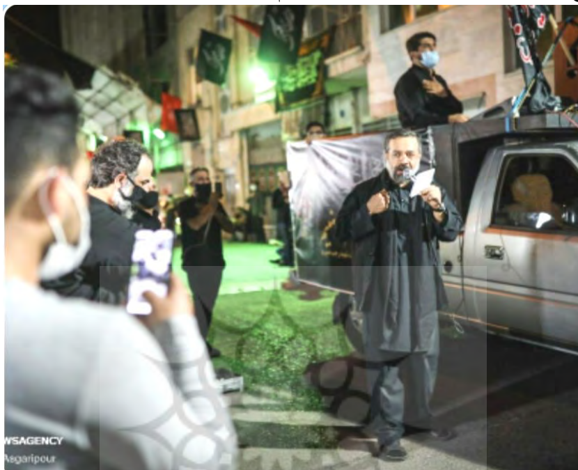
(تصویر: خبرگزاری فارس، تکیه سیار محمود کریمی، شب اول ماه محرم، ۳۱ مرداد ۱۳۹۹)

حین مداح روضه خوانی کرده و پس از مدتی، دوباره به حرکت خود ادامه می داد که این بار مداح، شعرخوانی متناسب با سینه زنی را انجام می داد.