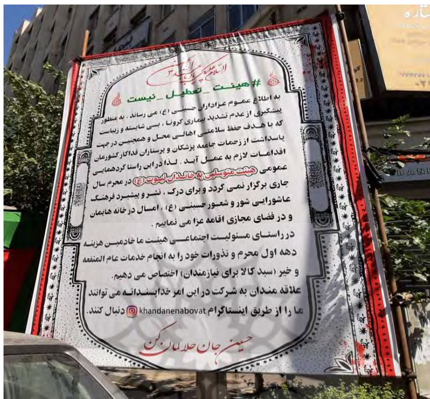
(تصویر از نگارنده، محرم ۱۳۹۹ ش، تهران)

مروری بر رخدادهای مهم مرتبط با چگونگی برگزاری مجالس و آیین‌های عزاداری ماه محرم در اولین سال مواجهه با شرایط پاندمی ویروس کرونا