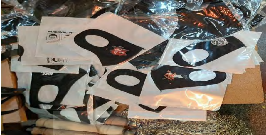
(تصویر از نگارنده، محرم ۱۳۹۹ ش، شهری)

مشکی و با طرح واژه‌هایی از جملاتی چون (یا حسین شهید، یا شهید کربلا، یا حضرت علی اصغر، یا حضرت رقیه) بود.