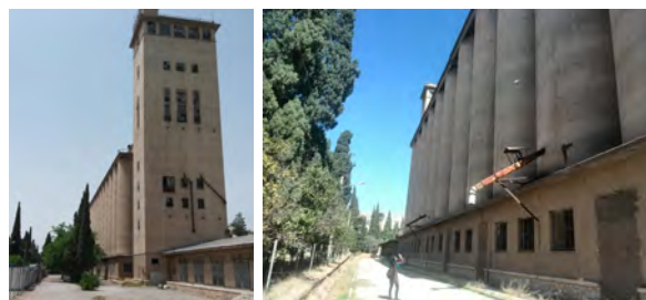
تصویر ۱- سمت راست: نمای شمالی سیلو، سمت چپ: نمای غربی سیلو.