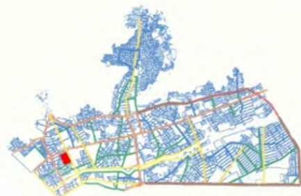
نقشه ۲- سلسه مراتب دسترسی و راه‌ها در منطقه ۳ و پیرامون سایت مورد نظر.