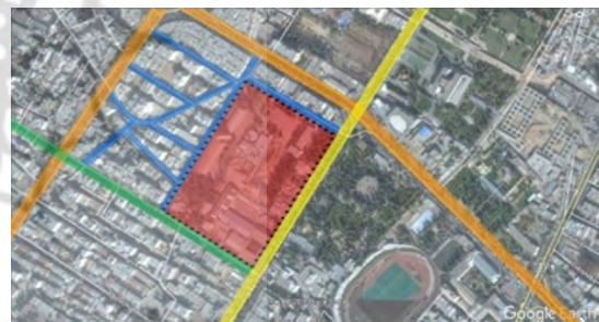
نقشه ۳- سلسه مراتب عملکردی دسترسی‌ها به سایت سیلو.