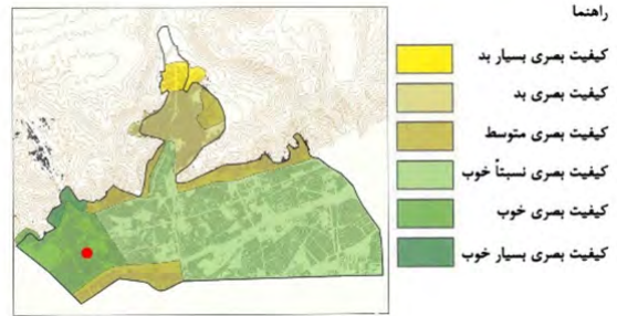
نقشه ۱- جایگاه سایت سیلو از نظر کیفیت بصری در سطح منطقه.