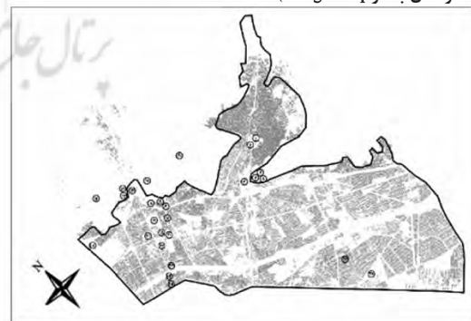
نقشه ۴- موقعیت مراکز و مکان‌های فرهنگی- تاریخی منطقه ۳