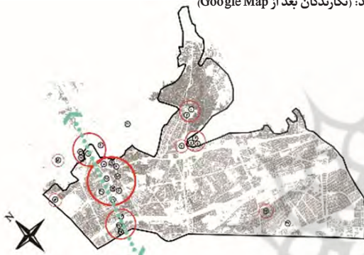
نقشه ۶- پراکندگی کانون‌های تاریخی- فرهنگی- تفریحی.