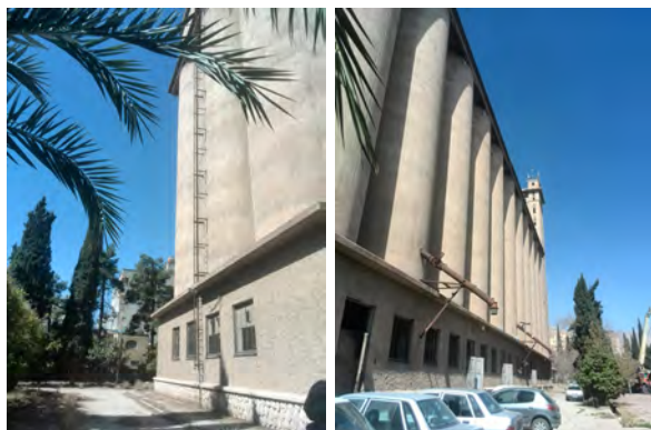
تصویر ۲- سمت راست: نمای شرقی سیلو، سمت چپ: نمای جنوبی سیلو.

سازه ساختمان از نظر استحکام، محکم، پابرجا و کاملاً قابل اطمینان است و با وجود گذشت ۸۰ سال از عمر آن از نظر