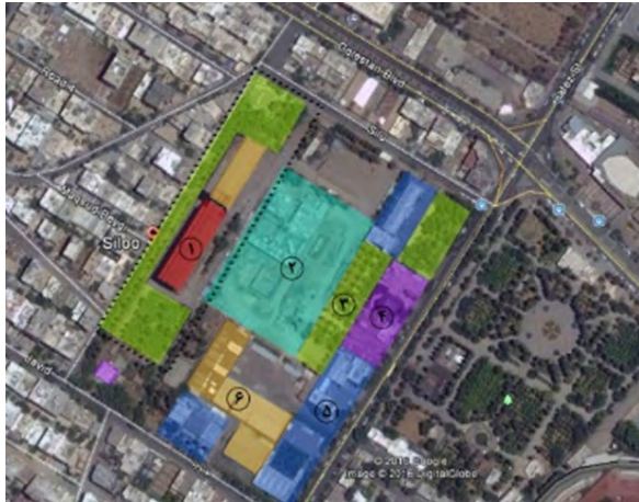
نقشه ۵- سایت مورد نظر و موقعیت سیلو در میان کاربری‌های موجود در سایت: ۱. سیلو / ۲. سایت تالار مهر شیراز / ۳. باغ / ۴. بخش‌های اداری / ۵. مهمانسرا و خانه‌های سازمانی / ۶. انبارها سیلو.