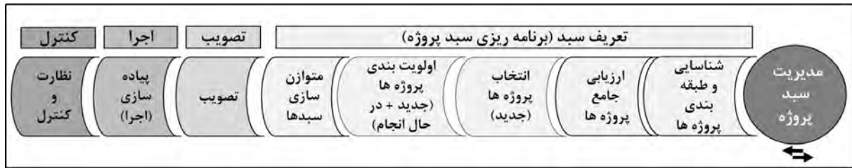
تصویر ۱- چارچوب مدیریت سبب پروژه پیشنهادی.

برای تعریف سبب پروژه‌های شهری (نمونه مطالعاتی شهرداری تهران) پیشنهاد ارائه گردید (تصویر ۲). بخش ابتدایی این مدل مفهومی، اشاره به الزامات و معیارهایی دارد که باید به صورت مستقیم در فرآیند انتخاب و اولویت بندی پروژه‌ها مدنظر قرار گیرد؛ لذا در گام چهارم، این الزامات برای پروژه‌های شهری شهرداری تهران تدقیق گردید. گام پنجم به رتبه بندی ابعاد و سپس معیارهای پیشنهادی ابتدا به عنوان معیارهای انتخاب و سپس به عنوان معیارهای اولویت بندی پروژه‌های شهری شهرداری تهران به وسیله خبرگان اختصاص پیدا کرده است.