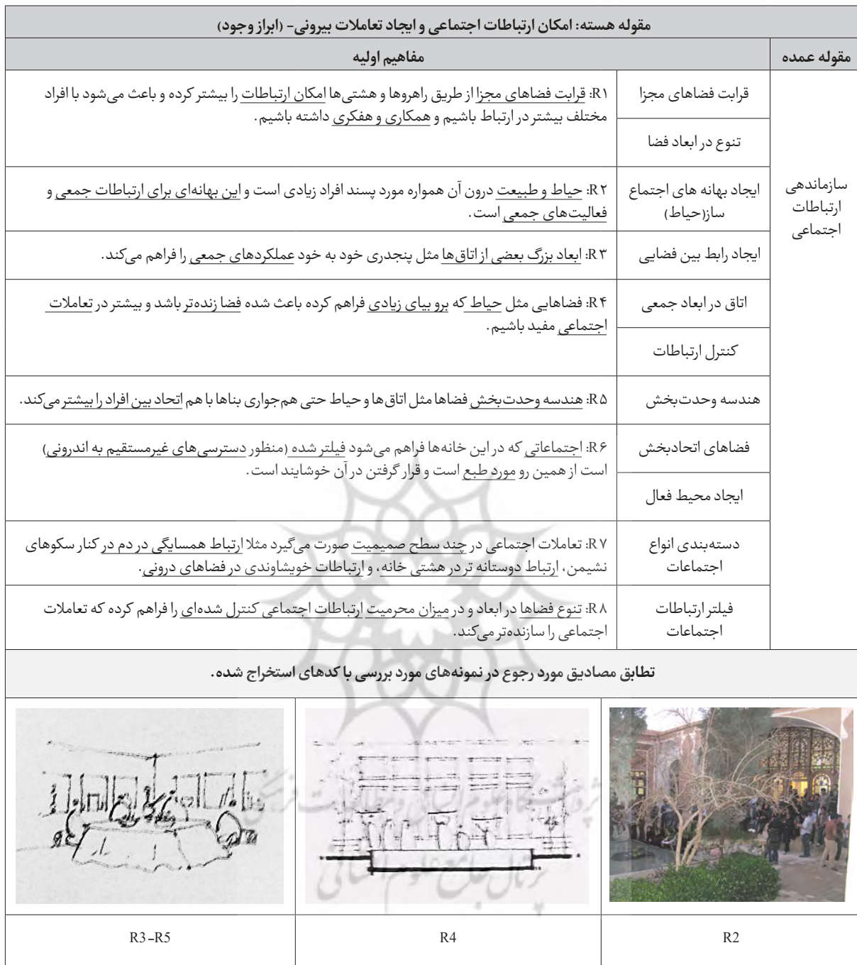
جدول ۴- کدگذاری باز- مفاهیم و مقوله‌های استخراج شده از مصاحبه‌ها.