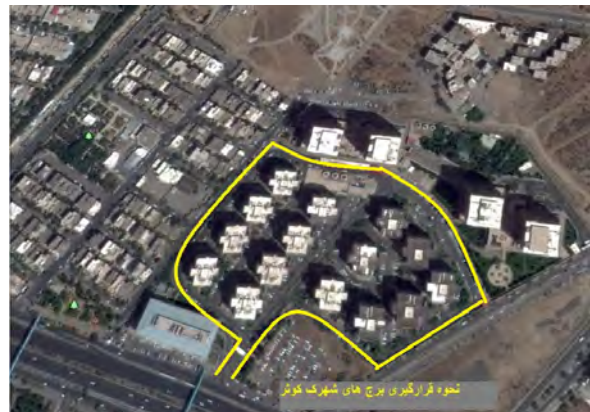
تصویر ۲- نحوه چیدمان بلوک ها.