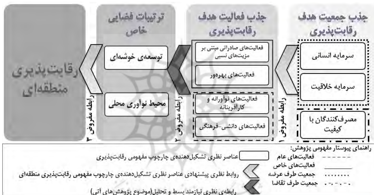
نمودار ۱- پیوستار مفهومی نخستین عام رقابت‌پذیری منطقه‌ای، پیشنهاد پژوهش.