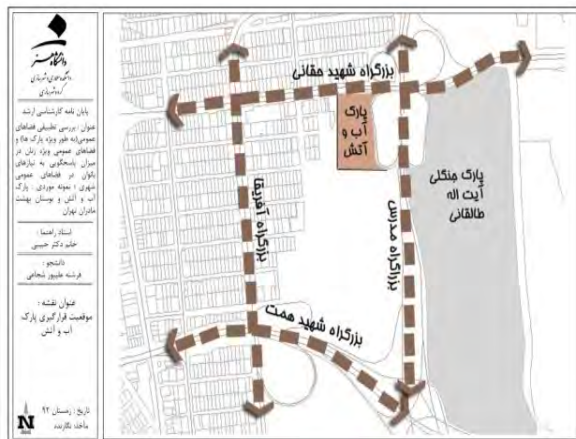
تصویر ۴- موقعیت پارک آب و آتش.

بوستان بهشت مادران که در سال ۱۳۸۷ برای استفاده بانوان افتتاح شده و یکی از پنج بوستان ویژه بانوان در سطح تهران است، با مساحت تقریبی ۲۰ هکتار در منطقه سه تهران قرار گرفته و توسط بزرگراه حقانی در غرب، بزرگراه رسالت در جنوب، خیابان کاویان غربی در شمال و بافت مسکونی محله‌ی سیدخندان در شرق محدود شده است. این مجموعه دارای امکاناتی همچون خانه فرهنگ حوراء شامل کلاس‌های آموزشی متنوع، سالن چندمنظوره ورزشی از قبیل کلاس‌های آموزشی والیبال، بسکتبال، فوتسال، ایروبیک و ...، خانه سلامت مادر که برگزارکننده کلاس‌های آموزشی سبزی‌کاری در منزل، گیاهان آپارتمانی و فضای سبز عمودی می‌باشد. همچنین دارای زمین بازی کودکان، زمین اسکیت، ایستگاه روزنامه‌خوانی، رمپ معلولین، بوفه و فست‌فود، دستگاه‌های ورزشی، آلاچیق، وسایل ورزشی کودکان، کتابخانه، خانه اسباب‌بازی کودکان و ... بوده و با فرض ایفای نقش منطقه‌ای راه‌اندازی شده است.