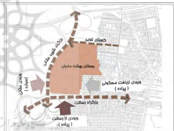
تصویر ۳- موقعیت بوستان بهشت مادران.

اجتماع‌پذیری: نتایج نشان می‌دهد بیشتر مراجعه‌کنندگان به بوستان بهشت مادران، چندروز در ماه به این فضا مراجعه