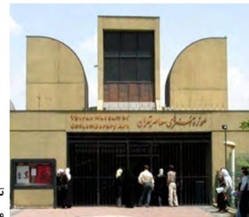
تصویر ۱- موزه هنرهای معاصر.

- استفاده از تکنولوژی جدید در ساخت ستون‌های بدون پوشش و نمایان بتنی (متأثر از پروتالیسم ۱۷ ). - ترکیب احجام به شیوه‌ای کانستروکتیویستی ۱۸ مخصوصاً در بنای با هیبت ورودی.