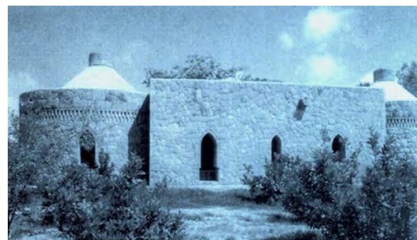
تصویر ۱۰- چشم اندازی به مرکز صدا و سیمای بندرعباس . ماخذ: (باور، ۱۳۸۸، ۱۴۵)