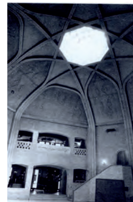
تصویر ۲- سازمان میراث فرهنگی کل کشور. ماخذ: (بانی مسعود، ۱۳۸۸، ۳۲۵)