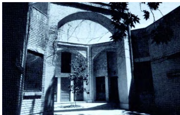
تصویر ۶- بخشی از فضاهای داخلی مدرسه عالی امام صادق ع. ماخذ: (بانی مسعود، ۱۳۸۸، ۳۱۶)