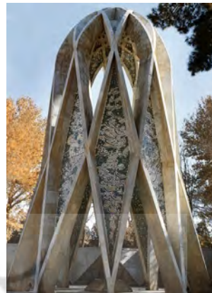
تصویر ۳- مقبره خیام.