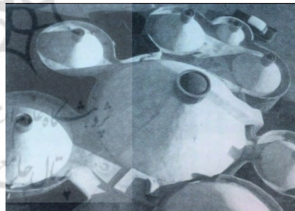
تصویر ۹- صدا و سیمای مرکز بندرعباس . ماخذ: (باور، ۱۳۸۸، ۱۴۵)