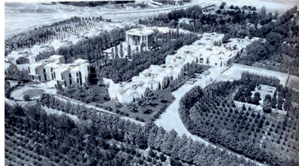
تصویر ۷- چشم اندازی به مدرسه عالی امام صادق ع

از دیگر معماران دوره پهلوی دوم که توانسته‌اند کارهای ارزنده‌ای در حیطه بوم‌گرایی انجام دهند، می‌توان به «جهانگیر درویش» اشاره کرد. او در سال ۱۳۴۶ شمسی ساختمان صدا و سیمای بندرعباس را به تقلید از فرم‌های معماری منطقه گرم و خشک جنوب ایران طراحی کرد. وی در این مجموعه با طراحی سقف‌های گنبدی شکل به الهام