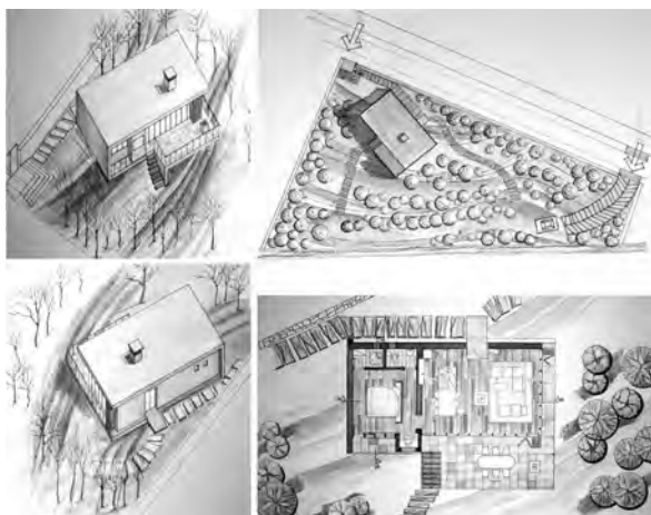
تصویر ۳- نمونه‌ای از فرآورده‌های طراحی آزمودنی‌ها.

• استمرار فعالیت‌های مشارکتی گروه‌ها • استمرار راهبردهای راهنمایی / راهبری، سرمشق شدن و حمایت / مراقبت از فعالیت‌های ارائه