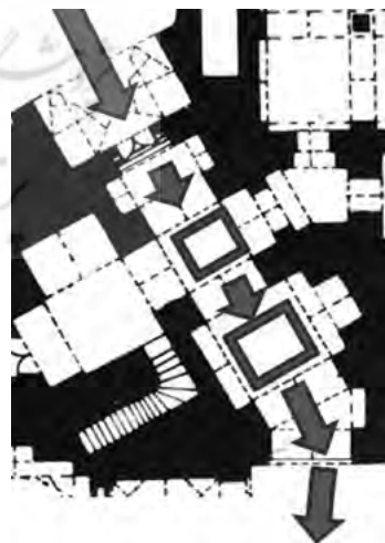
تصویر ۲- دیگرام نظام ورودی-مسجد آقا نور اصفهان.

کنج یا زوایایی غیر از وسط جداره صحن محقق می شود؛ در بیشتر موارد با پیچیدگی هایی در مسیر دسترسی مواجه هستیم. چرخش و ایجاد پیچش در مسیر، افزایش طول مسیر، افزایش ریتم و تنگی و گشادگی فضا، ابزارهایی هستند که معمار به مدد آنها بر پیچیدگی در نظام ورودی افزوده است.