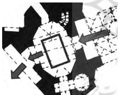
تصویر ۳- دیگرام نظام ورودی-چرخش در محل ایوان-مسجد ساروتقی اصفهان. ب- ورود از دوسوی ایوان.....مسجد شاه اصفهان.

ورود از دو سوی ایوان: در مساجدی که ورود به آنها از دو جانب ایوان محقق می شود، هوشمندی خاصی جهت افزایش آمادگی ذهنی در مخاطب صورت گرفته است. جلوخان منتهی به دهلیز باشکوهی می شود؛ این یکی از ویژگی های معماری ایرانی است. این دهلیز هشت ضلعی است از این رو، جهت خاصی ندارد، در نتیجه به عنوان پاشنه ای عمل می کند که محور ساختمان روی آن می چرخد (پوپ، ۱۳۸۸، ۱۵۴).