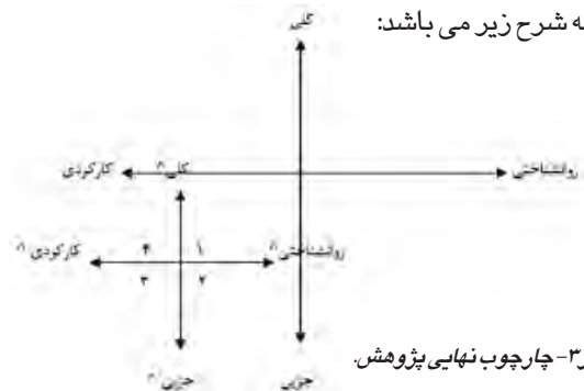
تصویر ۳- چارچوب نهایی پژوهش.