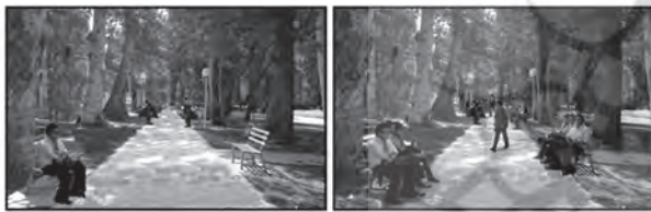
تصویر ۱- نمونه ای از تصاویر استفاده شده در پرسشنامه مرحله دوم در رابطه با شاخص تعداد افراد در واحد سطح.

در ارتباط با سرویس بهداشتی و آبخوری فاصله استقرار افراد با آنها و همچنین برای جمعیت افراد در پارک به صورت تصویری (تصویر ۱) تعداد در واحد سطح بررسی شد. پرسشنامه های مرحله دوم به تعداد ۲۳۵ پرسشنامه در پنج پارک توزیع شد. انتخاب این پنج پارک براساس نتایج حاصل از تجزیه و تحلیل آزمون کروسکال والیس صورت گرفت. این آزمون علاوه بر تعیین پارکها در مرحله دوم پرسشنامه ها، به منظور تعیین اختلاف نظر افراد در ۱۰ پارک مطالعه شده نیز استفاده شد. نظر افراد در ارتباط با شاخص هایی که در زمینه مدیریت و مسائل اجتماعی تعیین شد در میان پارک های مورد مطالعه دارای اختلاف معنی دار در سطح ۱% بود. با توجه به اینکه امکانات موجود در پارک های مورد مطالعه متفاوت است و در سطح یکسانی نمی باشد و همچنین تعداد بازدیدکنندگان پارکها نیز به دلیل مساحت متفاوت آنها با یکدیگر اختلاف دارد، بنابراین می توان نتیجه گرفت که شاخص های تعیین شده آنهایی هستند که بر رضایت بازدیدکنندگان تاثیر گذاشته و باید میزان استاندارد برای آنها تعیین کرد.