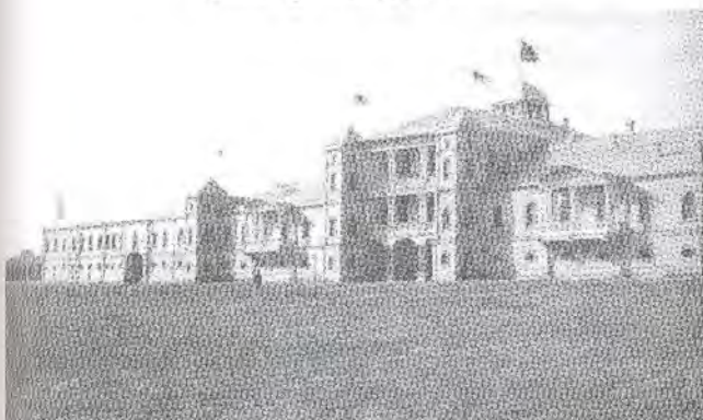
تصویر ۵- عمارت قزاق خانه.