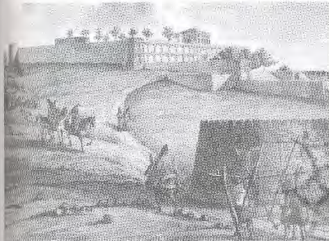
تصویر ۲- قصر قاجار، کلنل کلمبیری ماخذ: (تورنتن، ۱۳۷۴، ۶۲)

قصر قاجار اولین قصری بود که در زمان فتحعلی شاه در تهران ساخته شد. این قصر در سال ۱۲۱۳ ه.ق در شمال شرق دارالخلافه تهران (در نزدیکی چهارراه قصر کنونی) احداث شد. این قصر همانند یک قلعه نظامی بر فراز تپه ای نسبتاً مرتفع ساخته