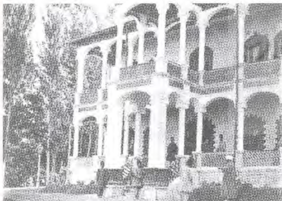
تصویر ۴- قصر یاقوت، عکس ۱۳۱۲ ق.

سوره شادان حضور مبارک روزگاه علوم انسانی و مطالعات رتال جامع علوم انسانی