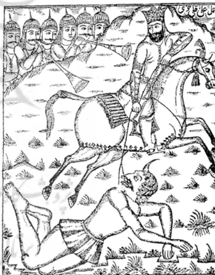
تصویر ۳- «نبرد اسکندر و دیو» از کتاب خمسه نظامی ۱۲۶۴ ه. ق.

مثال دیگر حضور رقم در میان گفتگوی دو شخصیت یا دو گروه شخصیت در تصویر است که هنرمند در این تصاویر چنان رقم خود را در میان دو نفر گفتگوکننده ثبت کرده که گویی در آنجا حضور دارد و شاهد و ناظر گفتگو است. برای مثال تصویر «خوشامدگویی شاه به عروس و ابوتمام» از بختیارنامه، ۱۲۶۳ ه. ق با رقم «رقم میرزا علیقلی خوئی» (تصویر ۴؛ جدول ۲، ش. ۵) که رقم در میان دو گروه شخصیت درج شده، یا تصویر «نبرد اسکندر و زنگی» از خمسه نظامی، ۱۲۶۴ ه. ق (جدول ۲، ش. ۱۲) که رقم در میان دو متخاصم قرار گرفته و تمثیلی از حضور هنرمند به مثابه شاهد و ناظر ماجرا است. رقم‌های ۳، ۴، ۵، ۸، ۱۰، ۱۲، ۳۳، ۳۸، ۴۱، ۴۲ و ۴۵ در جدول ۲) در این دسته جای می‌گیرند.