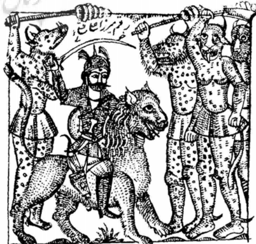
تصویر ۲- «جنگ خان محمد با دیوان» از کتاب نوش‌آفرین گوهرتاج ، ۱۲۶۳ ه.ق.