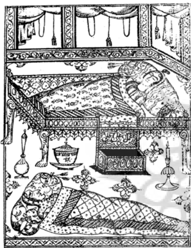
تصویر ۷- «رابعه در خواب» از کتاب گلستان ارم ۱۲۷۰ ه.ق.

رقم‌های روح‌الله میرک و قاسمعلی چهره‌گشا در برخی از نگاره‌هایشان در متن کتیبه بناها پنهان شده یا رقم بهزاد در نگاره «دارا و شبان»، از نسخه مصور بوستان سعدی (۸۹۳ ه.ق)، روی تیردان یکی از پیکره‌ها نقش بسته است (کاووسی و دیگران، ۱۳۹۴، ۲۳۲). رقم مستتر معماگونه است مانند تاریخ‌ها و رقم‌هایی که شاعران و گاه خطاطان به صورت حروف ابجد و با استفاده از حساب جمل به کار می‌بردند. معیار برای انتخاب رقم‌های مستتر ناپیدا بودن آنها در نگاه اول است و برای یافتن آنها باید جست‌وجو کرد تا رقم پیدا شود. پنهان کردن رقم در تصویر در هنرهایی مانند نگارگری و کاشیکاری مسبوق به سابقه است؛ اما تا آنجا که می‌دانیم در تصویرگری کتب چاپ سنگی تنها میرزا علی‌قلی خویی است که استتار رقم را انجام داده است. بهترین نمونه برای رقم مستتر در کارهای میرزا علی‌قلی خویی، رقم «رقم علی‌قلی» در تصویر «رابعه در خواب» از کتاب گلستان ارم ، امامان شیعه، خاصه امام علی (ع)، است.