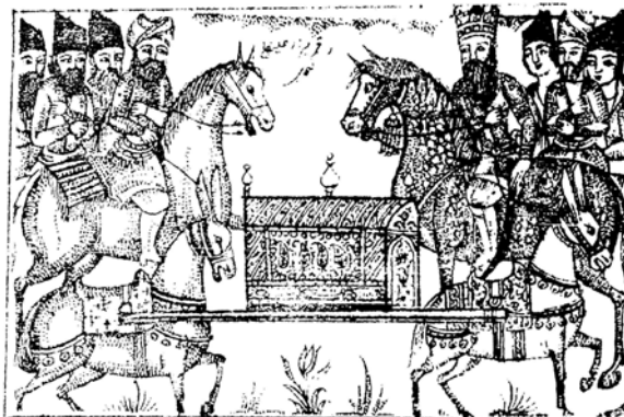
تصویر ۴- «خوشامدگویی شاه به عروس و ابوتمام» از بختیارنامه، ۱۲۶۳ ه. ق.