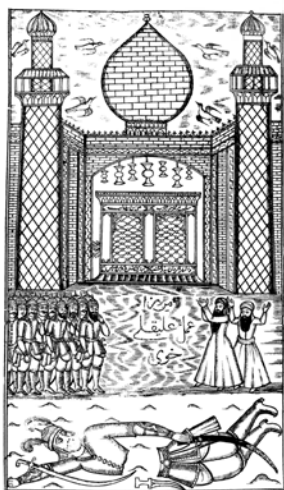
تصویر ۵- «کشته‌شدن مره بن قیس در مرقد امام علی (ع)» از حمله حیدری، ۱۲۶۹ ه. ق.