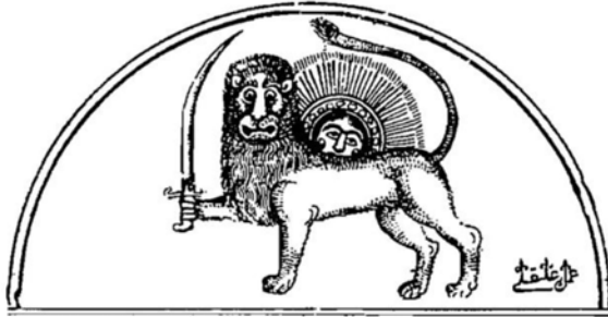
تصویر ۱- سرلوح روزنامه وقایع‌التفاتیخ (۲۲ جمادی‌الاول ۱۲۶۵ ه.ق).

این پژوهش رقم‌های علی قلی خوئی را براساس خط، ترکیب، محل ثبت و محتوا مورد بررسی قرار می‌دهد. علی قلی بیشترین رقم‌ها با طراحی و ترکیب متفاوت را در تصاویر چاپ سنگی گنجانده است. در مجموع اجرای ممتاز و منحصر به فرد این رقم‌ها نشانگر رشد خودآگاهی خوئی بود، چراکه