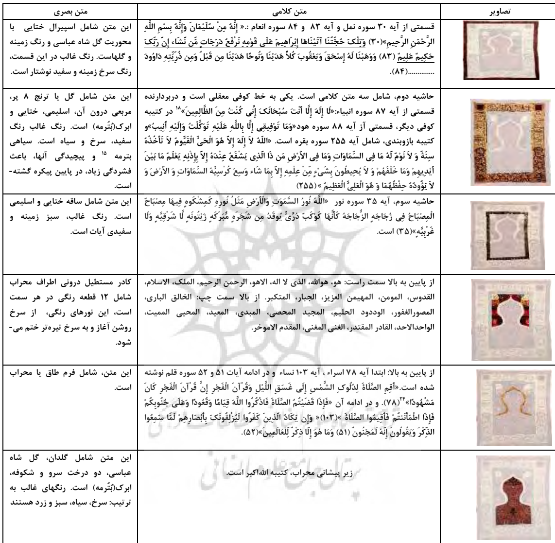
جدول ۲- تقسیم‌بندی و اجزای درون محراب.