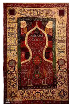
تصویر ۱- قالیچه محرابی، در موزه توفقای، مرکز ایران، قرن ۱۶، ۱۱۶×۱۷۰ سانتی متر مربع. گره نامتقارن.

پیکره‌ی مورد مطالعه قالیچه‌ای با طرح محراب، در ابعاد ۱۱۶×۱۷۰ سانتی متر مربع است که با گره نامتقارن بافته شده (تصویر ۱) و این قالیچه در موزه توفقای نگرهداری می شود. نظرات بسیاری درباره تاریخ و محل بافت قالیچه وجود دارد؛ بازه زمانی که برای قالیچه در نظر گرفته شده از قرن شانزده تا اوایل سده هفدهم میلادی و بازه مکانی از شمال غرب تا کاشان است (Frances, 1999, 96؛ پوپ، ۱۳۸۷، ۱۱۶۹). با توجه به نقوش به کار رفته و ترکیب نقوش، «آنا سانتوس ۱۴ تعدادی از قالیچه‌های محرابی که در گروه قالی‌های سالتینگ قرار می گیرند را بافته شده در زمان شاه عباس می داند، که از متأثر از سبک تبریز دوم هستند (Santos،