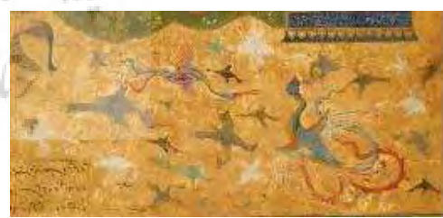
تصویر ۱-۳، ۱-۴، ۱-۵. بخشی از نگاره تیموری. الگوی مفهومی؛ زیرمجموعه نمادین.

جدول ۲- فرانقش بازنمودی در نحو بصری نگاره‌ها.