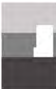
تصویر ۲-۲. قاب بندی در نگاره صفوی.