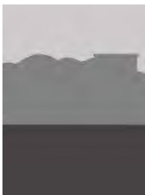
تصویر ۱-۲. سه فضای مجزا در ترکیب‌بندی نگاره تیموری.

تصاویر روایی با حضور بردار تشخیص داده می‌شوند و نقش مهمی در روایت تصویر دارند. بردار اغلب خطی فرضی است که مشارکت‌کنندگان را به یکدیگر پیوند می‌دهد و بیانگر نوعی ارتباط فعال و پویا در تصویر است. بردارهای کنشی به پرسش‌های متن تصویری پاسخ می‌گویند و نقش فعالانه و یا منفعلانه‌ی مشارکت‌کنندگان در تصویر را نمایان می‌کنند (Jewitt & Oyama, 2001, 140-143). این بردارها ممکن است توسط بدن‌ها، اعضا یا ابزارها تشکیل شوند؛ اما روش‌های دیگری نیز برای تبدیل عناصر بصری به بردار وجود دارد، برای مثال جاده‌ای که به‌صورت مورب در فضای تصویر نشان داده‌شده، یک خط بردار است (Kress & Van Leeuwen, 1996, 59). در ادامه باید اشاره کرد که ساختار روایتی می‌تواند گذرا یا ناگذرا باشد؛ چنان چه کنش از شخصی بر شخص دیگر انجام شود و هم کنشگر و هم کنش‌پذیر آشکار باشند گذرا است و اگر تنها یکی از طرف‌های کنش در تصویر قابل‌رؤیت باشد، ناگذرا محسوب می‌گردد. بر این اساس بردار نگاره تیموری (تصویر ۱)، توسط کنش نگاه مشارکت‌کنندگان به دال مرکزی (حضرت سلیمان (ع)) و تبادل نگاه میان شرکت‌کننده‌های