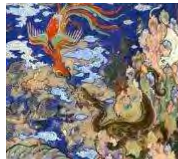
تصویر ۱-۲. بخشی از نگاره صفوی. تقابل نمادین لاهوت و ناسوت در آسمان.