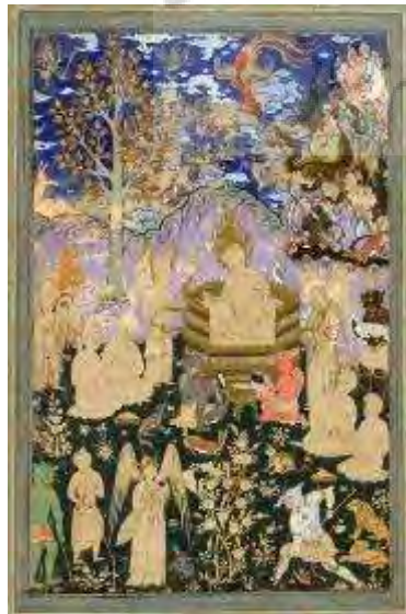
تصویر ۲- بارگاه سلیمان، متعلق به سده ۱۶هـ.ق (مکتب قزوین صفوی).