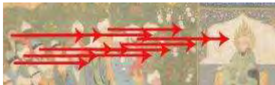
تصویر ۱-۶. بخشی از نگاره تیموری. زاویه دید افقی.

واکوی فرانتش تعاملی در دو قاب بالایی و پایینی نگاره‌ی تیموری (تصویر ۱) زاویه‌ی دید عمودی- به ترتیب از بالا به پایین و برعکس- است که مشارکت‌کنندگان به نقطه‌ی عطف نقاشی- پیکره سلیمان- دارند، یعنی آنجا که پرندگان به‌عنوان تمثیلی از جان آدمی به‌سوی اعلی‌ترین درجات