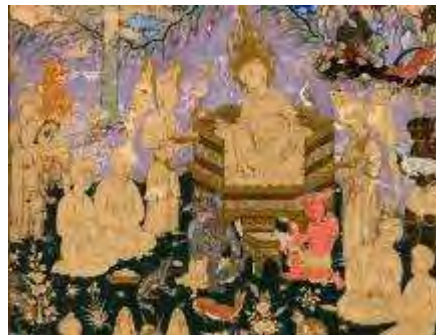
تصویر ۲-۴. مدالیته‌ی پایین در پیکره‌های طراحانه نگاره صفوی.