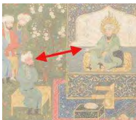
تصویر ۱-۱. بردار روایی و حرکتی شکل‌گرفته در نگاره تیموری.