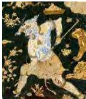
تصویر ۲-۴. افعال بدی پیکره‌های فرودست در نگاره صفوی.

ارزش اطلاعاتی در بررسی نگاره‌ی دوم بدین شکل تبیین می‌شود که پیکره سلیمان به‌عنوان شخصیت اصلی در فضای نسبتاً مرکزی تصویر شده و باقی مشارکت‌کنندگان مطابق با آن- به‌عنوان هسته اطلاعات- ساماندهی شده و تابع وی هستند. به عبارتی دیگر «عناصری که در حواشی تصویر قرار دارند فرعی و وابسته‌اند» (Kress & Van leeuwen, 1996, 206). هم‌چنین سلیمان بالاتر و تا اندازه‌ای بزرگ‌تر از دیگران