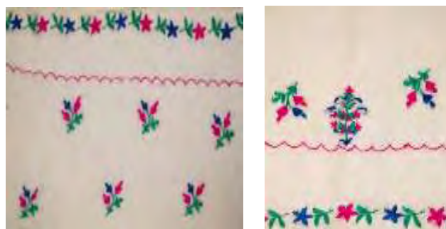
تصویر ۱۴- الف. چادر کتان رودوزی شده. تصویر ۱۴- ب. نقوش سطح چادر کتان.