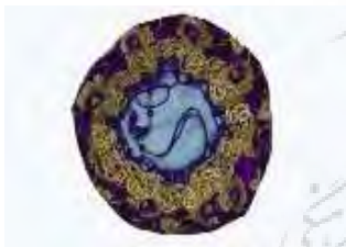
تصویر ۷-ب. مفشو مخمل.

منسوجات دوره زندیه این موزه، دو قطعه، شامل یک کلاه زربفت زنانه