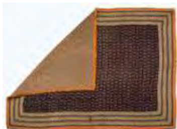
تصویر ۶- بقچه ترمه انگشتی ابریشمی.