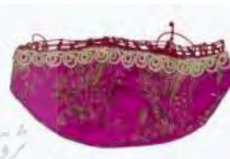
تصویر ۷-الف. مفشو زربفت.