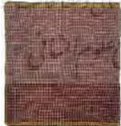
تصویر ۱۷- چادرشب.