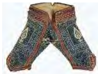
تصویر ۱۰-الف. شلوار پهلوانی طرح سرو.