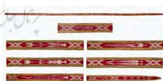
تصویر ۴- نوار مبارک باد ابریشمی.