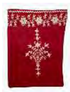
تصویر ۲۰- کیسه پول.