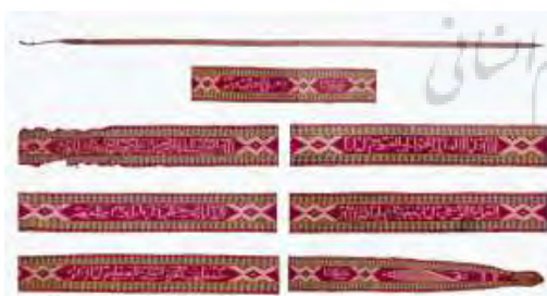
تصویر ۵- نوار آیه‌الکرسی ابریشمی.

بقچه ترمه انگشتی (انگشت‌باف)، متعلق به دوره صفوی و از جنس پشم ۹ است (تصویر ۶). ترمه انگشتی به نوعی از ترمه گفته می‌شود که تار پارچه ترمه از ابریشم تابیده و بود آن از ابریشم، نخ، پشم، کرک و در رنگ‌های متنوع با انگشت بافته می‌شده است. در این بقچه، حاشیه نیز به روش انگشتی و به صورت جدا بافته شده و با تکنیک شیرازه‌دوزی به متن پارچه الصاق شده است. شیرازه‌دوزی روشی از دوخت است که لبه یا به اصطلاح شیرازه دو پارچه را به هم می‌دوزند. این روش، در دوخت شلوارهای زنان زرتشتی نیز کاربرد دارد. رنگ‌های به‌کار رفته در پارچه عبارتند از: مشکی،