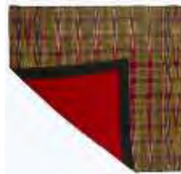
تصویر ۱۹- بقچه ابریشمی.