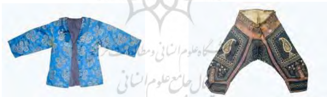
تصویر ۱۲- کت اطلس زربفت زنانه.

چادر سفید کتان و رودوزی شده، متعلق به اواخر دوره قاجار می‌باشد. نقش درخت زندگی در بالای سر قرار گرفته (تصویر ۱۴-الف) و نقش گل‌های تک و دسته‌گل در حاشیه و سرتاسر پارچه با استفاده از تکنیک ساتن‌دوزی ۱۳ دوخته شده است (تصویر ۱۴-ب). با توجه به نقش درخت زندگی ممکن است این چادر متعلق به عروس بوده باشد؛ اما با در نظر گرفتن مواد ارزان قیمت (کتان)، در تهیه این چادر نمی‌توان بر این نکته