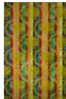
تصویر ۱۵- زیرمنقلی زربفت.