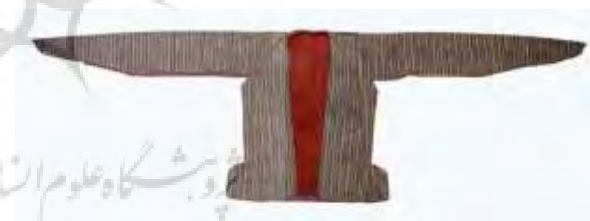
تصویر ۱-الف. ارخالق زنانه.