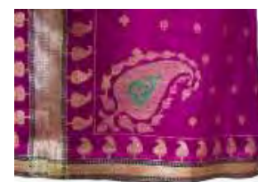
تصویر ۱۳- لباس زربفت زنانه.