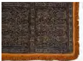
تصویر ۱۸- بقچه ترمه رضا ترکی.

این پارچه، چادرشب و متعلق به اواخر دوره قاجار می‌باشد (تصویر ۱۷). طرح آن پیچازی (چهارخانه) است. طرح‌های پیچازی به مرور