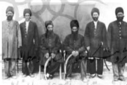
تصویر ۳- دوران میانسالی شجاع‌الملک.