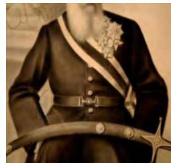
تصویر ۱۸- چهره عبدالله‌خان اتابک، اثر علی‌اکبر حجار. تصویر ۱۹- چهره ذکاء‌الملک، اثر کمال‌الملک، رنگ مأخذ: (ادیب برومند، ۱۳۹۲، ۶۶) روغن، ۱۳۳۱ ق. مأخذ: (سمسار، ۱۳۹۶، ۷۱)