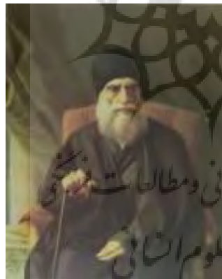
تصویر ۱۴- چهره عضدالملک، اثر کمال‌الملک، رنگ روغن. مأخذ: (سهیلی خوانساری، ۱۳۶۸، ۳۰۹)

ترکیب‌بندی: در تابلوی شجاع‌الملک پیکره در میانه تابلو قرار گرفته است و عناصر بی‌جان در جهت کاستن این خشکی استفاده شده‌اند و به یاری عناصر معماری‌گونه، پیکره جای‌گیری بهتری در فضا پیدا کرده؛ این خصلت در دیگر آثار وی نیز قابل مشاهده است (تصویر ۱). هر چند این ویژگی در آثار برخی نقاشان خصوصاً در دوره