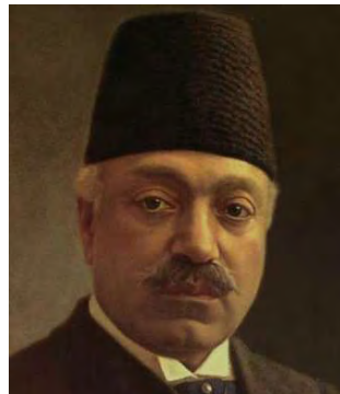
تصویر ۱۶- ناصرالملک قره‌گوزلو، اثر کمال‌الملک، رنگ روغن، ۱۳۲۹ق. مأخذ: (سمسار، ۱۳۹۶، ۶۸)