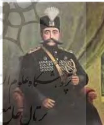
تصویر ۱۳- چهره مظفرالدین‌شاه، رقم جعفر نقاش، رنگ روغن.