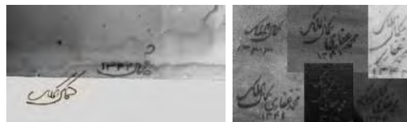
تصویر ۱۰- امضاهای برگرفته‌شده از آثار کمال‌الملک از چند کتاب و موزه که در کنار هم برای مقایسه قرار گرفته‌اند. تصویر ۱۱- امضایی که احتمال دارد در پایین اثر بوده باشد.

به کمال‌الملک سفارش‌های زیادی برای انجام نقاشی به ویژه کشیدن اشخاص شده است که در برخی دوران مانند دوره مظفرالدین شاه موجب آزار او شد، زیرا با سفارش‌های عجیبی روبه‌رو شد. اما برایش نپذیرفتن درخواست‌ها از سوی دوستان دشوار بوده است. برای نمونه بخشی از نامه وی آورده شده است که مربوط به پس از آسیب چشم و لرزش دست اوست. «این دو روزه کاغذی از طرف حضرت آقای حاجی کاظم آقای کوزه کنانی رسیده و حضرت معظم‌الیه از فدوی خواهش کرده‌اند که یک صفحه نقاشی خیلی مختصری برای یکی از دوستان ایشان تهیه نموده بفرستم. خدا گواه است که این کار ولو هر چه مختصر هم باشد از عهده فدوی خارج است. چون بندگان حضرت اجل عالی کاملاً از وضع حال مزاجی و ضعف باصره فدوی اطلاع دارید. لهذا از حضور مبارک استدعا می‌کنم که قضیه را درست حالی حضرت حاجی آقا بفرمایید که بدانند قصور در امر ایشان جهت دیگری نداشته و فقط از بابت عدم توانایی است» (دهباشی، ۱۳۶۸، ۱۶۱). به این ترتیب کمال‌الملک سفارشات را تا حد مقدور می‌پذیرفته است. حال