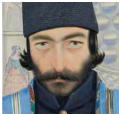
تصویر ۸- چهره اعتضاد السلطنه، اثر صنایع‌الملک، آبرنگ. مأخذ: (حسینی، ۱۳۹۱، ۲۲)