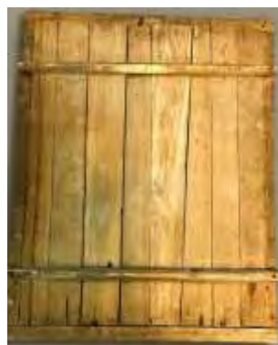
تصویر ۶- پشت بند چوبی قاب.