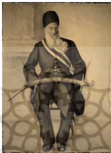
تصویر ۱- پیکرنگاره شجاع الملک (علی نقی خان میرپنج)، در اختیار آقای محمدکریم قرایی. مأخذ: (عکاس امیر اسکندری)

علی نقی خان میرپنج ملقب به شجاع الملک است. عکسی که از وی به جامانده مربوط به سال ۱۳۲۰ ه.ق/۱۲۸۰ ه.ش است که در مشهد گرفته شده است (تصویر ۲). در این عکس شجاع الملک در سمت راست، کلنل ایاس کنسول روس در مشهد در میانه و شجاع الملک قندشتی در سمت چپ قرار دارد. هفت سال بعد از عکس در ۱۷ ربیع الاول ۱۳۲۷ شجاع الملک در تربت حیدریه و سر سجاده نماز هدف تیر قرار گرفت و کشته شد. جهت انجام این ترور ۱۲ نفر از مشروطه خواهان تبریز به تربت حیدریه، دارالحکومه شجاع الملک، عازم شدند. وی به دلیل حمایت از محمدعلی شاه، ولی امر خویش، کشته شد. در کتاب تقویم تاریخ خراسان اشاره‌ای به این موضوع شده است.