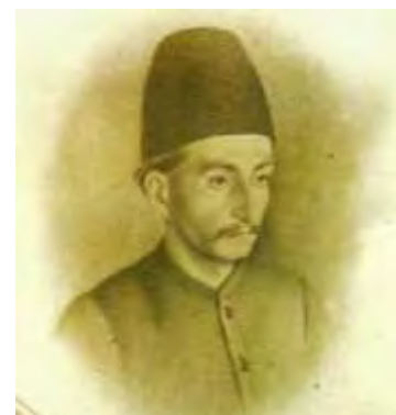
تصویر ۷- چهره علی‌آقا پیشخدمت، اثر کمال‌الملک، آبرنگ.