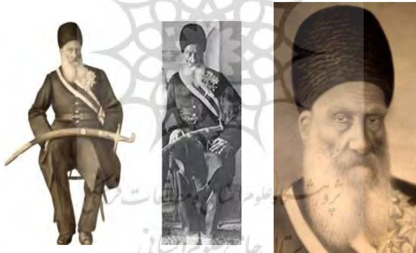
تصویر ۲۱- مقایسه بخشی از تصاویر ۱ و ۲.

تغییرات در عکس: نقاش در اجرای طراحی از روی عکس سه نفره تغییرات اساسی در جهت ترکیب‌بندی مناسب یک پیکره ایجاد کرده است و پیکره حالت ایستاتر به خود گرفته پاها از تقارن کامل خارج شده است. سر از روبه‌رو به سه رخ و به بالا تغییر کرده است. برای مقایسه بهتر تغییرات در نقاشی و عکس (تصویر ۲۱) آورده شد. تغییرات در لباس کار پیچیده‌ای نیست و «تقریباً تمامی نقاشان دوران قاجار و به خصوص مصوران در طراحی حالت و لباس اشخاص شیوه کاملاً آزاد داشته و خود را در قید تقلید از عکس قرار نمی‌دادند» (مراثی، ۱۳۷۹، ۴۱۰). «کمال‌الملک نیز به شیوه اغلب نقاشان و مصوران دوران ناصری در کشیدن لباس و تزیینات آن، شیوه آزاد داشته و لباس را مطابق میل خود تغییر می‌داده است» (همان، ۴۵۱)؛ اما تغییر در زاویه چهره تنها از عهده وی بر می‌آمده است (دقت شود در تصاویر ۲۲ و ۲۳). نقاشی به جز کمال‌الملک با این توانایی شناخته‌شده نیست. چون در عین تغییر زاویه، حفظ شبیه‌سازی و حفظ سایه‌روشن صحیح چهره، پیچیدگی فراوانی دارد. این تغییرات در عکس، خود تأییدی بر انتساب به کمال‌الملک است. چهره شجاع‌الملک نیز از حالت خشک و