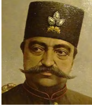
تصویر ۱۵- چهره ناصرالدین‌شاه قاجار، اثر مصورالملک، رنگ روغن.