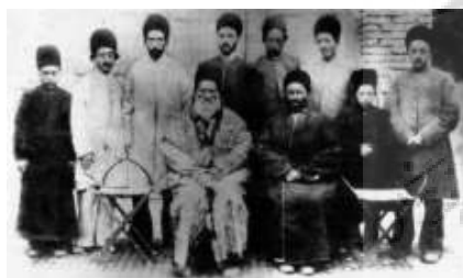
تصویر ۴- عکس دیگری از دوره کهنسالی شجاع‌الملک.

هرچند که بررسی تمام نقاشانی که در آن تاریخ در ایران مشغول به کار بودند کاری غیرممکن است اما اشخاصی که با این شیوه طراحی