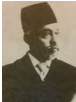
تصویر ۲۲- چهره صنیع‌الدوله. تصویر ۲۳- چهره صنیع‌الدوله، اثر کمال‌الملک، رنگ روغن، ۱۳۲۰ ق.