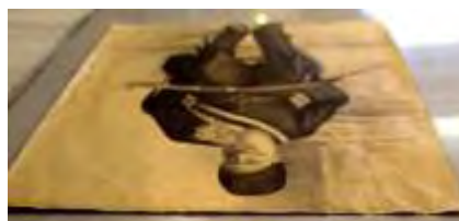
تصویر ۵- نمای جنبی اثر، برای نمایش نوع مقوا.