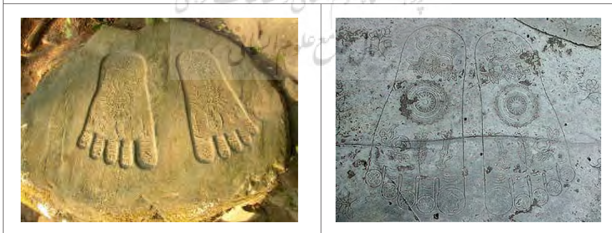
قدمگاه بودا در هند.