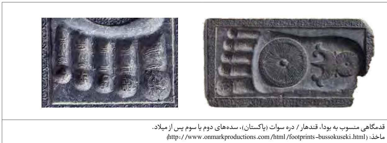
قدمگاهی منسوب به بودا، قندهار / دره سوات (پاکستان)، سده‌های دوم یا سوم پس از میلاد.