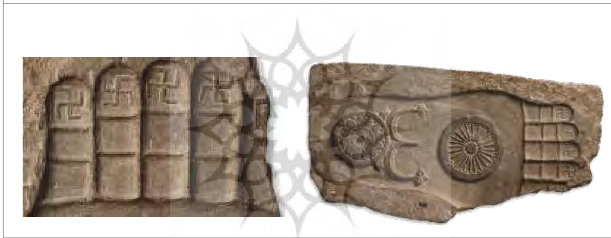
قدمگاه بودا، یافته شده از گذرگاه خیبر، استان پختون خواه.