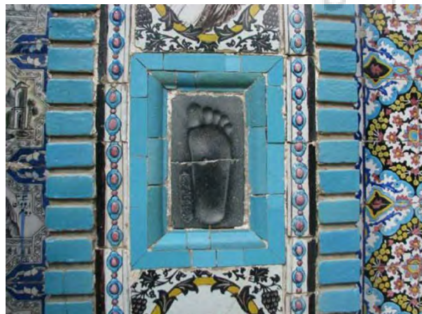
تصویر ۵- قدمگاه امام رضا، تکیه معاون الملک، کرمانشاه.