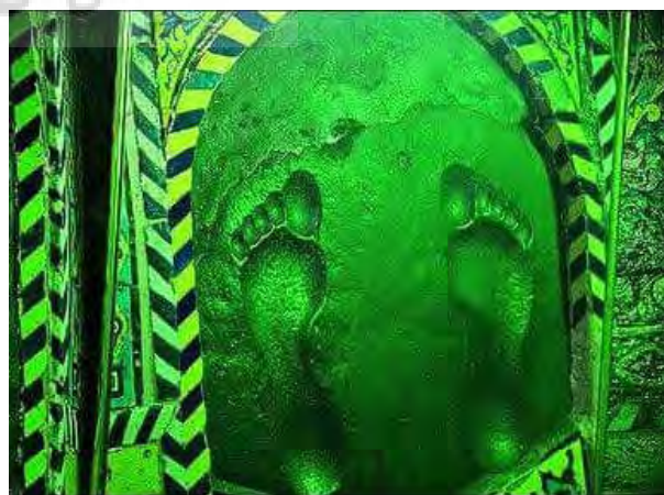
تصویر ۴- نقش قدمگاه امام رضا (ع) در نیشابور.