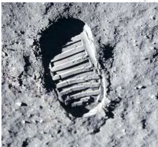
تصویر ۲- آخرین قدمگاه بشر؛ ردپای فضانورد ناسا بر روی کره ماه.

تقدس و تیمن قدمگاه‌ها، به سرآغازین دوران تاریخ اندیشه برمی‌گردد. انسان‌ها برای غلبه بر حس فقدان کسی، تلاش داشتند خاطره وجود او را در مکانی حفظ نمایند. ضایعه مرگ شخصی عزیز، برای بازماندگان بسیار دشوار بوده و نگهداری یادگارهای یک فرد گرامی و برجسته، مهم تلقی می‌شده است. اشیاء، اجسام، لوازم شخصی و حتی سخنان بازمانده از آن شخص، به مرور مورد تبرک قرار می‌گرفت و در حد اعلائی خود، مورد زیارت و نیایش قرار می‌گرفتند. موارد بی‌شماری از مکان‌ها را می‌توان یافت که به مدد حضور شخصی خاص در برهه‌ای خاص از زمان، شرف برخوردار می‌شدند. «ارض اقدس» را یافته‌اند و بدان وسیله بر دیگر مکان‌ها بالیده‌اند. چنان که امروزه در نزد مؤمنان و باورمندان ادیان ابراهیمی، سامی و میان‌رودان یادآور حضور ابراهیم نبی و امام حسین (ع)، فلسطین یادآور موسی و عیسی، مصر یادآور یوسف، حجاز یادآور حضرت محمد (ص) و سرانجام، خراسان یادآور تشریف امام رضا (ع) است. مردمان مشتاق بودند که در یک سرزمین مقدس، محل دقیق پای‌گذاری و شخص را بشناسند و با حضور در آنجا، به شخص مورد نظر تقرب جویند. پیشینه نخستین قدمگاه‌های ساخته شده، به دوران سنگی برمی‌گردد (تصویر ۱)؛ که احتمالاً به نشانه ملکیت و تصاحب زمینی بوده است. انسان‌های نخستین با این نماد می‌توانستند؛ بود و باش تاریخی خود را در محلی مورد مناقشه، اعلام و از منابع طبیعی آن سرزمین بهره‌برداری نمایند. این نماد را می‌توان در حکم نشانه‌های مرزی امروزی قلمداد کرد؛ هر چند که