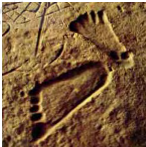
تصویر ۱- یک قدمگاه بازمانده از دوران سنگی.