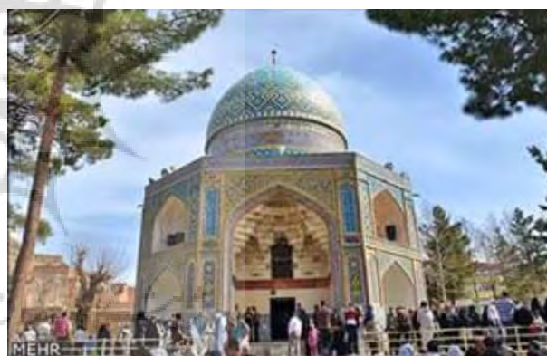
تصویر ۳- بنای قدمگاه امام رضا (ع) در نیشابور.

چند قدمگاه پیل بیت حرم ساختن (خاقانی شروانی، ۱۳۱۶، ۳۲۱)