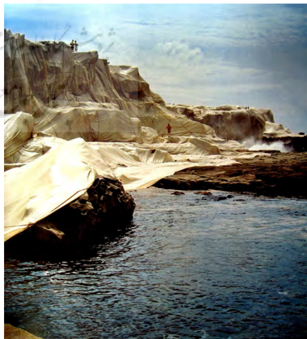
تصویر ۴- ساحل بسته‌بندی شده، کریستو، ۲۰۰۷، مکان: ساحل شمالی سیدنی در استرالیا.

هاچینسون ۱۹ معتقد است در دوره‌های جغرافیایی مختلف، فرود شهاب سنگ‌ها، سیل، طوفان و فرسایش به طور مداوم سطح زمین را ساخته، خراب کرده، چاله ایجاد کرده، هموار کرده و یا شکل به آن بخشیده است. فن هنر از نظر او عبارت است از ترکیب سطح زمین که توسط وقایع طبیعی اتفاق افتاده. در پروژه‌ای، گل‌های زیردریایی را درست کرد (تصویر ۵). هاچینسون، گل‌ها را روی سطح مثلی شکل کف اقیانوس کاشت. او هدف خود را از کاشت گل‌ها در کف دریا، استفاده از فضای آزاد که به کسی تعلق ندارد، خواند. ساختار شکنی در این اثر به این شکل است که در کف دریا گل وجود ندارد. هاچینسون عکس‌های رنگی و بزرگی را از اثری که در کف دریا