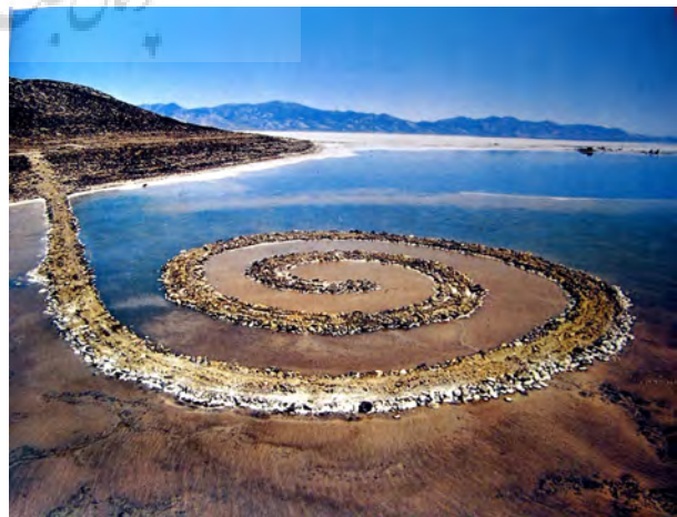
تصویر ۶- اسکله حلزونی، رابرت اسمیتسون، ۱۳۹۲، مکان: دریاچه نمک یوتا. مأخذ: (لچت، ۱۳۹۲، ۱۳۷)

اسکله‌ی ماریپچ نیز نمونه شناخته‌شده‌ای از رابرت اسمیتسون ۲۴ است که با استفاده از سنگ‌های مرمر، تخته سنگ‌ها، گل و لای، کریستال نمک و خزه‌ها، در دریاچه بزرگ نمک یوتا ساخته شد (Lailach, 2007, 88). "اسکله‌ی ماریپچ، شیفتگی اسمیتسون را به اماکن جغرافیایی و تعبیر گسترده‌ی او از آنتروپی (میزان بی‌نظمی، یا تصادف در یک منظومه) به هم می‌آمیزد تا اثری با معنای پیچیده و زیبایی‌گیرا بیافریند (تصویر ۶). شکل ماریپچ، نمادی قدرتمند از خود زندگی می‌شود که مدام به سوی بیرون گسترش می‌یابد، در حالی که هم‌زمان از درون کاسته می‌شود. اسمیتسون با این تشخیص که تعداد انگشت شماری ممکن است از آن محل دیدار کنند، خواست تا فیلمی بسازد که از روند کار سندی فراهم آورد و عقاید خود را با تماشاگران در میان بگذارد" (اسماگولا، ۱۳۸۱، ۴۰۸). این مجسمه‌ی بزرگ بین سال‌های ۱۹۷۲ تا ۱۹۹۳ در آب فرو رفت (Lailach, 2007, 88). عده‌ی اندکی موفق به دیدن اثر مزبور شدند و با توجه به دورافتادگی آن در قلب کویر، حتی در خلال چند سالی که اسکله به طور کامل به زیر آب نرفته بود نیز امکان محدودی برای تماشای آن از نزدیک وجود داشت. در واقع آنچه که همگان دیده‌اند، تنها به تصاویر و مستندات این پروژه عظیم و عکس معروفی از فراز آن که در اکثر منابع تاریخ هنر معاصر چاپ شده، امکان پذیر است (سمیع آذر، ۱۳۹۱، ۲۱۲). هدف هنر، انتقال حس چیزهاست آن سان که ادراک می‌شوند، نه آن سان که دانسته می‌شوند. هنر با ایجاد اشکال غریب و با افزودن بردشواری و زمان فرایند ادراک، از اشیاء آشنایی‌زدایی می‌کند (مکاریک، ۱۳۹۳، ۱۳). رومن یاکوبسن، در دفاع از فرمالیست روسی اعلام کرد: آنچه ما کوشیده‌ایم نشان دهیم این است که