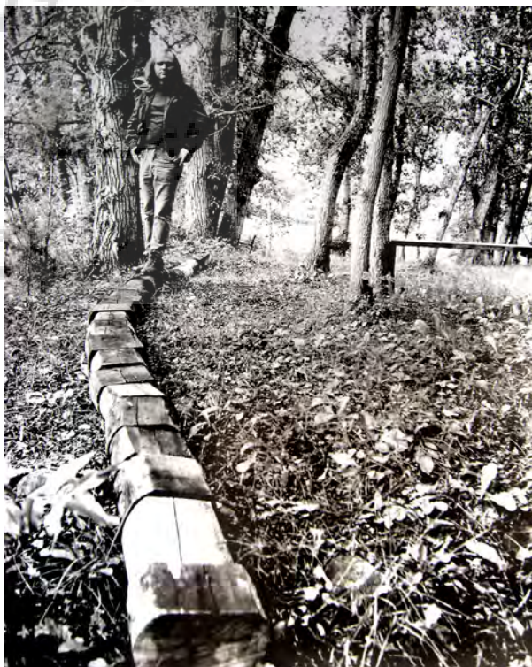
تصویر ۱- تکه‌های الوار، کارل آندره، مکان: آسپن کلرادو، ۱۹۶۸. مأخذ: (Lailach, 2007, 26).

از دیگر آثاری که می‌توان برای ادغام اثر در محیط طبیعی نام برد، حلقه‌های خورشید اثر نانسو هولت ۱۴ است (تصویر ۲). پس از جستجوهای طولانی، نانسو هولت یک جای مناسب برای طرح خود پیدا کرد. یک زمین ۱۶ هکتاری که در آنجا ۴ لوله سیمانی بزرگ را، هر یک به طول تقریبی ۶ متر قطر ۳ متر و به وزن چند تن، در ۲ ردیف قرار داد تا شکل X باز را درست کند. سوراخ‌های ایجاد شده بر روی این تونل‌ها با اندازه‌های مختلف، این تونل‌ها را آراسته بودند و وضعیت قرارگیری آنها نسبت به هم شبیه به قیاس ۴ صورت فلکی بود؛ در طول روز نور خورشید از داخل این سوراخ‌ها به داخل تونل‌ها می‌تابد و یک شکل جالب را از دایره‌ها در داخل آن ایجاد می‌کند که با یکدیگر ادغام می‌شوند. این لوله‌های سیمانی، دید منظره و نور را متمرکز می‌کند و با این کار، درک بیننده را از چشم‌انداز به ظاهر بی‌انتهای صحرا قوی‌تر می‌کند. "من قصد دارم تا فضای وسیع صحرا را به مقیاس انسان برگردانم". وی این عبارت را در توصیف کارش در مجله میگزرد هنر ۱۵ بیان کرد و در ادامه گفت: "من قصد ساختن یک بنای خرسنگی را نداشتم". دید پانورامیک (گنبد رنگی و پر نقش و نگار) منظره، بدون کمک گرفتن از منابع بصری، کاری طاقت فرساست. در هنگام دید این مناظر، دید ما کمرنگ می‌شود به جای اینکه قوی‌تر باشد. از طریق این تونل‌ها، بخشی از منظره وارد یک قاب می‌شود و قابل تمرکز می‌گردد. "با داخل شدن به این تونل‌های سیمانی دید شما محدودتر می‌شود و شما خود را در