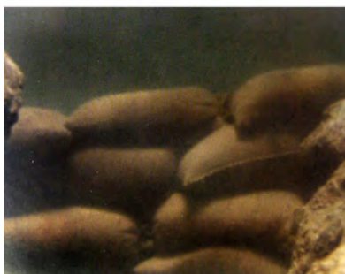
تصویر ۵- گل‌های زیردریایی، ۲۰۰۷، هاچینسون، مکان: کف دریا در Tobago.

بوردیو درباره‌ی عمل و بیان خلق و خواها در مکان اجتماعی است. مکان نیز میدانی اجتماعی است، زیرا مواضع آن، نظامی از روابط را تشکیل می‌دهند که بر ستون‌هایی (قدرت) مبتنی‌اند که معنادار و مورد تقاضای اشغال‌کنندگان مواضع مکان اجتماعی هستند. عادت، نوعی بیان سرمایه‌گذاری (ناآگاهانه‌ی) اشغال‌کنندگان مکان اجتماعی در ستون‌های قدرت است (همان، ۸۱). انتقاد از نظام سیاسی - که جزء موضوعات ادبی نیست - محرکی هنری دارد و به طور کامل در روایت گنجانده می‌شود. در وهله‌ی اول به نظر می‌رسد که در این برداشت، بر محتوای ادراک جدید تأکید شده است ("هراس" در "جنگ" و "گشمکش طبقاتی"). اما در واقع آنچه برای توماشفسکی جالب است، تبدیل هنری یک "ماده‌ی غیرهنری" است. بیگانه‌سازی یا آشنایی زدایی، واکنش ما را در مقابل جهان تغییر می‌دهد، اما این کار را فقط با تسلیم ادراک‌های معمول ما به فرایندهای قالب ادبی انجام می‌دهد (سلدن، ۱۳۸۷، ۵۰).