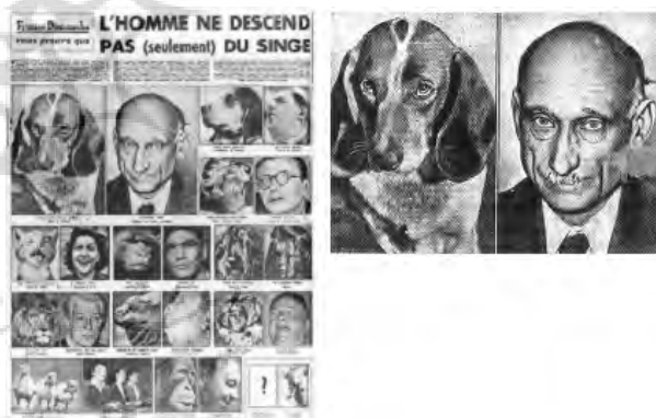
تصویر ۵- کنار هم نهی تصاویر شخصیت‌ها و حیوانات، «انسان و حیوان»، تصویر رابرت شومان سیاستمدار و دولتمرد فرانسوی در کنار تصویر یک سگ، نشریه فرانس-دیمانش، شماره ۵۱، ۹۱-آوریل ۵۹۱. مأخذ: (Baltrusaitis, 1996, 15)

در این کتاب، طبقه‌بندی افراد بر اساس هر حیوان صورت گرفته است، برای مثال اشرافیت به شیر نسبت داده شده، یا