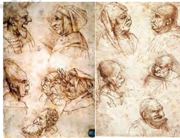
تصویر ۱۰- طراحی‌های پرتو فیزیوگنومیک، لئوناردو داوینچی، گالری دلا آکادامیا، ونیز.

از میان نقاشان معروف دوره رنسانس، می‌توان به لئوناردو داوینچی اشاره نمود که به علم کهن و کلاسیک قدیم به ویژه فیزیوگنومی که توسط چندین نفر از علمای آن دوران ارائه شده بود، علاقه وافری داشت. بیشتر مطالعاتی که انجام شده، از نظم و انضباط علمی و هنری وی حکایت دارد. در بین برخی محققین هنر، تمایل زیادی وجود دارد که لئوناردو، همچون یکی از پیشگامان اولیه هنر مدرن معرفی و دیده شود و کارهای او را از مدل‌های مفهومی علمی فیزیوگنومی جدا سازند. برخی از پژوهشگران معتقدند که لئوناردو در نوشته‌هایش در مورد فیزیوگنومی و رویکرد چهره‌نگاری‌هایش، از فکاهی و طنز استفاده می‌کرده است و این امر بر روی سایر هنرمندان نیز تاثیرگذار بوده است. در واقع به نظر می‌رسد اغلب طرح‌های وی، چیزی مابین فیزیوگنومی