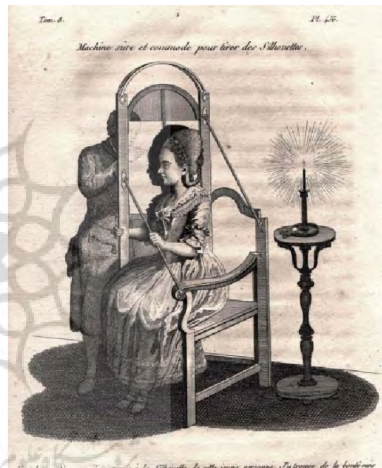
تصویر ۱ - «دستگاه تصویر نیم‌رخ»، دستگاه و سیستم انتقال و کشیدن طرح سایه‌ای صورت، از کتاب هنر شناخت انسان توسط فیزیونومی، کاسپار لاواتر.