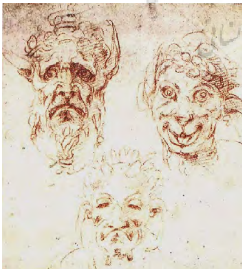
تصویر ۱۱- طراحی فیزیوگنومیک، میکل آنژ، ۱۵۳۰ میلادی، موزه بریتانیا، لندن.

لئوناردو داوینچی در یادداشت‌هایش در یک رساله نقاشی، به هنرمندان جوان، چگونگی سرعت در طراحی صورت شخص را به نحوی که آن را در ذهن به یاد داشته باشند، توصیه کرده است: «من نباید درباره صورت‌های هیولایی صحبت کنم زیرا آنها به آسانی در ذهن نگهداری می‌شوند». شیفتگی لئوناردو به نهایت استفاده از امکانات و ویژگی‌های چهره در تعداد زیاد طرح‌هایی که به طور گسترده بوسیله شاگردانش و هنرمندان بعدی همچون ونسلوس هولار ۱۶ تقلید شده بود، قابل ملاحظه است. در یکی از طرح‌های هولار چهره‌هایی دیده می‌شود که کنار هم نهاده شده - در سمت چپ و راست بالا - و فیگورهایی با ویژگی‌های اغراق‌آمیز و تیپ‌های آرمانی شده به نمایش درآمده‌اند. در بالا و در مرکز، چهره موجودی با ویژگی‌های تخیل مآبانه دیده می‌شود که از حالت انسانی دور شده است.