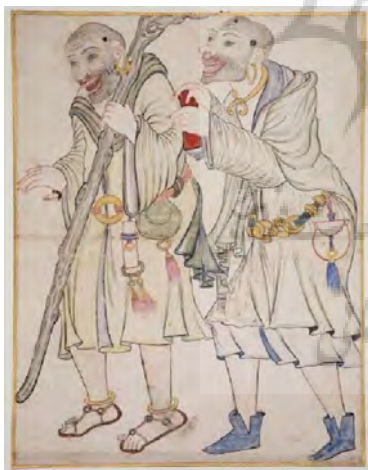
تصویر ۲۳- دو درویش عجیب و غریب، احتمالاً تبریز، اواخر قرن نهم هجری، کلکسیون خلیلی.