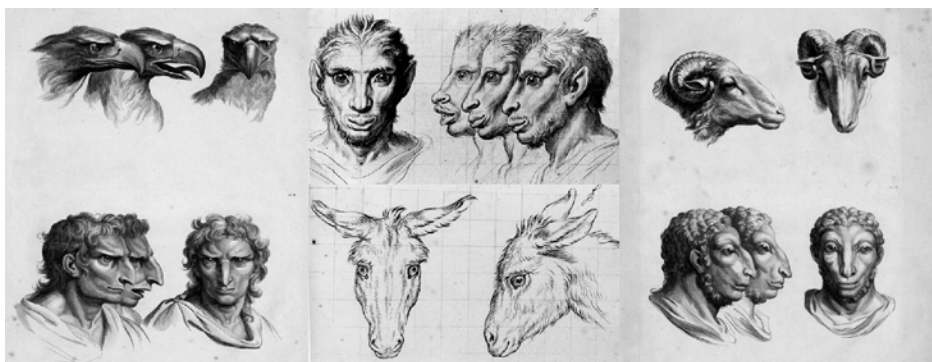
تصویر ۷- فیزیونومی سر انسانی متناسب با سر عقاب، سر خر و سر قوچ، شارل لوبران، قرن هفدهم میلادی.