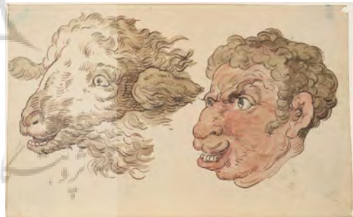
تصویر ۱۲- مرد با سر گوسفند سان، توماس رولاندسن، قرن هجدهم-نوزدهم میلادی، قلم و مرکب قهوه‌ای، ۱۰٫۴ X ۱۶٫۸ سانتیمتر، موزه هنر پرینستون.