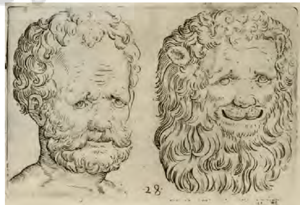
تصویر ۳ - مدل شیروانسان شیرسان، تصویرسازی، جیامباتیستا دلا پورتا، فیزیونومی انسانی، ناپل، ۱۶۰۲ میلادی، موسسه تحقیقات گیتی. مأخذ: (Baltrusaitis, 1996, 25)