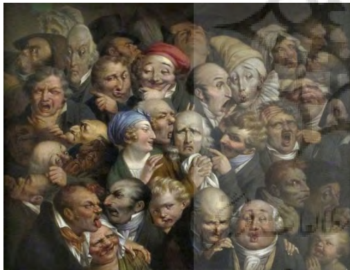
تصویر ۱۷- جمع سی و پنج چهره با حالات بیانی مختلف، لویی-لوپارد بویلی، ۱۸۲۳-۱۸۳۵، مجموعه ویلیام آی کوچ، نیویورک.

در ایران نیز می‌توان تأثیرات چهره خوانی و فیزیوگنومی را در هنر ملاحظه نمود. یکی از مهم‌ترین نقاشانی که آثار وی را می‌توان در این حوزه جای داد، غیاث‌الدین محمد نقاش، هنرمند دوره تیموری و زمان شاه رخ است. نگاره‌های وی با شیوه‌های متداول نگارگری ایرانی