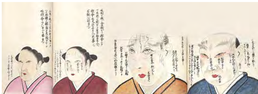
تصویر ۱۹- نسخه خطی در ارتباط با فیزیوگنومی، تصویرسازی با قلم و مرکب و رنگ، ۲۶ برگه، ۲۴۱×۲۸۵ میلی متر، قرن نوزدهم میلادی، ژاپن.