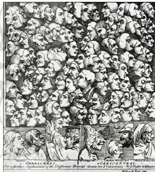
تصویر ۱۶- شخصیت‌های فیزیوگنومیک و کاریکاتوری، ویلیام هوکارث، ۱۷۴۳ میلادی، کتابخانه عمومی نیویورک.

بودند، در طول سه دوره پادشاهی به شبه جزیره کره انتقال پیدا نمود. فیزیوگنومی در زمان سلسله کوریو ۲۲ (۹۱۸-۱۳۹۲ میلادی) و چوسان ۲۳ (۱۳۹۲-۱۸۹۷ میلادی) توسعه یافته بود، به ویژه اینکه بودیسم جریان اصلی آن بود. فیزیوگنومیست‌های مشهور کوریو، دوزئون ۲۴ ، هی جینگ ۲۵ و موها ۲۶ همگی راهب بودند. در سلسله چوسان، علمای معروفی همچون سوکیونگ-داک ۲۷ و لی یول-گوک ۲۸ راهبان بودایی بودند که به علم فرنولوژی یا جمجمه‌شناسی نیز تسلط داشتند. فرنولوژی، به خصوص همچون نکته مهم در درمان بیماری‌ها، حتی در کتاب علم پزشکی هئوژون نیز آمده بود. فرنولوژی، ستاره‌شناسی و طالع بینی بود که بر روی فرد تمرکز می‌نمود، نه تنها بر روی شکل صورت شخص، بلکه بر روی دست، پا و کل بدن. ولی صورت، مهم‌ترین قسمت بود (www.sac.or.kr). در هند فیزیوگنومی نیز با توجه به وجود اساطیر و خدایان هندی از توجه خاصی برخوردار بود. در فرهنگ اساطیری هند، خدایان، ترکیبی از جانوران و حیوانات بوده و دارای قدرت خارق‌العاده و مافوق بشری هستند؛ با این وجود، علائم و نشانه‌های همان