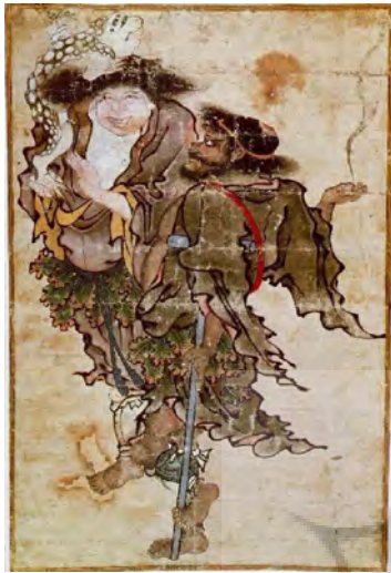
تصویر ۲۲- دو داتونبست جاودان، غیاث الدین محمد نقاش، قرن نهم هجری، مکتب تبریز. مأخذ: (www.pinterest.com)

و روضه‌الصفای میرخواند است. ارتباط با چین گرچه کوتاه مدت بود ولی موج جدیدی از تأثیر نقش‌مایه‌های چینی را در هنر تیموری به دنبال داشت» (آزند، ۱۳۸۷، ۲۷). البته نفوذ تأثیرات هنر چین بر نگارگری و نقاشی ایران از زمان مغولان و در دوره ایلخانی آغاز شده بود. این تمایل و دقت در ترسیم جزئیات دقیق چهره و اغراق در آنها، در طراحی‌ها و آثار محمد سیاه قلم، را می‌توان در هنر چهره‌نگاری چین و هند ملاحظه نمود.