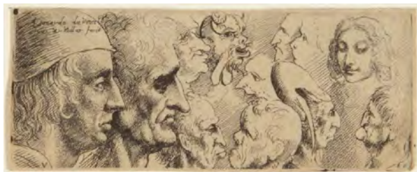
تصویر ۱۵- طراحی سرها، گراوور، ونیسلاس هولار، ۱۶۴۵ میلادی.