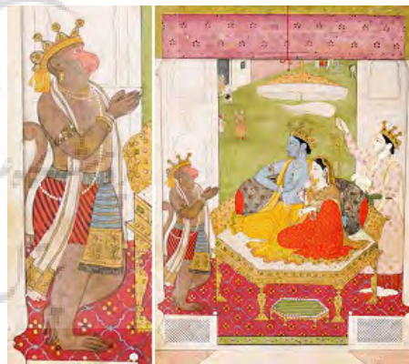
تصویر ۲۱- راما و سینتا نشسته بر روی اریکه سلطنتی با لاکشمن با لاکشمن و هانومان، پاهری، حدود ۱۸۰۰-۱۸۰۵ میلادی، گواش با طلا روی کاغذ، ۱۹.۹ X ۱۴.۴ سانتی متر.