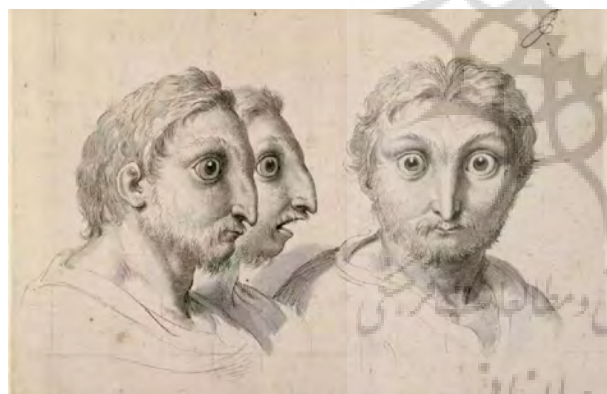
تصویر ۶- فیزیونومی، طرح چهره انسان جغد، شارل لوبران، قرن هفدهم میلادی.

از سوی دیگر، دلایورتا در کتاب فیزیونومی، در خصوص ارتباطات گاهی نیز توضیح می‌دهد که «در ماهی‌ها، سبزه‌ها و درختان