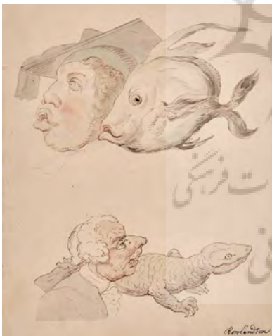
تصویر ۱۴- مرد با سر ماهی سان و مارمولک سان، توماس رولاندسن، قرن هجدهم-نوزدهم میلادی، آبرنگ و مرکب قهوه‌ای، ۱۸ X ۲۲٫۵ سانتی متر.

گراوورها و نقاشی‌های هوگارت، منبعث از شرایط اجتماعی و سیاسی زمان خویش بود. چهره‌هایی که در بعضی از آثار او ترسیم شده، شخصیت صاحبان آن را نشان می‌دهد. در یکی از آثار کاریکاتور فیزیونومیک وی، مجموعه‌ای از چهره‌ها و شخصیت‌های گوناگون ترسیم شده‌اند. این انبوه نگاری چهره‌ها و شخصیت‌های کاریکاتوری، در اثری از نقاش فرانسوی، لویی-لئوپولد بویلی، نقاش دوران انقلاب فرانسه نیز، مشاهده می‌شود. برخی از نقاشی‌های وی، بین مرزهای فیزیونومی علمی و کاریکاتور جای می‌گیرند، با این وجود در بسیاری از آنها این مرزها شکسته شده و نمی‌توان بین آنها محدود و مرز ایجاد کرد.