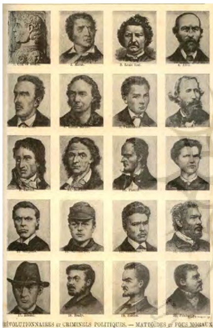
تصویر ۲ - برگه ای از کتاب «انسان‌شناسی جنایی» اثر چزاره لومبروزو.

مجموعه سرانان. در قرن نوزدهم میلادی، یک فیزیکی‌دان ایتالیایی به نام چزاره لومبروزو، نوشت که رفتارهای جنایی اشخاص را می‌توان از روی برخی از مشخصات فیزیکی، از جمله ویژگی‌های بدوی و میمون مانند، پیش‌بینی نمود (Jenkinson, 1997, 5). مطمئناً چنین تصاویری در ادبیات فیزیونومی، در حاشیه تصویرسازی تشریحی و آناتومی قرار می‌گرفت، ولی متون و نوشته‌های دلپورتا درباره شکل ابرو، طول بینی و وسعت چانه، به جزئیات زیادی اشاره کرده است. وی همچنین نقش مهمی در تاریخ تطبیقی آناتومی - که خود به تنهایی یک حوزه وسیع می‌باشد - بازی می‌کند. یوهان کاسپار لاواتر ۳ ، به طور خاص به خاطر اثر مشهورش در رابطه با فیزیونومی معروف شده است که در آن، مشاهدات فیزیکی یک شخص و به ویژه چهره وی، اجازه می‌دهد تا شخصیت، احساسات و