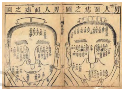
تصویر ۲۰- فیزیونومی کامل هامپ روب (زنگشی مای شیانگ فا کائپیان Zengshi mayi xiangfa quanpian)، کیو زونگ کنگ، قرن نوزدهم میلادی، کتابخانه ملی استرالیا.

تفاوت‌هایی دارد. از مهم‌ترین ویژگی‌های آن، ترسیم شخصیت‌ها و موجودات غیرمعمول با چهره و فیگورهای عجیب و غریب است که شامل دیوان، ددان، شیاطین، سیاهان، دراویش و سایرین است. در برخی از چهره‌ها، شخصیت فرد به نمایش درآمده است. به برخی نیز می‌توان شیوه کاریکاتور اطلاق نمود (مشابه آنچه در آثار لئوناردو و هنرمندان چینی و هندی دیده می‌شود). شیوه عجایب‌نگاری و طرح‌های گروتسک وی نیز برگرفته از فرهنگی خارج از حوزه ایران است و بیشتر به نقاشی چینی، اویغوری و بوداییان هند نزدیک است. این تأثیرپذیری نیز مربوط به سفر و ارتباط وی با چین و کشورهای است که در مسیر آن قرار داشت و باعث ورود عناصر چینی به ایران شد. این مطلب در برخی از اسناد نوشته شده است: «...گزارش وی [غیاث‌الدین نقاش] ضمیمه تاریخ حافظ ابرو و مطلع سعدین عبدالرزاق سمرقندی