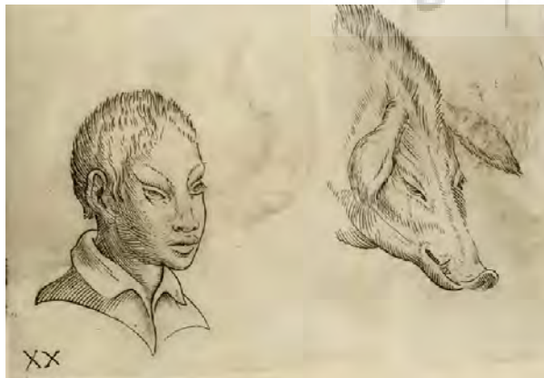
تصویر ۴ - انسان سان، خوک سان، تصویرسازی، جیامباتیستا دلا پورتا، فیزیونومی انسانی، ناپل، ۱۶۰۲ میلادی، موسسه تحقیقات گیتی. مأخذ: (Baltrusaitis, 1996, 19)