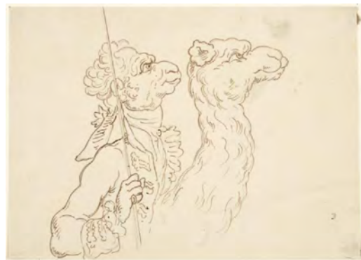
تصویر ۱۳- مرد با سر شتر سان، توماس رولاندسن، قرن هجدهم-نوزدهم میلادی، قلم و مرکب قهوه‌ای، ۱۱٫۹ X ۱۶٫۵ سانتیمتر، موزه هنر پرینستون. مأخذ: (artmuseum.princeton.edu)