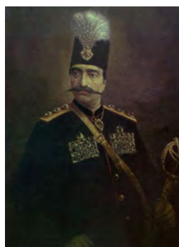
تصویر ۲- پوشش سنتی فتحعلی شاه اثر استاد مهرعلی.

در این کشورها، ماحصل تغییر [بنیادین] در ساختار جامعه نبود، بلکه ایشان تنها به شوق جبران عقب‌ماندگی و کسب قدرت بیشتر در راستای سیر به نوسازی به سیاق اروپایی آن گام برداشتند (موسوی حاجی و ظریفیان، ۱۳۹۳، ۷-۱۹۶). در این میان، تأثیر و نفوذ فکری غرب در بین ایرانیان و نحله برداشت ایشان از اروپاییان را عین السلطنه چنین توصیف می‌کند: «هرچه افعال بی‌معنی فرنگی‌ها بوده، آموخته‌ایم، هرچه صنایع و قانون‌های خوب داشته‌اند کنار گذاشته ابدأً ملاحظه نکرده‌ایم. از فرنگی‌مآبی عصا دست گرفتن، عینک گذاشتن، پیراهن و دستمال گردن پوشیدن و بستن، سیگار کشیدن، تندتند حرف زدن، سرو دست در وقت تکلم جنباندن، عرق و شراب وافر خوردن را یاد گرفته‌ایم. دیگر آن چیزهای خوب را یاد نگرفته‌ایم و در حقیقت همین کارها کفایت می‌کند» (عین السلطنه، ۱۳۷۴، ۲-۵۵۱). (تصویر ۱).