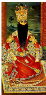
تصویر ۳- پوشش نوین ناصرالدین شاه اثر کمال الملک که تحول رخ داده در نوع پوشش ایشان مشهود است.

این تغییرات منحصر به لباس مردان نمی‌شد. حضور خیاطان و طراحان اروپایی بالاخص فرانسوی در موج تغییرات ظاهر جامعه، به ویژه زنان بی‌تأثیر نبود (موسوی حاجی و ظریفیان، ۱۳۹۳، ۲۰۴). در تطورات پیش آمده پیرامون البسه زنان ۴ ، سفرهای ناصرالدین شاه به فرنگ یکی از موثرترین عوامل بر تغییرات پیش آمده بود (زاهد زاهدانی و دیگران، ۱۳۸۹، ۶۱)، که الگویی نوین از پوشش را در میان ایرانیان رواج داد. جیمز موریه ۵ در توصیف البسه ایرانیان در قرن نوزدهم بیان می‌دارد: «جامه ایرانیان از زمان سفرشاردن تا کنون دگرگونی بسیاری یافته است. این جامه هیچ‌گاه در ارزش و پایداری به پای جامه ترکان نمی‌رسیده و اینک بیش از پیش،