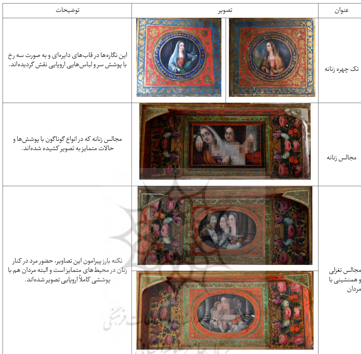
جدول ۱- تحلیل و واکاوی تصاویر زنان در عمارت صارم الدوله.

نقاشی‌های عمارت صارم الدوله دریافت که در آن ناصرالدین شاه و میرزا آقاخان وزیر در دو هیبت کاملاً متمایز نوین (با پوششی شبیه نظامیان) و سنتی به تصویر درآمده‌اند.