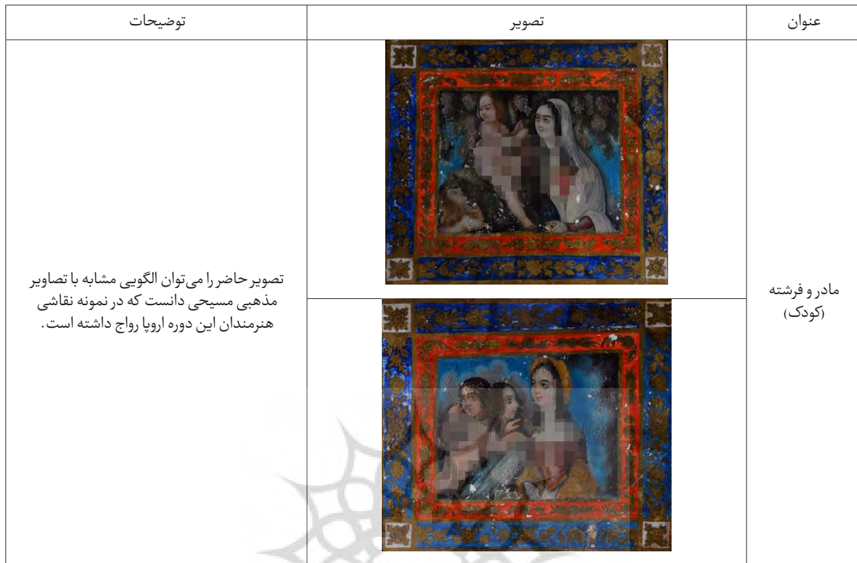
جدول ۴- تحلیل و واکاوی تصاویر فرشته و بهشت به صورت فرنگی در سقف عمارت صارم‌الدوله.

فرنگ بوده‌اند و به نظر می‌رسد که با کپی برداری از کارت پستال‌های اروپایی و تنها به عنوان عنصری تزئینی ترسیم گردیده‌اند.