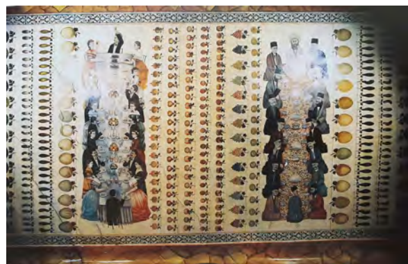
تصویر ۱- نقاشی سقف قصر سردار ماکویی، نمودی از تحول جامعه ایرانی عصر قاجار. ماخذ: (سیف، ۱۳۷۹)

• دوره سوم: متأثر از جریان مشروطه و تضاد فرهنگی میان دو گروه سنتی متشکل از روحانیون و گروه روشنفکران اکثراً