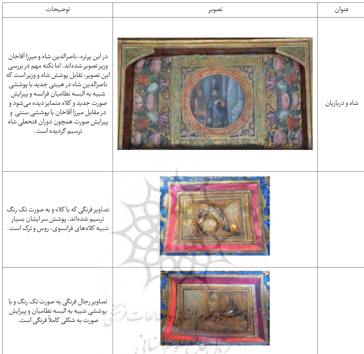
جدول ۲- تحلیل و واکاوی تصویر شاه، درباریان و رجال فرنگی موجود در عمارت صارم الدوله.

می‌نویسد: «سالنی بزرگ نقاشی و طلاکاری شده است. یک نقاشی بزرگ از جنگ ایران و روسیه در آن به چشم می‌خورد که پادشاه با اسب سفیدش کاملاً مشهود و قابل شناسایی است» (Diba, 2006, 99). در تصویر موجود در عمارت صارم الدوله، آرایش جنگی فرانسه و روسیه که در بسیاری از تابلوهای نقاشی اروپایی مورد اقبال بوده، مشاهده می‌شود. پوشش سربازان بسیار مشابه با پوشش اصلی نظامیان این دو ملت در قرن ۱۸ و ۱۹ است که احتمالاً براساس الگوی تابلوها یا تصاویر کارت پستالی این دوران که به سوغات آورده می‌شدند، ساختار یافته‌اند. بخش دیگر تصاویر مورد اقبال در دیوارنگاره‌ها، تصاویر روایتی است که عموماً روایتگر حادثه یا داستانی از کتب ادبی و تاریخی ایران است. در این عمارت، این دست تصاویر نیز متحول گردیده و در قالب‌هایی جدید با مضامینی