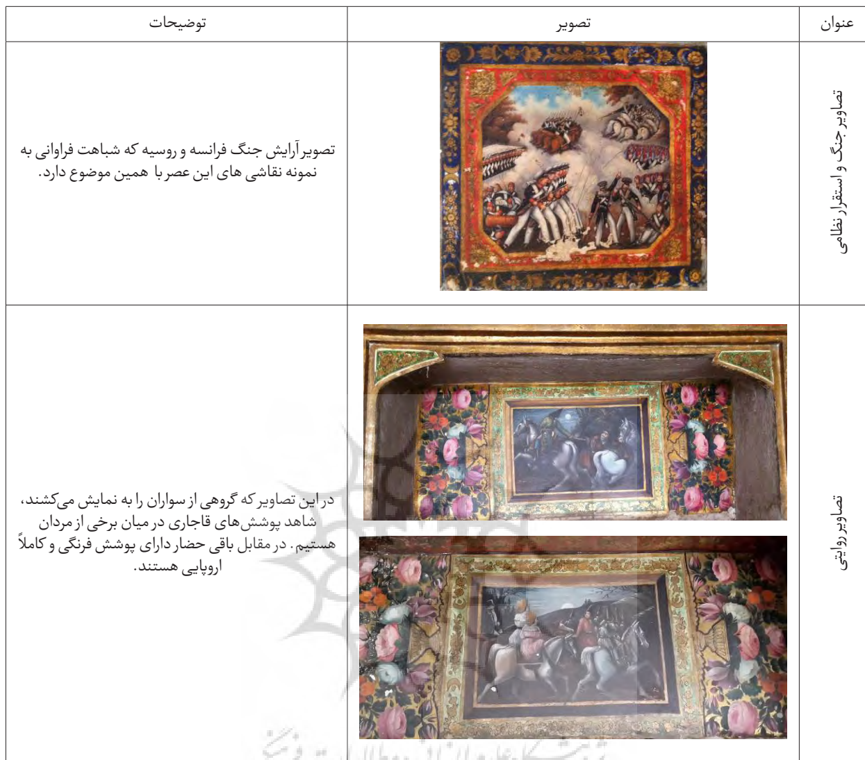
جدول ۳- تحلیل و واکاوی تصاویر آرایش جنگی و تصاویر روایتی عمارت صارم الدوله.

انسانی زنانه به جای خواهد ماند؛ • فرشتگانی که هیبت انسانی دارند و هیچ تفاوتی با انسان‌ها ندارند. این فرشتگان تنها گونه‌ای از فرشته‌ها به صورت بدون بال هستند؛