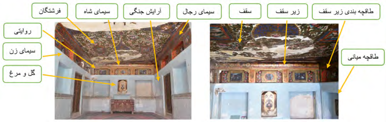
تصویر ۵- جانمایی دیوارنگاره‌ها بر طبق مضامین.

همواره به تصویر کشیدن سیمای شاه، نمودی از نمایش شکوه