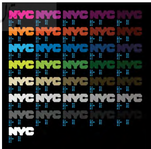
تصویر ۷- پالت رنگی مورد استفاده در طرح هویت بصری شهر نیویورک.