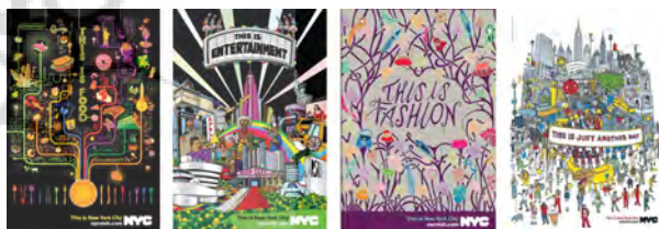
تصویر ۱۲- نمونه پوسترهای طراحی شده برای کمپین «این نیویورک است»، با به‌کارگیری لوگوی شهر برای معرفی شهر و طرح هویت بصری آن. ماخذ: (www.underconsideration.com).

به مجموعه نشانه‌هایی که ما را در جهت انتخاب بهتر مسیر یاری و به چالش‌های ترافیکی، حمل و نقل و عبور و مرورمان پاسخ می‌دهند، سیستم مسیریابی می‌گویند که برخی عناصر این مجموعه‌ی نشانه‌ها، نوشتاری و برخی دیگر تصویری بوده که با موضوع، ارتباط مستقیم برقرار کرده و برخی دیگر طرحی انتزاعی دارند؛ این مجموعه علائم و نشانه‌ها می‌توانند جایگزینی برای پرسیدن کلامی و فرد به فرد درباره‌ی مقصد مورد نظر باشند. در طراحی این نوع از نشانه‌ها، آنچه از اهمیت بسیار برخوردار می‌باشد این است که وضوح و سادگی برای انتقال سریع اطلاعات، ویژگی طرح باشد و هر چه علائم مبهم‌تر باشند، نتیجه ناموفق‌تر محسوب می‌شود. انواع علائم جهت‌یابی می‌توانند اطلاعاتی، شناساننده، آموزشی، قانونی و یا تبلیغاتی باشند (سپهر، ۱۳۹۰، ۱۲۰). در طراحی سیستم مسیریابی شهر سانتامونیکا، به شکل مطلوبی از عناصر سازنده‌ی هویت بصری شهری مانند رنگ‌ها و نشانه‌ی شهر بهره گرفته شده است؛ در این سیستم در کنار و یا پس‌زمینه‌ی تابلوهای خوشامدگویی و معرفی مکان‌ها، از نشانه‌ی جدید شهر، فونت و رنگ‌های هویت بصری آن استفاده شده است و از این طریق