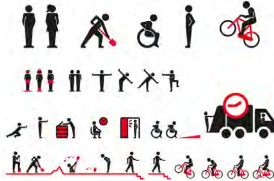
تصویر ۱۵- مجموعه‌ی پیکتوگرام‌های مدولار در هویت بصری جدید آمستردام.

محصول، سازمان و یا مکان درگیر کند، اطلاعاتی درباره‌ی آن بدهد و به اشاعه‌ی آن بپردازد؛ گستردگی دامنه‌ی این رسانه‌ها به قدری است که نام بردن تمامی آنها در این مقاله میسر نبوده و همچنین لازم به ذکر است در اجرای برخی از طرح‌ها، انتخاب رسانه برعهده‌ی متخصصانی غیر از طراحان گرافیک است، به همین دلیل بحث مفصل تر آن را به متخصصان امر واگذار می‌کنیم.