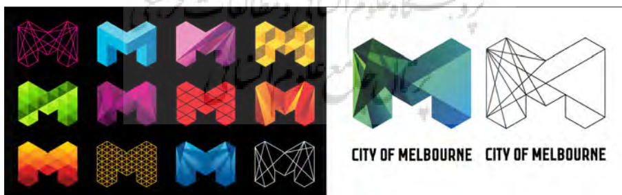
تصویر ۲- نشانه‌ی هویت بصری شهر ملبورن و قابلیت به کارگیری رنگ‌ها و پترن‌های متنوع در آن.