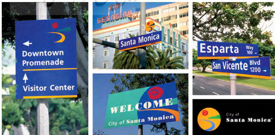
تصویر ۱۳- سیستم مسیریابی شهر سانتامونیکا، طراحی شده به صورت هماهنگ با مؤلفه‌های هویت بصری شهر و بهره‌گیری از نشانه‌ی شهر در طراحی آن.