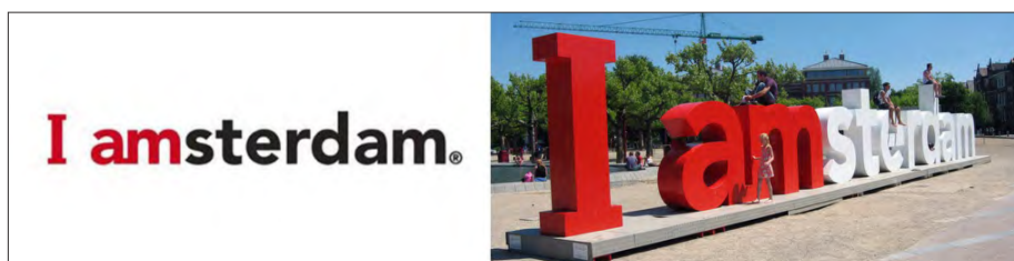
تصویر ۱۱- لوگوی طراحی شده برای کمپین I amsterdam به صورت هماهنگ با رنگ‌ها و فونت هویت بصری شهر و اجرای آن در قالب حجم در فضای شهری.