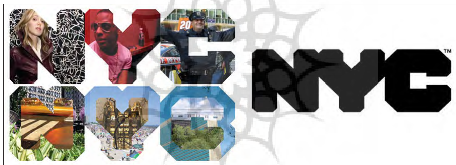
تصویر ۱- نشانه‌ی طراحی شده برای هویت بصری شهر نیویورک و نمونه‌ای از ساخت تصاویر چند لایه برای نمایش تنوع و تحرک شهر.

در سال ۲۰۰۷، سفارش طراحی هویت بصری برای شهر نیویورک به استودیوی مشهور برندسازی و تبلیغات ولف اولینز ۲۰ داده شد؛ استفاده‌ی زیاد از نشانه‌ی طراحی شده برای شهر در سازمان‌ها و موقعیت‌های مختلف، با ایجاد تصویری واحد از شهر، بازدیدکننده‌های آن را، یک سال پس از انتشار، ۵ درصد افزایش داد. نشانه‌ی طراحی شده می‌تواند نماینده‌ی خوبی برای شهر نیویورک باشد؛ مونوگرامی کوتاه قد، ضخیم و فشرده که فاصله‌ی کم بین حروف آن، نشانه‌ای است از فضاهای فشرده‌ی شهری نیویورک و این واقعیت ناراحت‌کننده که در این شهر تا چه اندازه فضای خالی کم یافت می‌شود. همچنین ضخامت حروف حس قدرتمند بودن شهر را در بسیاری از زمینه‌ها القا می‌کند (تصویر ۱) (Millman, 2012, 27). نمونه‌ی نشانه‌ی شهری موفق دیگر، مونوگرام ملبورن است که توسط شرکت لندنرزا ۲۱ سیدنی طراحی شده و شامل یک حرف