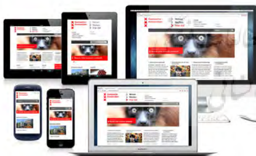
تصویر ۱۰- به‌کارگیری عناصر هویت بصری آمستردام در وبسایت شهر.

لغت کمپین در اصل به معنای یک عملیات نظامی یا سیاسی در یک ناحیه‌ی محدود بر روی گروه هدف مشخص با قصد و نیت از پیش تعیین شده است. زمانی که از کمپین تبلیغاتی نام می‌بریم نیز تقریباً معنای مشابهی مدنظر است؛ در یک کمپین تبلیغاتی پیامی با استفاده از رسانه‌های جمعی به اطلاع مصرف‌کنندگان می‌رسد که درباره‌ی موضوع مورد تبلیغات است و می‌تواند آموزنده، متقاعدکننده و یا آگاهی‌دهنده باشد (اینتربرند، ۱۳۹۴، ۱۲). هدف یک کمپین تبلیغاتی بسته به جایگاه محصول می‌تواند کسب سهمی