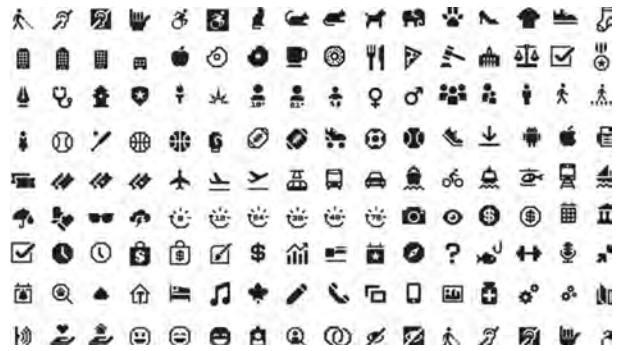
تصویر ۱۴- مجموعه‌ی پیکتوگرام‌های طراحی شده برای هویت بصری جدید نیویورک.

طراحی هویت بصری به تنهایی مسئله نیست، به اشتراک‌گذاری گسترده و هوشمندانه‌ی آن است که می‌تواند تمایز ایجاد کند؛ به این دلیل متخصصان امر، در این باره تصمیم می‌گیرند که طرح هویت بصری و دیگر عناصر هویتی برند را، در چه زمانی و چه بستری به نمایش بگذارند و به عبارتی با مخاطب خود تماس ایجاد کنند. رسانه‌های مختلفی وجود دارد که مخاطب یا مصرف‌کننده را، با