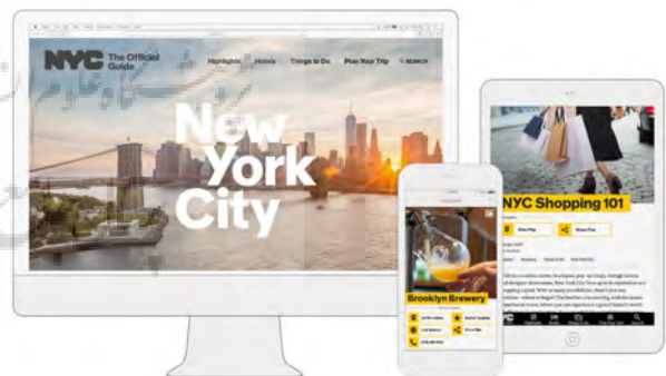
تصویر ۹- به‌کارگیری عناصر هویت بصری شهری نیویورک در وبسایت شهر.