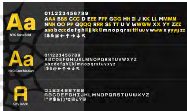
تصویر ۴- فونت‌های به‌کار گرفته شده در هویت بصری نیویورک.

تعریف و تدقیق تایپ فیس‌های مورد استفاده و در بعضی موارد طراحی نوعی تایپ فیس منحصر به فرد برای خدمات مزبور، از دیگر بخش‌های اصلی طرح هویت بصری هستند. تایپ فیس، عبارت است از یک مجموعه‌ی حروف و انواع آن در یک اندازه‌ی معین، یا بیش‌تر که با سبک معین و یکپارچه طراحی شده و شامل حروف الفبا، شماره و علائم نگارشی است. طراحی یک مجموعه فونت و یا تایپ فیس دارای ویژگی‌هایی نظیر ترکیب، کرسی و خط زمینه حروف، تنظیم فشردگی و کشیدگی حروف، میزان ارتفاع حروف، ضخامت حروف، جهت قلم، اتصال حروف، فواصل و چینش حروف در یک کلمه و بین کلمات، نقطه در حروف و رنگ حروف می‌باشد. در طرح هویت بصری نیویورک، دو تایپ فیس، یکی ان.وای.سی. بدون سریف ۲۴ و دیگری سیتی بلاک ۲۵ که بر مبنای هندسه‌ی لوگوی شهر دیزاین شده است، نیاز تایپوگرافیک شهر را مرتفع می‌سازند. در طراحی تایپ فیس بدون سریف، برخی حروف مثل m