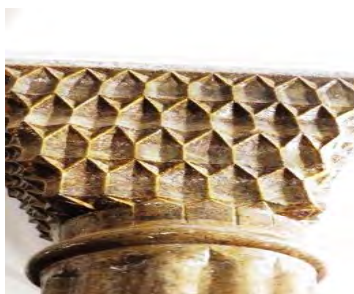
ب) سرستون شبستان