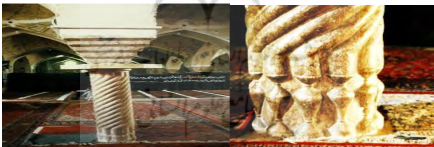
تصویر ۱. نمونه‌ای از ستون‌های مسجد حاج شهبازخان در کرمانشاه

نمونه ۲. مسجد دولت‌شاه. این مسجد ستون‌های سنگی بسیار زیبا و متنوع در قسمت شبستان و محراب دارد. سرستون‌های سنگی آن دارای شکل و فرم متفاوتی است. تنوع شکلی این سرستون‌ها زیبایی مسجد را دوچندان کرده