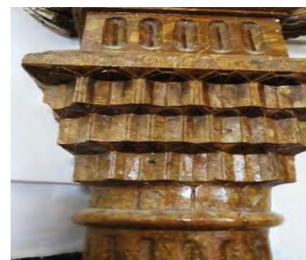
الف) سرستون محراب