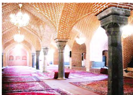
ب) مسجد جامع کرمانشاه

ستون‌های سنگی و دیوارهای کناری، ۲۵ پوشش گنبدی از نوع چهار بخشی را حمل می‌کند. پایه و سرستون دارای تزیین و بدنه ستون شش ضلعی شکل حجاری شده است. نقوش هندسی، بیشترین نقش را در تزیین ستون‌های مسجد جامع دارد. بنابراین، ستون‌ها کاربرد سازه‌ای-تزیینی در مسجد دارد (تصویر ۶ ب).