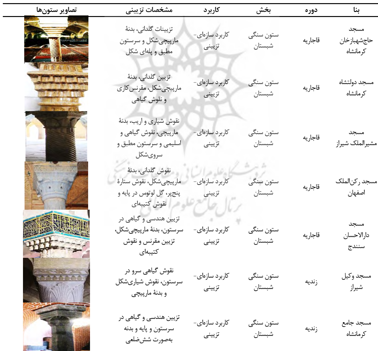
جدول ۱. مقایسه نمونه‌های مورد مطالعه در پژوهش

بنابر نظر لوفت، اقامت فتحعلی‌شاه، به‌عنوان ولیعهد آغامحمدخان و والی فارس در شیراز، و آشنایی وی با آثار