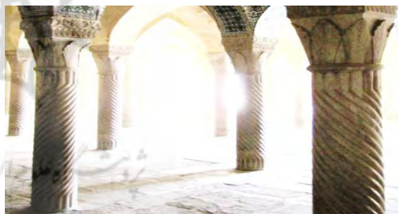
تصویر ۳. نمونه‌ای از ستون‌های سنگی مسجد مشیرالملک شیراز

حجاری‌های شبستان غربی مسجد مربوط به ستون‌های این شبستان است. این ستون‌ها ارتفاعی حدود سه متر دارد و تمامی قسمت‌های آن دارای تزیینات حجاری است. تزیینات پایه ستون و شال ستون‌ها، نقوش شیاری‌شکل اریب و تزیینات سرستون‌ها شامل نقوش حجاری‌شده گیاهی و اسلیمی است که در سه ردیف مطبق ایجاد شده است؛ نقوش ردیف اول، اسلیمی و ختایی، و نقوش ردیف دوم و سوم، به شکل درخت سرو است. حجاری این ستون‌ها دقیقاً شبیه حجاری ستون‌های مسجد نصیرالملک است؛ با این تفاوت که قسمت پایه ستون‌های شبستان مسجد نصیرالملک دارای نقوش گلدانی مانند ستون‌های کرمانشاه است، در حالی که پایه ستون‌های شبستان مسجد مشیر نقوش شیاری‌شکل دارد (تصویر ۳).