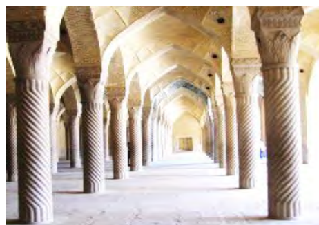
الف) مسجد وکیل شیراز

شیخ‌علی‌خان زنگنه حاکم کرمانشاه، بنا شده است. آنچه از بنای دوره زندیه باقی مانده، بخش‌هایی از هشتی ورودی، شبستان ستون‌دار و ایوان جنوبی است. حجاری ستون‌های مسجد جامع کرمانشاه، در قسمت شبستان و به صورت مربعی است که پوشش طاق و گنبد آن در وسط روی ۱۶ ستون در چهار ردیف ستون چهارتایی قرار گرفته است.