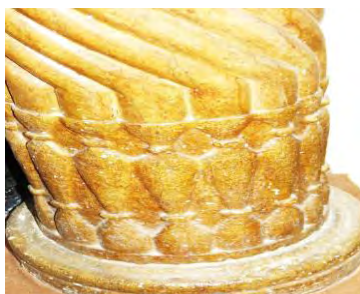
ج) پایه ستون‌ها