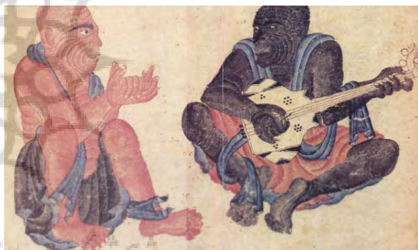
تصویر ۳- نوازندگان (شمن سرخ و سیاه)، ۱۵/۷ × ۲۶ سانتیمتر، آلبوم ۲۱۵۳، کاخ موزه توپقایی استانبول.

تصاویر دیگری از سیاه‌قلم که در آنها تاکید بر رقص، ضیافت و شادمانی وجود دارد، متعلق به چهره‌های انسانی و شمنی است. در تصویر ۳، دو مرد شمنی پابرنه مقابل یکدیگر نشسته که یکی در حال نواختن و دیگری در حال تشویق و دست‌زدن برای نوازنده است و به این ترتیب با او مشارکت می‌کند و یا در تصویر ۴، دو شمن با شور و هیجان مضاعفی که سیاه‌قلم به آنها بخشیده است، هم‌چون تصاویر پیکره‌های رقص دیونماها، با حرکات دورانی و چرخنده دست و پاها که با امواج شال، موزون گشته؛ توصیف شده‌اند. برای تاکید بر نهایت چرخش بدن، اعوجاج اندام‌ها درحالی نشان‌دهنده شده که یک پا بالاتر از پای دیگری قرار دارد و بازوها و آرنج و مچ دست به سمت عقب، پیچ‌خورده است. دلالت صریحی به انگاره جشن و سرور در تصویر ۵ وجود دارد. عقب پیکره‌هایی که نشسته و درحال تعامل و گفتگو هستند، دو مرد حضور دارند؛ مردی که می‌رقصد و مردی که نوشیدنی را پیشکش می‌کند. از این‌رو جسمانیت انسان و جهان پیرامون آن که در قلمرو ارتباط مستقیم با بدن قرار دارد، پی‌درپی محو و مجدداً احیا