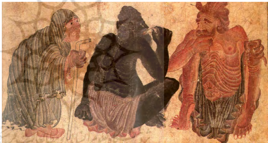
تصویر ۷ - صحنه مکالمه دو گدای سیاه و سفید به‌همراه پیرزن، ۱۹/۳ × ۲۵/۵ سانتیمتر، آلبوم ۲۱۵۳، کاخ موزه تویقایی استانبول.