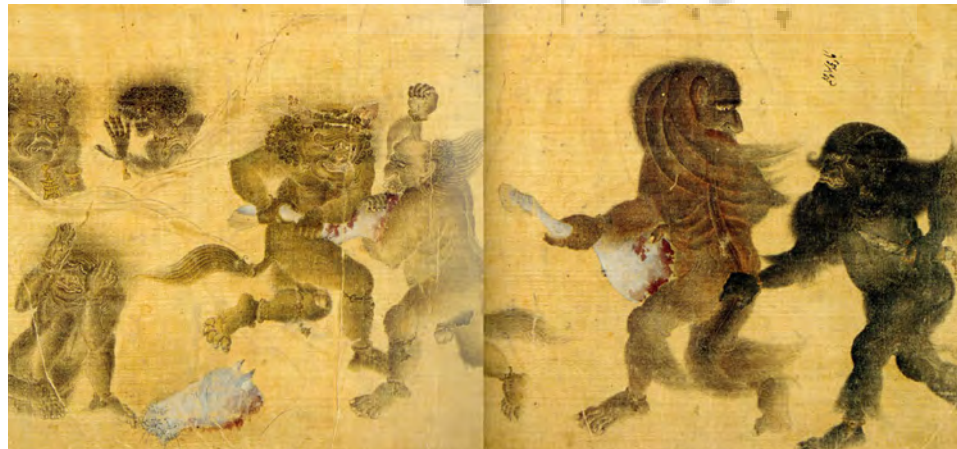
تصویر ۱۱- نزاع دیوها بر سر لاشه اسب، ۲۰×۴۹/۶ سانتیمتر، آلبوم ۲۱۵۳، کاخ موزه توپقایی استانبول.