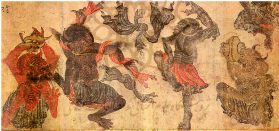
تصویر ۱- دیوان در حال رقص و پایکوبی، ۲۲/۲ × ۴۸/۵ سانتیمتر، آلبوم ۲۱۵۳، کاخ موزه توپقایی استانبول.

نقابی که «عنصر شادمانه و مسرور زندگی را در خود دارد و بر رابطه درونی واقعیت و تصور استوار است؛ که وجه مشخصه باستانی‌ترین آیین‌ها و نمایش‌هاست» (Bakhtin, 1984, 40). چنان‌چه باختین می‌گوید «در کارناوال، مردم با لباس عوض کردن و نقاب بر چهره زدن، به‌صورتی نمادین تغییر هویت می‌دهند. دیگر برای خود هویت فردی و مجزا قائل نیستند، از محدوده قالب فردی و همیشگی‌شان فراتر رفته و به بدن جمعی توده می‌پیوندند و حتی گاهی از آن نیز فراتر رفته و به اشیاء دیگر و جهان می‌پیوندند» (Bakhtin, 1984, 111). نکته حایز اهمیت، درحالت پیکره‌ها و شال‌های موج‌آنهاست، شال‌هایی که در هوا به اهتزاز درآمده است و با حرکات دیوانه‌وار دست‌ها و پاهای رقص‌ها مقابله می‌کند. به نوعی می‌توان گفت عناصری از طنز، بازی، سرگرمی و نشاط در آن وجود دارد و به تعبیر باختین، مراسم کارناوالی «با بازارها و