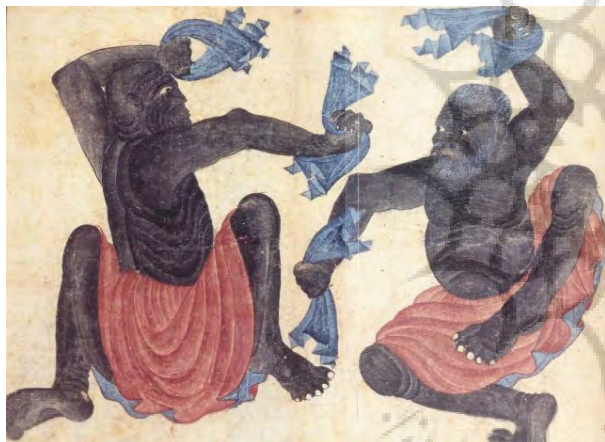
تصویر ۴- رقص شمن‌ها، ۱۸/۵ × ۲۴/۸ سانتیمتر، آلبوم ۲۱۵۳، کاخ موزه توپقایی استانبول.