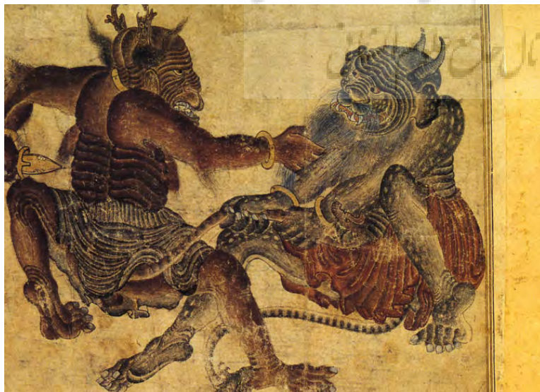
تصویر ۹ - نزاع دو دیو، ۱۹/۳ × ۲۳/۷ سانتیمتر، آلبوم ۲۱۵۳، کاخ موزه تویقایی استانبول.