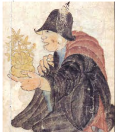
تصویر ۸ - بخشی از مذاکره سه مرد، ۱۷/۵ × ۲۴/۹ سانتیمتر، آلبوم ۲۱۶۰، کاخ موزه تویقایی استانبول.