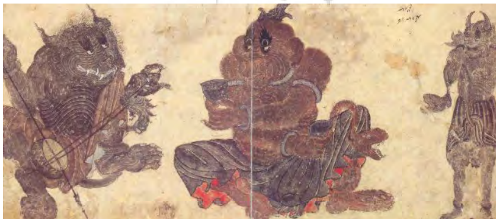
تصویر ۲- دیوهای نوازنده، ۲۷/۹ × ۴۲ سانتیمتر، آلبوم؟، کاخ موزه توپقایی استانبول.