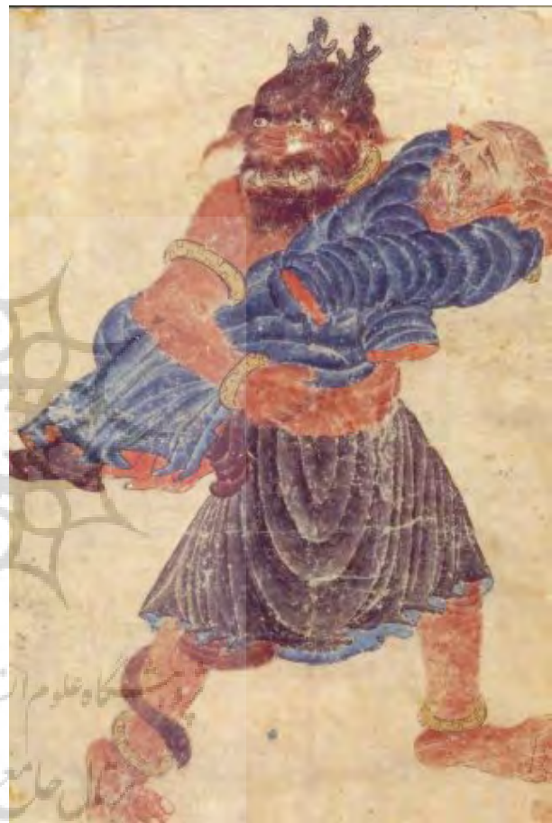
تصویر ۱۲- دزدیدن جسد توسط دیو، ۱۹/۶ × ۱۵/۳ سانتیمتر، کاخ موزه توپقاپی استانبول.

و شکم‌بارگی شده‌اند. مبالغه و اغراق در تم خوردن و پرخوری، در تمامی صحنه‌های رابله وجود دارد اما در بخش مربوط به غول دماغ بریده، این مبالغه وارد زنجیره بدن انسان می‌شود طوری که «غول دماغ بریده وحشتناک، همه قابل‌مه‌ها، دیگ‌ها، کتری‌ها، تابه‌ها و حتی اجاق‌های خوراک‌پزی و تنوره‌های جزیره را به سبب نبود خوراک معمولش یعنی آسیاب‌های بادی بلعیده بود...» (باختین، ۱۳۸۷، ۲۷۱) و این می‌تواند شبیه به سرمستی و شکم‌پرستی پیکره‌های دیونمای سیاه‌قلم باشد که اسبی را قربانی کرده و بر سر تکه‌های قطعه‌قطعه شده بدن آن در پیکار و نبرد