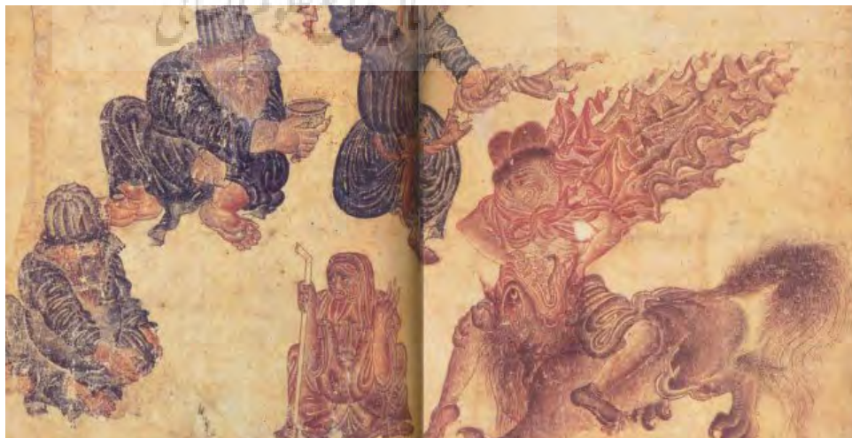
تصویر ۵- سه درویش به‌همراه پیرزن و فرد سوار بر اسب، ۱۵/۸ × ۲۸/۵ سانتیمتر، آلبوم ۲۱۵۳، کاخ موزه توپقایی استانبول.