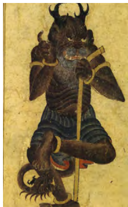
تصویر ۶- دیو ایستاده، ۲۷/۳ × ۱۵/۶ سانتیمتر، آلبوم ۲۱۵۳، کاخ موزه توپقایی استانبول.