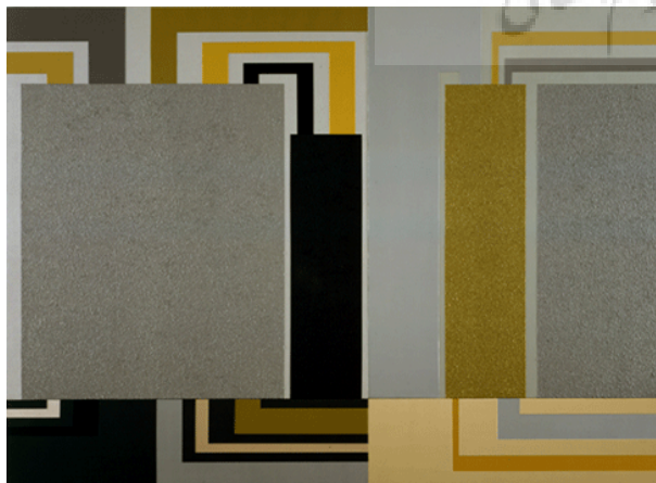
تصویر ۲ - الگو، پیتراهالی، ۱۹۹۸، اکریلیک، دی - گلو، اکریلیک متالیکی و رول - ای - تکس روی بوم. ماخذ: ( http://www.peterhalley.com )

آثار هالی به شکلی تمثیلی نظام سراسر بینی را وانمایی می‌کند. می‌توان بکارگیری مواد نامتعارف همچون رول‌ای-تکس که در دکوراسیون داخلی کاربرد دارد و نیز استفاده از دی گلو، رنگ‌های شبرنگی که دارای تلالو و درخشندگی بسیاری است، در آثاری چون زندان (۱۹۸۹)، سلول (۲۰۰۳)، سلول قرمز (۲۰۰۳) و نیز پالس