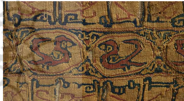
تصویر ۲- طراز گلدوزی شده فاطمیان اوایل قرن ۱۲/۶، شامل تصاویر کوچک پرندگان بین دو حاشیه تزئینی خط کوفی یا شبه کوفی.

در شیوه دیگر، نوشته‌های روی پارچه، با بافت تاپستری ۱۲ ایجاد می‌شد. در این حالت، نوشته به‌صورت نواری جداگانه بافته می‌شد و سپس بر روی پارچه اصلی متصل می‌گشت. از ربع دوم قرن ۹/۳، روش بافت تاپستری در بافت نوارهای طراز استفاده شد (همان، ۶۴). بافندگان مصری در این شیوه از نخ ابریشمی استفاده می‌کردند که ظرافت زیادی داشت (تصویر ۳). طرازها با جملاتی مانند «بخت و اقبال خوب» و «موفقیت و کامیابی» تهیه