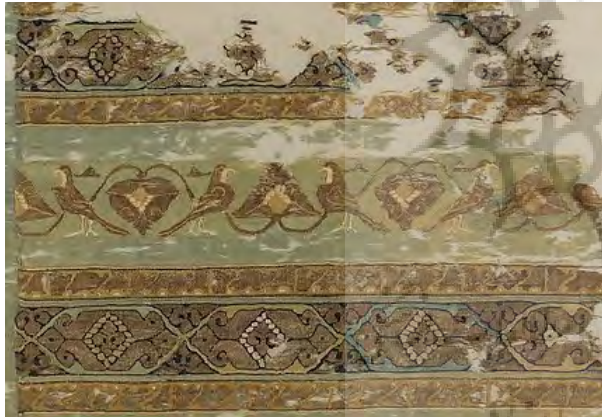
تصویر ۱۰- نمونه‌ای از پارچه طراز که پارچه بسیار گران‌قیمت و مورد استفاده خلفا و دولت‌مردان فاطمی بوده است.

کارکرد هنری: نفاست پارچه‌های طراز که از ابریشم و دیبای زربفت تهیه می‌شد، همراه با نوشته‌های معنادار آن، زیبایی خاصی به آنها می‌بخشید. خط‌نوشته‌ها با استفاده از خط کوفی بر روی زمینه پارچه نقش می‌شد که برای زیباتر کردن آنها از خط کوفی برگردار و گلدار استفاده می‌شد که به تدریج به خطوط تزیینی مبدل گردید. کاربرد نقش‌مایه‌های تجریدی حیوانات و گیاهان در ترنج‌های رنگارنگ، زیبایی یافته‌ها را دو چندان می‌نمود. استفاده از سوزن‌دوزی با نخ‌های ابریشمی رنگارنگ یا زرین و سیمین جلوه زیبایی به این پارچه‌ها می‌بخشید. بافت نوارهای طراز با روش تاپستری شیوه‌ای آشنا برای هنرمندان بود که با نخ‌های ظریف ابریشمی انجام می‌شد. هنرمندان از شیوه‌های چاپ و بافت پارچه هم برای ایجاد نوشته‌ها استفاده می‌کردند و با برجسته کردن حروف و کاربرد رنگ‌های متنوع، عبارات را نمایان‌تر می‌ساختند تا از این طریق اطلاع‌رسانی و تبلیغ نمایند (تصویر ۱۰).