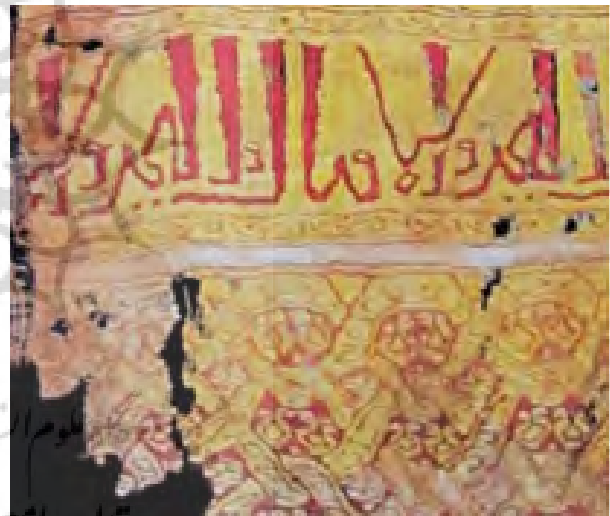
تصویر ۸- طرازی که در دوره الظاهر از کتان تهیه شده و دارای کتیبه‌ای است که بر تبار و خاندان خلیفه تأکید دارد.

کارکرد تجاری - بازرگانی: در دوره فاطمی، منسوجات نفیس ارزش زیادی داشتند و حتی به عنوان خراج مطرح می‌شدند. از بعد اقتصادی می‌توان جایگاه طراز را در بازارهای داخلی و خارجی مورد بررسی قرار داد. طرازهای عامه برای استفاده مردم تهیه می‌شد و دولت با فروش آنها می‌توانست درآمد قابل توجهی کسب نماید. این پارچه‌های ارزشمند خواهان زیادی داشت و قطعاً افراد ثروتمند می‌توانستند آنها را تهیه کنند. وجود این بازار مصرف، بافندگان و هنرمندان را تشویق می‌کرد که انواع متنوعی طراز با کیفیت بالا تهیه کنند که به نوبه خود باعث ارتقای صنعت نساجی در آن زمان و رونق این منسوجات، منجر به توسعه اقتصادی