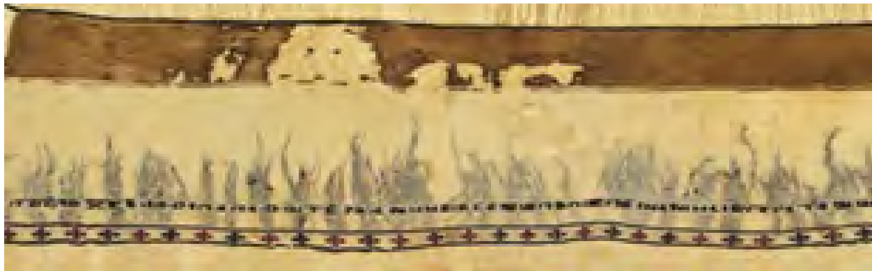
تصویر ۹- قطعه‌ای از شال، قرن ۱۰/۴ مصر، پارچه پشمی با گلدوزی‌هایی با پشم آبی و گل‌های قهوه‌ای، کتیبه با خط شبه‌کوفی.