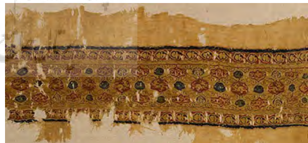
تصویر ۳- طراز کتان با تاپستری ابریشم، مصر قرن ۱۲/۶.