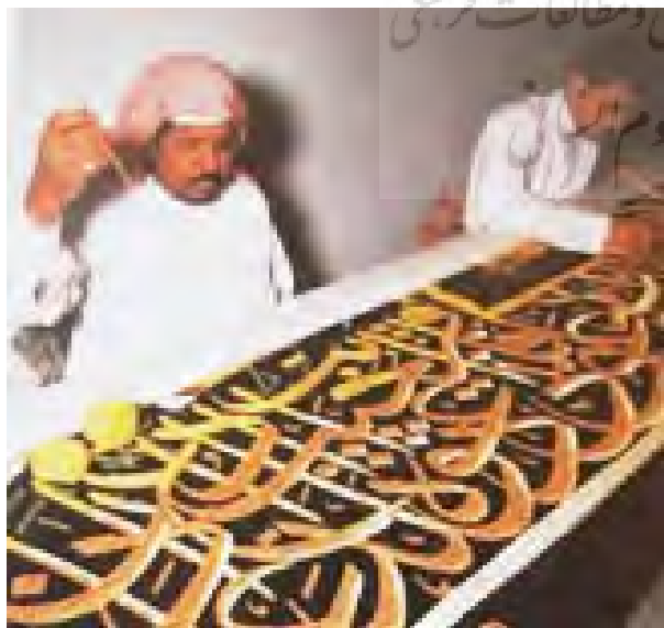
تصویر ۱- سوزن‌دوزی آیات قرآنی با رشته‌های طلا و نقره روی زمینه سیاه بر روی کسوه کعبه.

طراز در ابتدا به‌صورت بسیار ابتدایی بر روی پارچه‌های ساده با روش چاپ ایجاد می‌شد. هنرمندان و صنعتگران نوشته‌هایی را که می‌خواستند بر روی طراز نقش گردد، با استفاده از چاپ