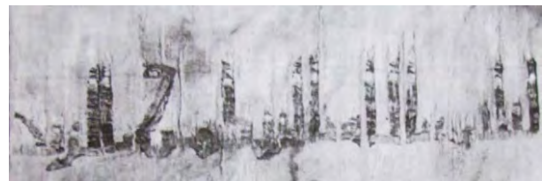
تصویر ۴- کفن تدفین از کتان رنگ نشده متعلق به ربع آخر قرن ۱۰/۴. مأخذ: (بیکر، ۱۳۸۵، ۶۰)