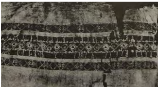
تصویر ۷- طرازی از کتان و ابریشم به نام خلیفه المستنصر و وزیرش بدرالجمالی اواخر قرن ۱۱/۵. مأخذ: (محمدحسن، ۱۳۸۲، ۱۳۱)