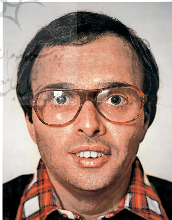
تصویر ۲- مارک، چاک کلوز، ۱۹۷۹.

هیچ چیز از یک عکس پرتره کم ندارد با این حال همین که به نقاشی بودن آن پی‌می‌بریم، به قول هوسرل "انفجاری ادراکی" در ما به وقوع می‌پیوندد و واقع‌گرایی و ارزش استنادی آن به یک‌باره در برابر چشمان ما رنگ می‌بازد (Pettersson, 2011, 186). پس باید گفت آنچه عکاسی را از دیگر اشکال تصویرهای دست‌ساز متمایز می‌کند، نه میزان دقت عکاسی در ثبت جزئیات، بلکه نوع فرایندی است که به شکل‌گیری تصویر عکاسانه می‌انجامد. بگذارید با یک مثال این قضیه را روشن کنیم. فرض کنید که یک عکاس و یک نقاش قصد دارند از یک منظره در جنگل تصویرسازی کنند اما پیش از شروع به کار در اثر مصرف دارویی خاص دچار این توهم می‌شوند که در منظره‌ی روبروی‌شان یک تک‌شاخ وجود دارد. در این صورت در مورد نقاشی از آنجا که نقاش از توهمات ذهنی خود گریزی ندارد، نقاش یک تک‌شاخ را به تصویر خواهد کشید اما عکاس نه، زیرا دوربین از آنجا که با توهم (ذهنیت) عکاس کاری ندارد و به شکلی عینی عمل می‌کند، آنچه واقعاً وجود دارد را تصویر می‌کند. به عبارت دیگر، مسیری که برای بازنمایی یک صحنه در قالب مجموعه‌ای از خطوط و رنگ‌مایه‌ها طی می‌شود، در خصوص تصویر دست‌ساز و عکاسی متفاوت است. در مورد تصویر دست‌ساز حالات ذهنی تصویرساز از جمله باورهای ادراکی او در خصوص صحنه‌ی پیش رویش در ساخت تصویر دخالت دارد، حال آنکه مسیری که پیدایش تصویر عکاسانه طی می‌کند، از ذهنیات عکاس مصون است (Walden, 2008, 104 & 105).