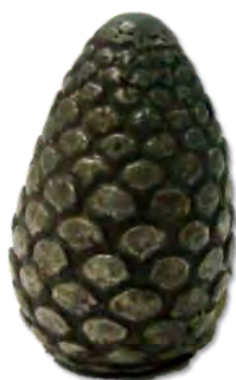
تصویر ۱۵- آب‌پاش نقره به شکل میوه کاج.

ظرف نقره به شکل پیکره خروس با تاج طلا به ارتفاع ۲۳/۵، طول ۲۷/۲ و عرض ۹ سانتی‌متر به حالت ایستاده که با تکنیک ریخته‌گری ساخته شده است (تصویر ۱۳). ریشه واژه خروس از مصدر خرئوس در اوستا به معنای خروشدن است که این نام به دلیل بانگ زدن خروس است. در دین مزدیسنا خروس از مرغان مقدس بوده و به فرشته بهمن اختصاص دارد. این پرنده به کمک سگ، در برانداختن دشمنان از همکاران سروش به شمار می‌رود. وظیفه پیک سروش نیز به عهده اوست و از طرف او در سپیده دم مژده سپری شدن تاریکی شب و برآمدن فروغ روز را به همراه دارد (دادور و مبینی، ۱۳۸۸، ۶۴). خروس در مصر باستان ناشناخته بود و پس از فتح آن سرزمین به دست ایرانیان، از آسیا به آنجا برده شد (هوار، ۱۳۷۹، ۸). تصویر مکرر خروس در اطراف گردن بت‌های مفرغی لرستان دیده می‌شود. خروس در شمایل‌پردازی بین‌النهرین