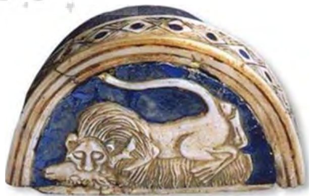
تصویر ۵- قدیم‌ترین نقش نبرد شیر و گاوروی یک جعبه‌لوازم آرایش از دوران سوم اور.

نبرد شیر و گاو به عنوان یک نمایش آسمانی از یک کشمکش نیروهای آسمانی بین صور فلکی برج ثور (گاو) و برج اسد (شیر)، پنجمین صورت فلکی منطقه البروج است. این نشانه فلکی شروع فعالیت کشاورزی در پایان فصل سرماست. شیر پیروزمند با قرار گرفتن در اوج و سمت الرأس، حداکثر قدرت خود را به نمایش می‌گذارد و به گاو که می‌کوشد از زیر افق بگریزد، حمله کرده و آن را می‌کشد و طی روزهای بعد در پرتو خورشید تا یک دوره ۴۰ روزه پنهان مانده، آن‌گاه دوباره زاده می‌شود و برای نخستین بار در اول فروردین طلوع می‌کند، تا اعتدال بهاری را اعلام کند. نبرد شیر و گاو در نیمه اول هزاره اول ق.م مناسب‌ترین و طبیعی‌ترین نماد برای دلالت بر اعتدال بهاری بوده است