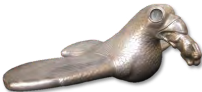
تصویر ۳- ظرف نقره به شکل پیکره عقاب و خرگوش، موزه فلک الافلاک.