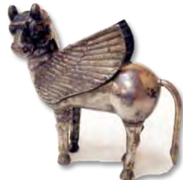
تصویر ۱۰- ظرف نقره به شکل پیکره گاو بالدار.