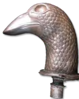
تصویر ۱۸- سر عصاره نقره‌ای به شکل مرغابی، موزه فلک الافلاک

که خود منبع الهی حیات است. نیلوفر به وسیله نفرتوم ۴ خدای مربوط به رع که در ممفیس مورد پرستش بود، تجسم یافت. در قرن هشتم ق.م نقش نیلوفر به فینیقیه و از آنجا به آشور و ایران انتقال یافت و در این سرزمین‌ها گاهی جانشین درخت مقدس می‌شود (هال، ۱۳۸۰، ۳۰۹ و ۳۱۰). گل لوتوس یا ترنج هندسی