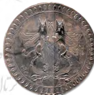
تصویر ۲۰- پلاک نقره با نقش گاومرد.