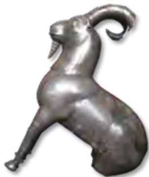
تصویر ۱۲- ظرف نقره به شکل پیکره بزکوهی، موزه فلک الافلاک.

ظرف مجوف نقره به شکل پیکره یک گاو کوهاندار ایستاده به ارتفاع ۱۵/۹ و عرض ۲۴/۱ سانتی‌متر که یک ورقه طلائی جلوی سر آن را تزیین کرده است (تصویر ۹). همچنین یک ستاره چند پر روی پشت گاو قرار دارد. یک حفره درب‌دار روی پشت گاو تعبیه شده که محل ریختن مایعات به درون ظرف، در مراسم آیینی بوده است. این ظرف با تکنیک ریخته‌گری به صورت دو قسمت جداگانه ساخته شده و به هم متصل شدند. گاو در هنر ایرانی پاینده و نگهدارنده بوده و از طرفی به ماه، حاصلخیزی و باروری هم مربوط می‌شده است. در تمدن‌های بین‌النهرین، هند و ایران نقش گاو را به گونه‌های متنوع گاو بالدار، گاو مرد و ... به کار بردند. ارزش‌های طبیعی و کاربردی این حیوان به خوبی شناخته شده بود و به همین دلیل آن چنان قدر و منزلتی می‌یابد که با اعتقادات و فرهنگ آنان در می‌آمیزد. احترام به گاو از معتقدات مذهبی اقوام آریایی بود که به وسیله اقوام مهاجر به آسیای صغیر و سپس به مصر منتقل شده است (رواسانی، ۱۳۷۰، ۲۳۸). پیکره گاو در