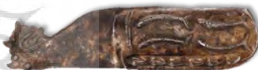
تصویر ۱۹- غلاف خنجر نقره، موزه ملی ایران.