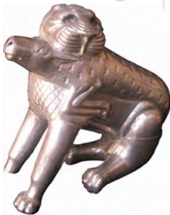
تصویر ۶- ظرف نقره به شکل پیکره شیر و غزال، موزه فلک الافلاک.

ظرف مجوف نقره به شکل پیکره شیر و غزال به طول ۱۸ و ارتفاع ۱۶ سانتی‌متر که شیر غزال شکار شده را به دهان گرفته و بر پشت خود حمل می‌کند (تصویر ۶). سر شیر کمی به طرف عقب برگشته و گردن شکار را در اختیار دارد. بخش‌های مختلف این نوع ظروف عموماً به طور جداگانه با تکنیک ریخته‌گری ساخته شده و به یکدیگر متصل شدند. نقش یال و دیگر اعضای حیوان به روش قلم‌زنی با خطوط مختلف هاشوری، نقطه‌ای و ... نشان داده شدند. نمونه مشابه این نقش روی یک ظرف لوله‌دار از مارلیک که شیری را در حالی که شکار خود را به دندان گرفته، می‌توان مشاهده کرد (Negahban, 1964, 16). یک سوراخ مدور روی سر شیر برای ریختن مایعات تعبیه شده و بینی غزال دارای دو سوراخ برای خروج مایع است. چشمان شیر مرصع بوده که سنگ آن افتاده است. لرستان و ایلام یکی از مراکز اصلی تزیینات جانورسان روی اشیاء فلزی بودند. این یکی از ویژگی‌های سبک فلزکاری غرب ایران است که در جاهای دیگر به ندرت دیده