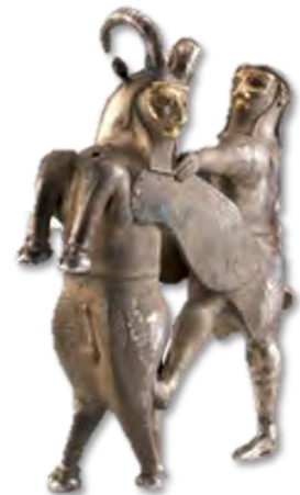
تصویر ۲- ظرف نقره به شکل بیکره یک قهرمان در حال مبارزه با گاومرد.

مرد قهرمان دارای یک ریش بلند چهارگوش از نوع آشوری و موهای بلند در پشت سر است. یک لباس مزین با آستین و دامن کوتاه شرابه‌دار به تن دارد. حاشیه دامن و لباس قهرمان دارای تزئینات مربعی از نوع آشوری است. دامن آن به صورت دو تکه بوده که لبه‌های آن روی هم قرار گرفته و با یک کمر بند تزئینی پهنی نگه داشته شده است. گاو بالدار (گاومرد) دارای