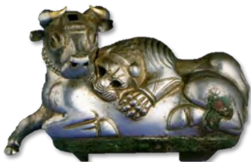
تصویر ۴- ظرف نقره به شکل پیکره نبرد شیر و گاو.

ظرف نقره به شکل پیکره عقاب با بال‌های گشوده (تصویر ۳)، در حالی که خرگوشی در دهان دارد، به ابعاد فاصله دو بال ۳۰/۵ و فاصله نوک تا انتهای دم ۲۲ سانتی‌متر که با تکنیک ریخته‌گری به صورت چند بخش جداگانه ساخته و به هم الصاق شدند و تزیینات روی آن به روش قلم‌زنی ایجاد شده است. در بالای سر عقاب، سوراخ مربع شکلی برای ریختن مایعات به درون ظرف تعبیه شده که از سوراخ‌های بینی خرگوش خارج می‌شده است. نام این پرنده در متون کهن سومری و هیتی آمده است. نمونه‌های سفالین و فلزی آن نیز به شکل ریتون در آشور یافت شده است (Canby, 2002, 165-168). پاهای عقاب شکسته و چشم‌هایش مرصع بوده که سنگ آن افتاده است. استفاده از سنگ‌های رنگارنگ ابتکاری است که به روزگار جلال و عظمت شهر اور سومری باز می‌گردد (بهزادی، ۱۳۸۳، ۱۲۰). برای تزیین بسیاری از اشیاء کلماکره، از سنگ لاجورد و عاج استفاده شده است. لاجورد یکی از سنگ‌های وارداتی است که ساکنان غرب ایران مورد استفاده قرار می‌دادند که باید از منطقه بدخشان در شمال افغانستان آمده باشد (Simpson, 2000, 6). در پیکرنگاری آسیای غربی تا قرن هشتم ق.م شکل پرنده ظاهر نشده است. در هنر لرستان نیز نقش پرنده در هزاره اول ق.م نمایان می‌شود (Reade, 1978, 151). نقش عقاب در تپه گیان در هزاره چهارم ق.م روی خمره‌های سفالین دیده می‌شود. نقش عقابی که طعمه‌اش را در چنگال دارد، طرحی کاملاً شناخته