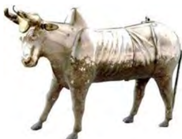
تصویر ۹ - ظرف نقره به شکل پیکره گاو.