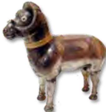
تصویر ۱۱- ظرف نقره به شکل پیکره قوچ.