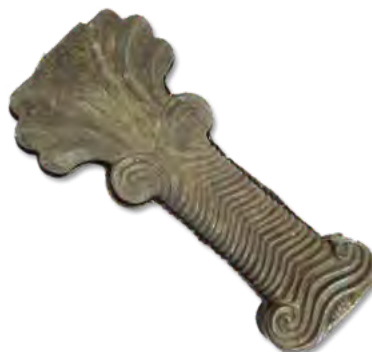
تصویر ۱۴- درخت نخل تزیینی از جنس نقره.