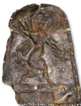
شکل ۲۱- پلاک نقره با نقش شیر، موزه ملی ایران.