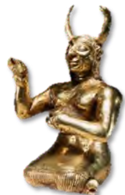
تصویر ۷ - مجسمه یک دیو ایزد از جنس طلا.

پیکرک طلائی یک دیو ایزد با هیكل انسانی و سم حیوانی که با تکنیک ریخته‌گری ساخته شده، دارای بینی بزرگ و بلند شبیه به لره‌های امروزی، گونه و سینه‌های برجسته و ابروان به هم پیوسته، دو شاخ در طرفین سر با موهای بلند موج و مجعد که در پشت سر به صورت حلقوی است (تصویر ۷). دیو یک پیراهن بلند تا قوزک پا بر تن دارد و حاشیه دامن آن شراپه‌دار است.