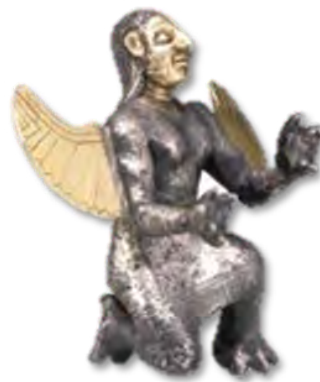
تصویر ۸ - مجسمه یک دیو ایزد از جنس نقره.

پیکرک نقره یک دیو بالدار با هیكل انسانی و دست و پاهایی به شکل پنجه عقاب به حالت نیم خیز، صورت و بال‌ها از جنس طلا، دارای بینی بزرگ، گونه‌های برجسته و ابروان به هم پیوسته، سینه‌های برجسته با موهای بلند بافته شده تا وسط کمر که یک پیراهن بلند تا قوزک پا به تن دارد. حاشیه دامن آن شراپه‌دار و کمر آن با یک کمر بند ساده بسته شده است (تصویر ۸). بالدار نمودن انسان از قرن ششم ق.م مرسوم بوده و در هنر ایران به منزله جریان هنری جدیدی به شمار می‌رفت (گیرشمن، ۱۳۴۶، ۷۳). وقتی