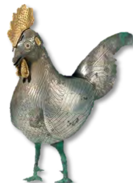
تصویر ۱۳- ظرف نقره به شکل پیکره خروس.