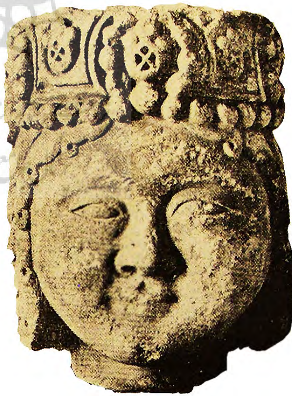
تصویر ۱۹- سردیس گچی شاهزاده سلجوقی، موزه متروپولیتن.