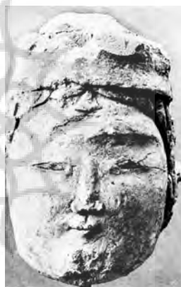
تصویر ۸- سردیس‌های گچی دو مرد، سمت چپ ارتفاع ۲۱.۵ cm، دارای kasier، موزه نیویورک، و سمت راست ارتفاع ۱۹ cm، موزه kelexian، نیویورک، برلین.