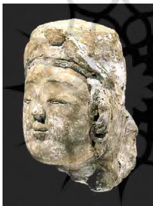
تصویر ۹- سردیس گچی یک شاهزاده، احتمالاً ری، قرن دوازدهم و اوایل سیزدهم میلادی، سایت موزه لور، بخش هنر اسلامی.