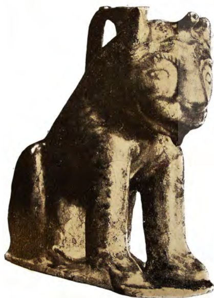
تصویر ۳- پیکره شیر سفالین با لعاب معدنی، قرن دوازدهم میلادی، موزه برلین. مأخذ: (زکی، ۱۹۵۶، ۴۵)

توسعه این هنر-صنعت و تبحر پیشه‌وران، عرصه را برای پیکرنگاری و مجسمه‌سازی گچی مهیا ساخته بود و لذا در این دوره تندیس‌ها و مجسمه‌های بسیار زیبایی در ریخت قالب‌گیری شده و پیکر تراشی پا به عرصه وجود نهاد. این مجسمه‌ها عمدتاً نمایان‌گر نبوغ، صنعت‌گری تکامل یافته و تا حدودی دهن کجی به اعتقادات و اندیشه مرسوم و عمدتاً فقهی منافی تندیس‌گری است. در این میان سلاطین و امرا بدشان نمی‌آمد با حمایت از این گونه هنرها، ضمن برجسته‌سازی و تمایز دربار و سرزمین‌های