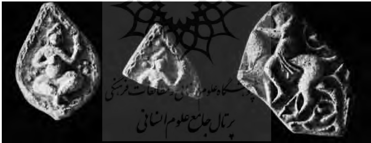
تصویر ۲۲- پیکره‌های قالب‌ریزی شده، موزه‌ی tchinili kiosk، استانبول.

- گچ کار ماده‌ای آسیب‌پذیر بوده و رطوبت به شدت بر روی