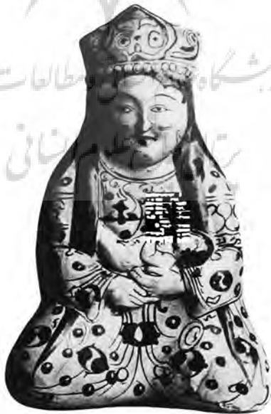
تصویر ۲- سفالینه لعابدار، پیکره مادر نشسته، در حال شیر دادن به بچه، قرن سیزدهم میلادی، از ری، موزه قیصر فردریک برلین. مأخذ: (Huyghe [non date], 140)