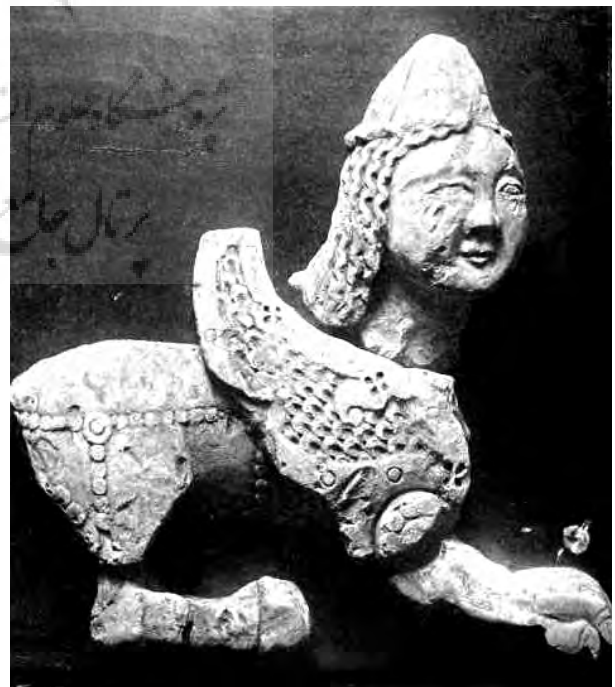
تصویر ۲۱- اسفنکس، ۵۲،۵ cm، دارای h. Kevorkian، نیویورک. مأخذ: (Riefsahl, 1931, fig 2)

عمده آثاری که دربردارنده پیکره انسانند، به این صورت ارائه می‌شوند که در آن پیکره انسان یا کاربردی تزیینی دارد و یا در جریان روایت داستانی مورد استفاده قرار گرفته است. در نمونه تصاویر (۱۳ و ۱۵) به نظر می‌رسد که داستانی اسطوره‌ای