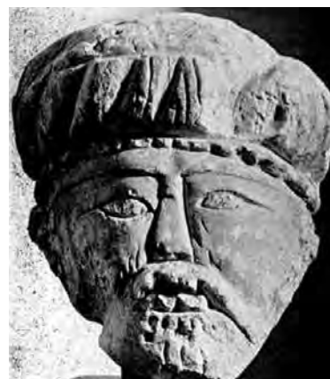
تصویر ۱۱- سردیس گچی سر سلطان، ارتفاع ۳۲ cm، دارای Stephen bourgeois، نیویورک.