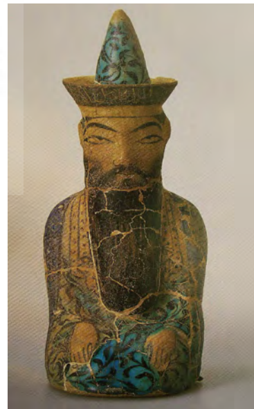
تصویر ۱- پیکره سلطان طغرل، سفالینه نقاشی شده با رنگ‌های سیاه، فیروزه‌ای و آبی کبالت‌زیر لعاب براق که رنگ و رو پریده شده است. قرن سیزدهم ارتفاع ۴۰/۵ cm از کلکسیون ناصر خلیلی، بخش هنرهای اسلامی.