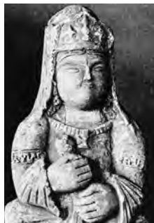
تصویر ۱۸- پیکره گچی زن نشسته، موزه Victoria and Albert، لندن. مأخذ: (Riefstahl, 1931, fig 9)