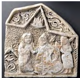
تصویر ۱۷- شاه و ملازمانش، طول ۳۵ cm، عرض ۳۵ cm.