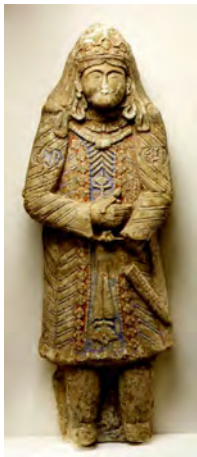
تصویر ۷ - مجسمه گچی ملازم درباری، ارتفاع ۱۴۵ cm، قرن ۱۲ میلادی و اوایل قرن ۱۳.

برخی شواهد از جمله تکنیک قالب‌گیری مشابه مورد استفاده در ساخت ظروف سفالین و مجسمه‌های گچی ساخته شده در این دوره، دلیلی بر رابطه‌ی مستقیم سفال‌گری و مجسمه‌سازی سلجوقی است. تصاویر (۱، ۲، ۳، ۴، ۵)، نمونه مجسمه‌های سفالینی از این دوران را نشان می‌دهد که در آنها تسلط بر قالب‌گیری و حجم‌پردازی هنرمندان را در اوج کمال عرضه می‌دارد و از حیث هم سویی با مجسمه‌سازی گچی، ارتباط بصری را به خوبی برقرار ساخته و لذا آگاهی هنرمندان بر آناتومی و اندام‌شناسی و همچنین بدعت در فرم‌ها و صور ناب را مشاهده می‌کنیم. زمینه‌ای که موجبات باروری مجسمه‌های گچی این دوران را فراهم می‌ساخت. در این نمونه، تا آنجایی که هنرمند دست خود را باز می‌دید به صراحت و زیبایی در جلوه‌های عینیت‌گرایی کوشیده است. هر چند تعداد مجسمه‌های گچی به دست آمده از دوره‌ی سلجوقی کم می‌باشد و اندک آثار موجود، آسیب‌های فراوانی دیده‌اند، اما بعد رئالیستی قوی؛ اندازه‌های بزرگ و به تبع آن جزئیات فراوان این آثار، اطلاعات بسیار جامع و دقیقی در قیاس با دیگر آثار هنری این دوره - از جمله سفالینه - در اختیار ما قرار می‌دهند. معلوماتی در زمینه‌ی زیبایی‌شناسی