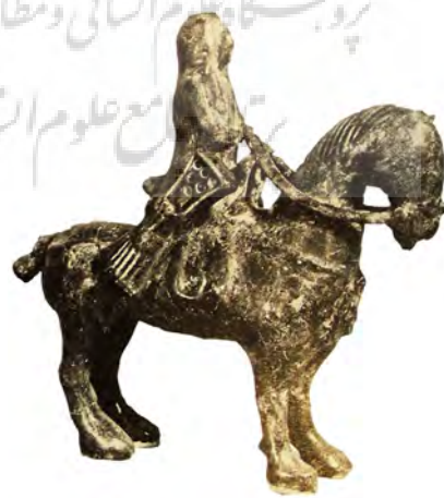
تصویر ۵ - پیکره مرد پارسی، سفالینه لعابدار با نقوش سیاه، قرن دوازدهم میلادی، ایران، موزه کلیه الآداب بالجامعه القاہرہ. مأخذ: (زکی، ۱۹۵۶)