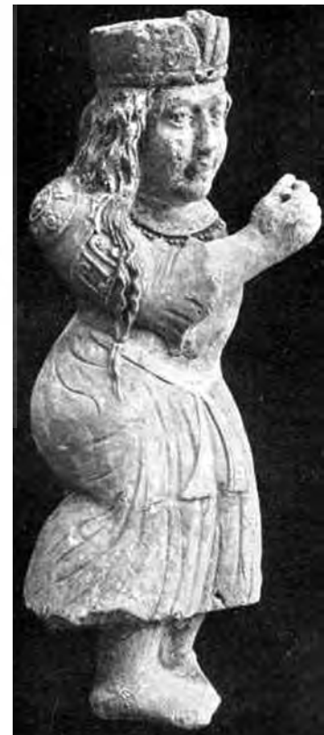
تصویر ۱۴- پیکره گچی ملازم جوان، قرن دوازدهم میلادی، موزه قیصر فردریش برلین.