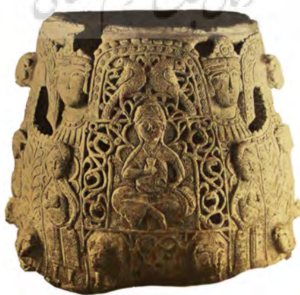
تصویر ۱۲- جزئی از ظرف سفالین با آرایه‌های برجسته، قرن ۱۲ و اوایل ۱۳ میلادی، موزه قصر عباسی بغداد. مأخذ: (زکی، ۱۹۵۶، ۲۰)