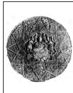
تصویر ۱۶- نقش برجسته گچی شاه نشسته بر سریر، اواسط قرن پنجم هجری ق. مأخذ: (Arnold [non date], 160)