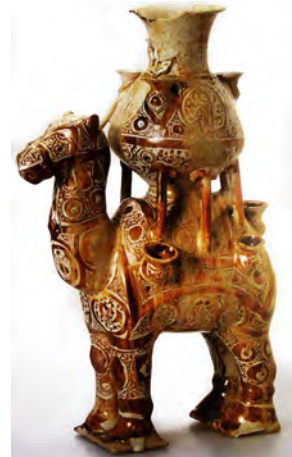
تصویر ۴ - ظرف سرامیکی به شکل شتر، نقاشی شده با رنگ‌های متمایل به صورتی و زیتونی شفاف، لعابدار (لعاب سفید کدر)، متعلق به اوایل قرن سیزدهم.