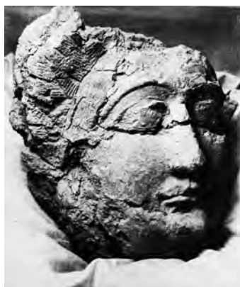
تصویر ۱۰- سردیس گچی، دوران سلجوقی. مأخذ: (Arnold [non date], 161)

از مجموع مجسمه‌های گچی مربوط به این دوران، تعداد نمونه‌های به دست آمده از سردیس پادشاهان و ملازمان در قیاس با دیگر نمونه‌ها بیشتر است. به نظر می‌رسد همگی این سردیس‌ها جزء مجموعه‌های بزرگ‌تر بوده‌اند. این فرض در مورد سردیس‌های تصویر ۸، صادق‌تر است. اکثر چهره‌های به دست‌آمده از این دوره، حالت روانی خاصی را القا نمی‌کنند و خشک و بی‌روح به نظر می‌رسند ولی در نمونه‌های (۹ و ۱۰)، هنرمند با تسلط بر آناتومی چهره و ایجاد تغییراتی در آن، روح تازه‌ای به مجسمه بخشیده که در آثار پیش از آن دیده نمی‌شود. این ویژگی‌ها در مورد تصویر ۱۱، نیز صادق است. این سه نمونه (۹، ۱۰، ۱۱)، از نمونه‌های استثنایی مجسمه‌های