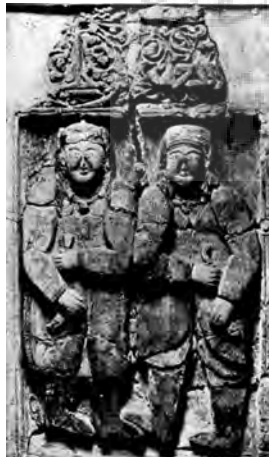
تصویر ۶ - مجسمه گچی ملازمان درباری، ارتفاع ۷۵.۵ cm، ارتفاع پیکره ۵۳.۵ cm، پهنای اثر (آنچه نشان داده شده) ۴۳ cm، متعلق به h. Kevorkian، نیویورک. مأخذ: (Riefstahl, 1931, fig12)