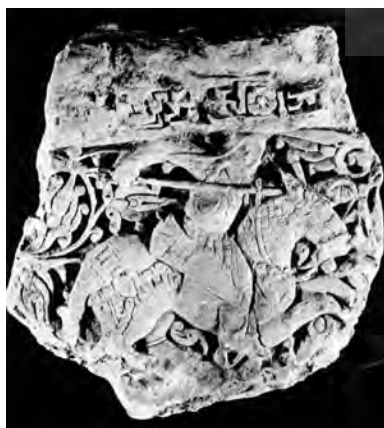
تصویر ۱۳- سوار کار نیزه به دست، ارتفاع ۳۰ cm، انستیتو هنر شیکاگو. مأخذ: (Riefstahl, 1931, fig 25)