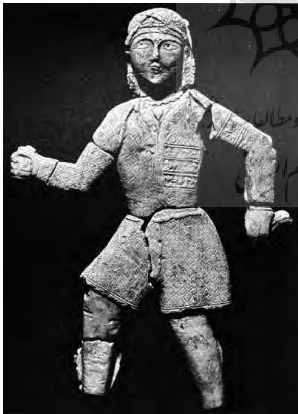
تصویر ۲۰- پیکره گچی یک جوان، دارایی h. kevorkian، نیویورک.

گروه اول؛ مجسمه‌های ساخته شده با رویکرد مستندسازانه هستند که هدف از ساخت آنها، نشان دادن فرد، حادثه و یا رویداد خاصی بوده است (بازنمایی شاه، درباریان، ملازمان و نگهبانان و مستندسازی حوادثی همچون جنگ، جشن و موارد مشابه). گروه دوم، مجسمه‌هایی هستند با بازنمایی غیرمستندسازانه که در ساختشان بیشتر جنبه تزیینی مدنظر بوده است و در راستای نیل به این هدف، از منابع متفاوتی همچون نقوش انتزاعی، گیاهی، حیوانی، ترکیبی و یا روایی و داستانی استفاده