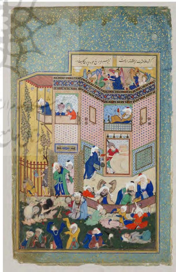
تصویر ۳- مستی لاهوتی و ناسوتی، دیوان حافظ، سلطان محمد، حدود ۹۳۲ ه. مآخذ: ( http://www.harvardartmuseums.org/art/303418 )