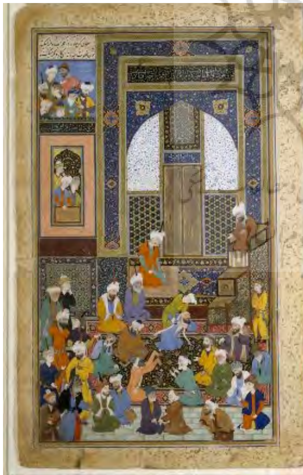
تصویر ۴: افشاگری در مسجد، دیوان حافظ، شیخ‌زاده، حدود ۹۳۲ ه.

یکی از نتایج آشکار مطالعه بر این چهار نگاره، وجود ارتباط میان ساختار نگاره‌ها و امکانات معنایی آنها است؛ به‌طور مثال