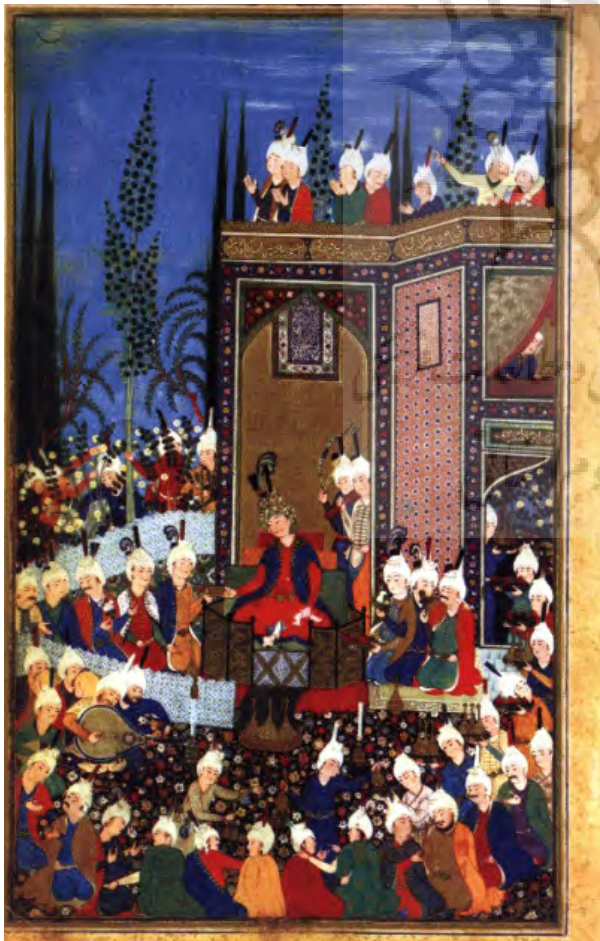
تصویر ۲- جشن عید، دیوان حافظ، سلطان محمد، حدود ۹۳۲ه. ماخذ: (کری‌ولش، ۱۳۸۴، ۶۱)

ریکور در زمینه تفسیر و فهم معنای متن، جانب متن و مخاطب را فرونگذاشته و شناخت جهان پیشاپیکربندی را لحاظ نکرده است. طبق روش او، مواجهه با ساختار و نشانه‌های تصویری و زبان‌شناسیک نگاره‌ها، اولین قدم در تفسیر و فهم معنای آنها است. بنابر نظر ریکور، مخاطب یا مفسر هنگام مواجهه با متن صاحب ذهنیت و جهانی از پیش‌داشت‌ها، مفروضات و اطلاعاتی است، که بر فهم اولیه او از متن مؤثرند؛ فرد می‌تواند در خلال درگیری با ساختار و نشانه‌ها و بررسی معانی ناشی از همجواری نشانه‌ها و تعامل آنها با یکدیگر، یعنی در طول عمل تبیین، آن فهم اولیه را به فهمی نسبتاً معتبر از اثر تبدیل کند و این نتیجه مرحله دوم یعنی فهم است که از رهگذر تأمل بر ساختار و نشانه‌ها رخ خواهد داد؛ البته نام‌گذاری و تفکیک این مراحل تنها برای فهم بهتر مسیری است که ریکور معتقد است به هنگام مواجهه با متن طی می‌شود. گفتگوی درونی مخاطب با خود و حضور قوی زبان در فرایند فهم، وی را با وجود خود روبرو می‌سازد. او در طی این مسیر به درکی متفاوت از خویش نیز نائل می‌آید، گویا پرده‌ای بر مهم‌ترین وجه وجودی‌اش یعنی فهم - به زعم هیدگر - به روی او کنار زده می‌شود و این همان