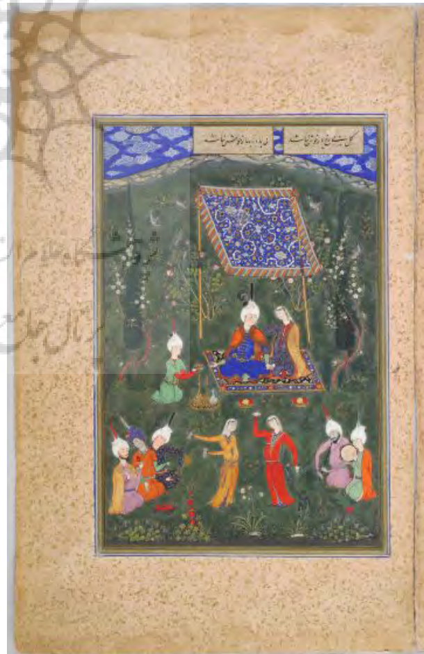
تصویر ۱- بزم عاشقان، دیوان حافظ، سلطان محمد، حدود ۹۳۲ه.