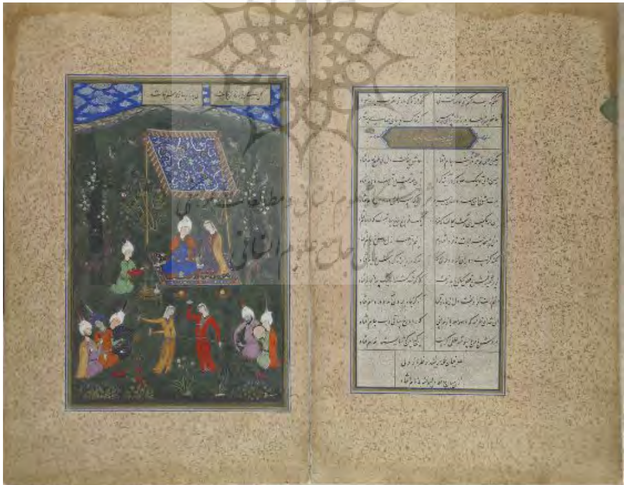
تصویر ۵- دو برگ از دیوان حافظ، حدود ۹۳۲ه؛ برگ سمت راست حاوی یک غزل از حافظ و برگ سمت چپ حاوی نگاره بزم عاشقان اثر سلطان محمد.

بررسی تصاویر دیوان حاکی از آن است که آنها حاوی اولین بیت یا یکی از ابیات میانی یک غزل‌اند. این تصاویر از لحاظ موقعیت‌شان در دیوان، یا در ابتدای غزل به همراه بیت اول آن یا