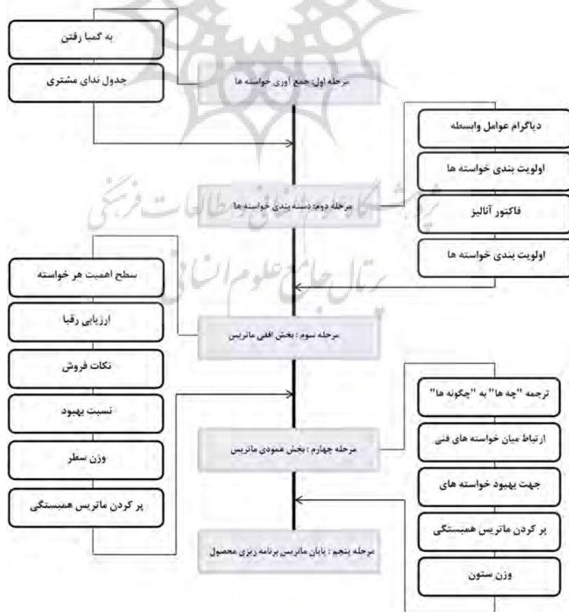
نمودار ۲- قدم به قدم تکمیل ماتریس خانه کیفیت در پنج مرحله.