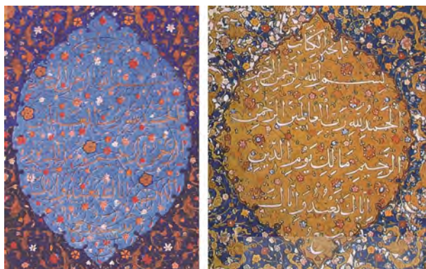
تصویر ۱- ترنج مرکزی مربوط به قرآن‌های ۲۰۴ و ۲۰۵

قرانت آیات آغازین قرآن، چشم خواننده را به متن هدایت می‌کند. قرآن‌های شیراز در صفحات افتتاح فاقد پیشانی‌اند و این کتیبه تنها پیش از شروع سوره بقره در صفحه تعبیه شده است. پیشانی قرآن‌های شیراز، مستطیلی کم عرض با ریتم منظمی از سطوح مثبت و منفی است که نقوش گل‌ها و سرترنج‌های کوچک زرین و رنگین به نسبت متوازی در بوم آن پراکنده شده‌اند. شرفه‌آهایی یک در میان متنوع نیز از جانب بالای پیشانی به فضای سفید راه یافته‌اند (تصویر ۴).