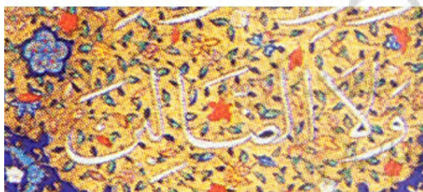
تصویر ۲- تزینات بین سطور مربوط به قرآن‌های ۳، ۴، و ۵