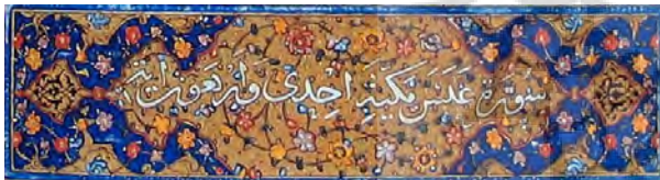
تصویر ۵- سرسوره قرآن‌های ۲، ۴.