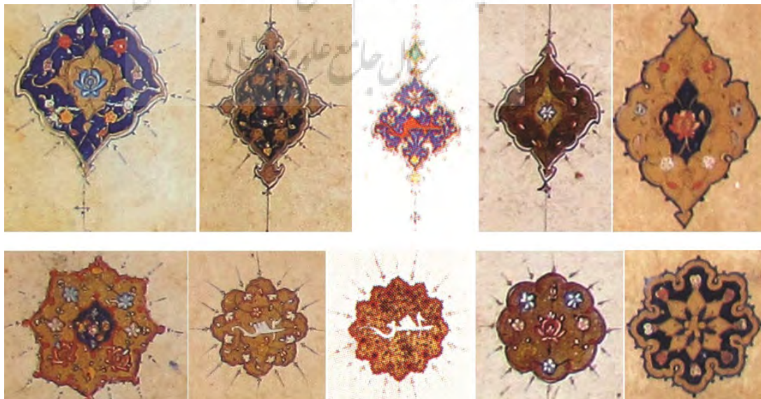
تصویر ۸- علائم تخمیس و تعشیر در حاشیه قرآن‌های ۵۱۰۲۰۴.

در تقسیم‌بندی صفحات افتتاح قرآن‌های شیراز، تعبیه کتیبه صدر و ذیل متداول نیست و به علت شلوغی و پیچیدگی تذهیب، فضای سفید به ندرت وجود دارد، تنها از لابلای شرفه‌های حواشی خارجی می‌توان مجالی جهت استراحت چشم یافت. همچنین حاشیه مذهب سه جانبه با وسعت سطوح یکسان در صفحات افتتاح همه قرآن‌های آن رعایت شده است. تعداد سطور آیات حمد در هر صفحه چهار سطر، با طول نابرابر است. در ابتدای سوره بقره، کتیبه پیشانی ترسیم شده است که وسعت سطوح آن کمتر از سرسوره می‌باشد و موجب کشیدگی کادر صفحه راست نسبت به صفحه مقابل شده است. تقسیم‌بندی سه کتیبه‌ای که از دوره تیموری رواج داشته در آرایش ۴۰٪ از قرآن‌های این دوره نیز دیده می‌شود، بر اساس آن پس از سرسوره، کتیبه متن به چند قسمت تقسیم می‌شود؛ مستطیل‌های افقی و مذهب، سطرهای شروع، میانه و پایانی صفحه را با اندازه و رنگ قلم متفاوت در خود جای داده‌اند، در فضای خارج از سه کتیبه جلی، متن آیات در دسته‌های خفی، مابین فضای خالی کتیبه‌ها نوشته شده و دو ستون باریک عمودی در دو جانب کناری قاب قرار گرفته‌اند. حضور این ستون‌ها از طول سطور کاسته است. حاشیه سفید عطف باریک و حاشیه مقابل آن به علت وجود نشان پهن‌تر