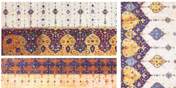
تصویر ۷- نقوش حواشی مذهب داخلی صفحات افتتاح و اختتام قرآن‌های ۴ و ۵.