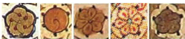
تصویر ۳- نشان فصل آیات مربوط به قرآن‌های ۱ تا ۵