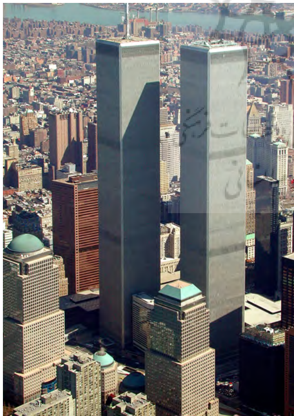
تصویر ۲- فضای مابین برج‌های سابق مرکز تجارت جهانی نیویورک.

این تعریف به دلایلی تعریف مناسبی نیست زیرا واژه منفی همراه با خود یک بار معنایی بد دارد. این واژه از طریق تقابل‌های دوقطبی، فضای خالی را بی‌ارزش جلوه می‌دهد. فضای منفی در مقابل واژه فضای مثبت خفیف و بد تلقی می‌شود. دلیل دیگر