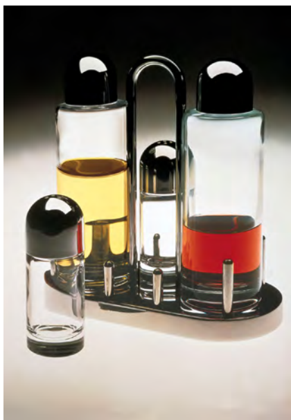
تصویر ۴- جای ادویه رومی، طراح اتوره سوتزاس، تشبیه روابط خانوادگی میان وسایل.