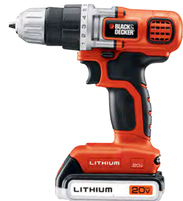
تصویر ۱- محصول شرکت بلک اند دکر: استفاده از رنگ نارنجی (متماثل به قرمز) و سیاه در هویت شرکت.

«وسیوس ونگ» معتقد است که «به طور کلی همه چیزهایی