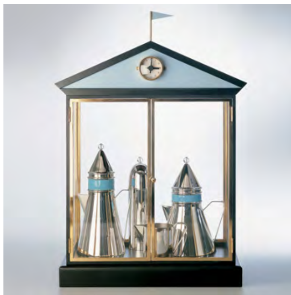
تصویر ۳- رابطه کتری، قوری و سایر وسایل به رابطه یک خانواده تشبیه شده است.

در بعد پنهان علاوه بر نکاتی که هال می گوید - مانند فواصل فرهنگی - روابط ذهنی دیگری نیز وجود دارند که حاصل تفسیر ناظر هستند. اما گاهی خود طراحان نیز این روابط را درک نموده‌اند و آگاه یا ناآگاه این روابط را رمزگذاری کرده‌اند تا مخاطب آن را دریابد. در ادامه پژوهش نمونه‌های بسیار زیادی از وجود رمزگان بعد پنهان شناسایی شد که در ذیل به چند نمونه معتبر آن اشاره می‌شود: