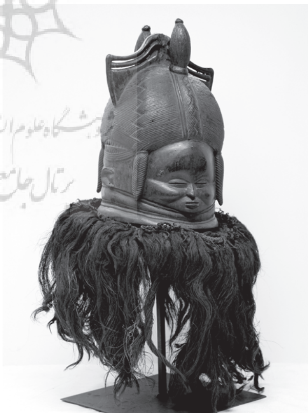
تصویر ۵- یکی از صورتک‌های مندی، متعلق به قرن بیستم، موزه کودکان ایندیاناپولیس.