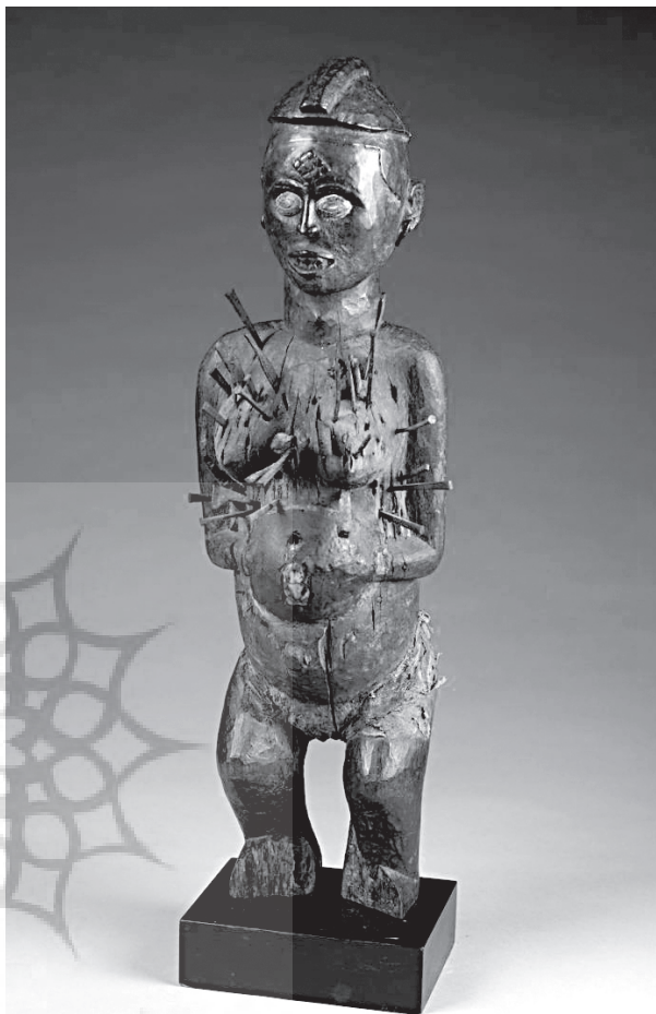
تصویر ۷- یک نمونه پیکره ربه‌النوع آکنده از میخ (نگیسی نکوندی)، به دست آمده از کنگو، قرن نوزدهم، چوب و فلز، ۱۷/۸×۱۷/۸×۵۵/۹ سانتی‌متر، موزه هنر بیرمنگهام.

و این را از برای رفع مشکلات‌شان انجام می‌داده‌اند. آنان در ازای عهدی که می‌بستند تقاضای پشتیبانی داشتند، با علم به اینکه در صورت عهدشکنی مورد مجازات قرار می‌گرفتند. اهالی لوانگو با ایمان کامل به خدایان‌شان، در واقع به نوعی دخیل می‌بستند