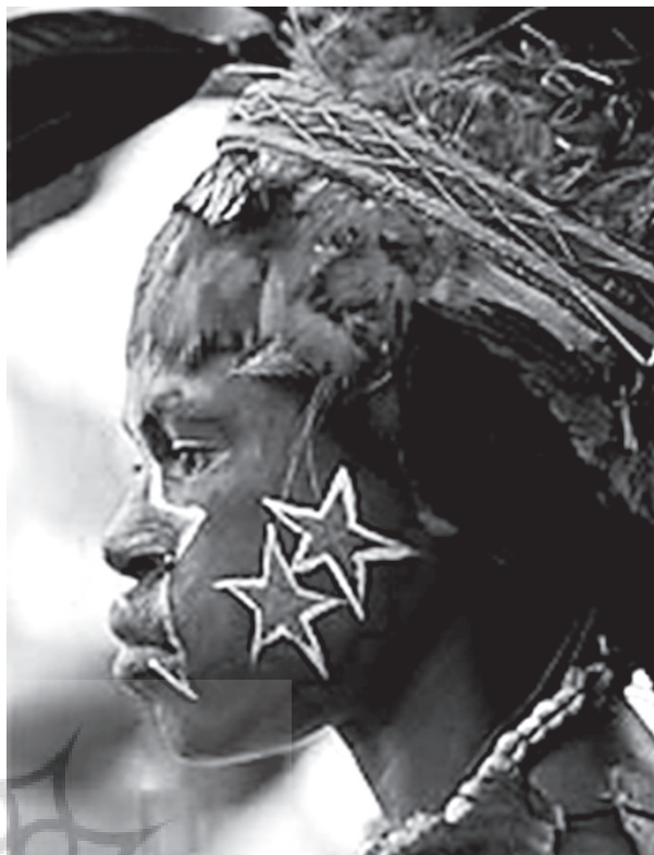
تصویر ۴- نمونه‌ای از بدن‌نگاره‌های رقصندگان واهاگی در مراسم خوک در پاپوا گینه نو.

به این ترتیب در تحلیل صورت شیء هنری، مثلاً یک عصای مزین که در مراسم قبیله‌ای استفاده می‌گردد، در پیوند با زمینه‌های ساخت آن، مهم است که به دو مساله پرداخته شود: (۱) آن وجوهی از صورت شیء که ممیز آن از دیگر اعضای مجموعه کارکردی، مثلاً سایر عصاهای معمولی و بدون تزئین، است که شیء به آن تعلق دارد (وجوه زیباشناختی)، (۲) وجوه