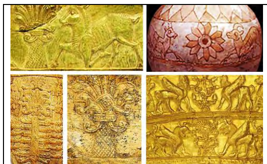
۱۳. زیویه.

شکل‌های گوناگون در زیورها و سنگ نگاره ها تکرار گردیده است (ت ۱۴).