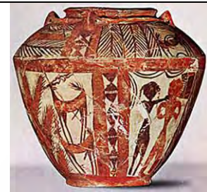
۱۵. خفاجه، ماخذ: