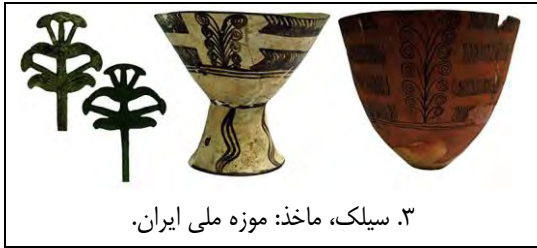
۳. سیلک، ماخذ: موزه ملی ایران.

۲ - ۳ - ۳. دوره برنز: در میان مجموعه آثار سنگ کلیت جیرفت (۲۷۰۰ پ.م) از دوره مفرغ نقش درخت به شمار بسیار دیده می شود (ت ۴). به نظر می رسد مردمان جیرفت بیش از هر تمدن دیگری در فلات ایران تصویرگری درخت را ارج نهاده اند. نگاره های درخت هنر جیرفتی را می توان به سه دسته بخش کرد: الف. نخل ب. درختی پرشاخ و برگ با تنه باریک و گل یا میوه ای بر سر هر شاخه و ج. گیاه بته مانند و گلدار با شاخه های مجزا. نمونه های ب و ج را گاه دو بز کوهی نر با شاخهای بلند در میان گرفته که به خوردن برگهای درخت مشغولند.