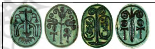
۲۲. تبس، ماخذ: موزه متروپولیتن.

بر روی مهرهای سنگی یافته شده در تبس از سده ۱۵ پ.م نقش درختان گوناگونی دیده می شود (ت ۲۲).