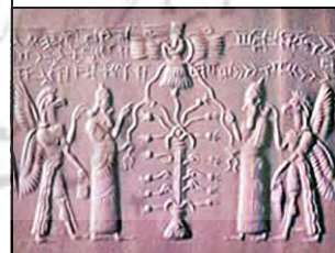
۱۹. نینوا، ماخذ: