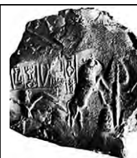
۱۸. تل اسمر