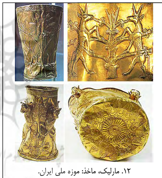
۱۲. مارلیک، ماخذ: موزه ملی ایران.

در ردیف میانی جام زرین مارلیک گیلان مشهور به جام زندگی بزهایی ایستاده در برابر گیاه زندگی نقش شده است. درختی پربرگ و باشکوه نقش جام دیگری از مارلیک است. جام زرین دیگری گیاه زندگی را در میان دو گوپت نشان می دهد. بر کف این جام نیز گیاه زندگی از روبرو دیده می شود (ت ۱۲).