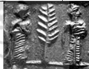
۱۷. ایسین - لارسا