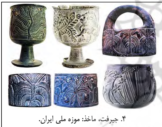
۴. جیرفت، ماخذ: موزه ملی ایران.

۲ - ۳ - ۳. دوره برنز: در میان مجموعه آثار سنگ کلیت جیرفت (۲۷۰۰ پ.م) از دوره مفرغ نقش درخت به شمار بسیار دیده می شود (ت ۴). به نظر می رسد مردمان جیرفت بیش از هر تمدن دیگری در فلات ایران تصویرگری درخت را ارج نهاده اند. نگاره های درخت هنر جیرفتی را می توان به سه دسته بخش کرد: الف. نخل ب. درختی پرشاخ و برگ با تنه باریک و گل یا میوه ای بر سر هر شاخه و ج. گیاه بته مانند و گلدار با شاخه های مجزا. نمونه های ب و ج را گاه دو بز کوهی نر با شاخهای بلند در میان گرفته که به خوردن برگهای درخت مشغولند.