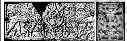
۲۰. نمرود، ماخذ: (Herrmann, 1986, no. 177, )