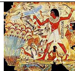
۲۴. مقبره نیامون،