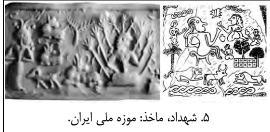
۵. شهداد، ماخذ: موزه ملی ایران.

ایزدبانوان باروری است. وجود سه گونه درخت در کنار ایزدبانوی نشسته بر تخت در پرچم شهداد نیز می تواند نشان همین همبستگی باشد (ت ۵).