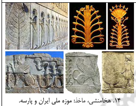
۱۴. هخامنشی، ماخذ: موزه ملی ایران و پارسه.