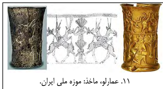
۱۱. عمارلو، ماخذ: موزه ملی ایران.

دیگر از عمارلو تصویر درهم تنیده چند بز در حال خوردن برگهای گیاه زندگی است (ت ۲۹).