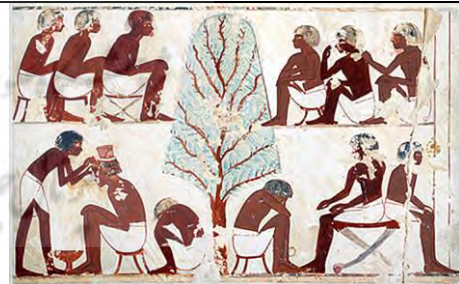
۲۳. تبس، ماخذ: موزه متروپولیتن.