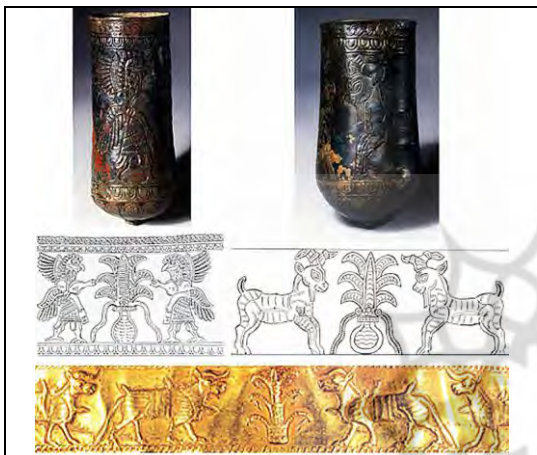
۸. لرستان، ماخذ: موزه ملی ایران.

بر روی ظرفی از حسنلو ارومیه در سده ۹ پ.م بز به گیاه زندگی تکیه زده است (ت ۲۳).