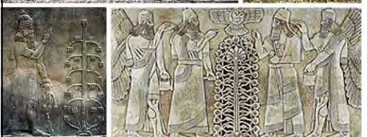
۲۱. خرساباد و نمرود.