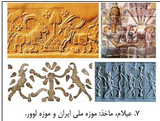
۷. عیلام، ماخذ: موزه ملی ایران و موزه لوور.

۲ - ۳ - ۴. عیلام: از شوش میانه (سده ۱۳ پ.م) چند دیوارنگاره آجری یافت شده که گیاه زندگی را بین یک گویت و یک خدایبانو یا ملکه تصویر می کنند. یک اثر مهر از همین دوران نشانگر مردی زانو زده در میان درختانی است که از درون یک جام رسته اند. نقش دو بزکوهی در دو سوی گیاه زندگی بر یک آذین دیواری از نیایشگاه چغازنبیل و مهری عیلامی دیده می شود (ت ۷).