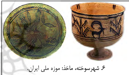
۶. شهرسوخته، ماخذ: موزه ملی ایران.

از مشهورترین آثار به دست آمده از شهرسوخته زابل (۳۲۰۰ - ۲۰۰۰ پ.م) سفالینه ایست که در چند قاب مداوم حرکت بز به سمت گیاه زندگی را نمایش می دهد. بر کف یک کاسه سفالی دیگر از این تمدن گیاه زندگی به گونه ای شناور رسم گردیده که درخت گوگرد در دریای فراخکرت را به یاد می آورد (ت ۶).