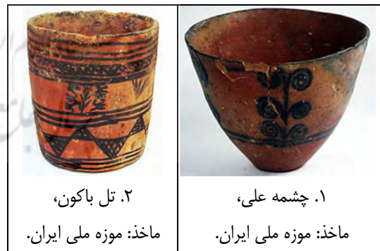
۱. چشمه علی،

۲ - ۳ - ۱. دوره نوسنگی: نقش گیاهان بر سفالینه های اواخر نوسنگی (هزاره پنجم پ.م) در چشمه علی شهرری (ت ۱) و تل باکون مرودشت (ت ۲) را می توان از کهنترین نمونه های این بن مایه در ایران دانست. این نمونه ها گیاه را ابتدایی و تجریدی و با ساده ترین ویژگیهایش تصویر کرده اند.