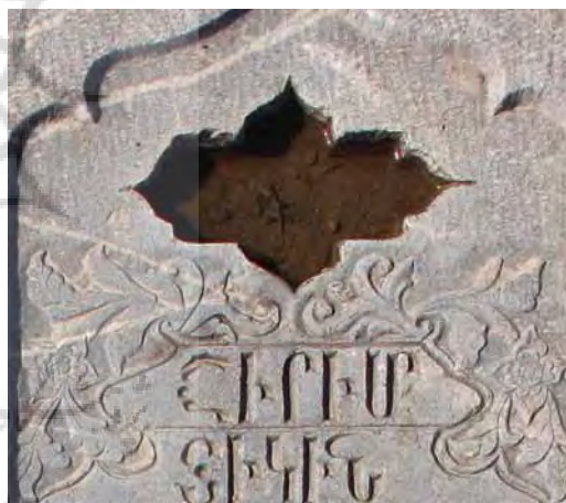
تصاویر ۱۲ و ۱۳- طشت‌آب ترنجی، آرامگاه آرامنه و تخت فولاد.