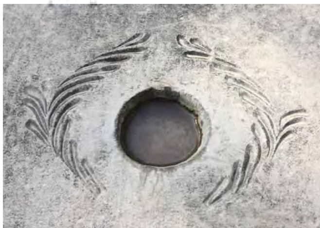
تصاویر ۱۴ و ۱۵- طشت‌آبهای ساده هندسی، آرامگاه آرامنه و تخت فولاد.