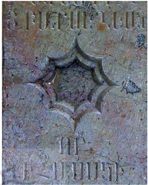
تصاویر ۵ و ۴- طشت آب شمسهای، آرامگاه آرامنه و تخت فولاد.

گرفت (تصاویر ۴ و ۵). «اعتقاد کهن ایرانیان بر این بود که بین آب و روشنایی ارتباطی مطلق وجود دارد زیرا این دو از یک جنس و از یک چشمه هستند و در یک بستر روان می‌شوند» (بلخاری ۱۳۸۴، ۸۲). آب در زبان رمز عرفا نیز، رمز نور هستی است که در هر لحظه در سراسر جهان نفوذ و جریان دارد. در شمایل‌نگاری مسیحی، شعاع‌های خورشید نماد گرما، نور و باران هستند. یعنی هم به مانند آب، حیات‌بخشند و هم حقیقت اشیاء را آشکار می‌کنند. مسیح نیز خود خورشید عدالت خوانده می‌شود که بر جهان پرتو دارد (شوالیه، ۱۳۸۴، ۱۱۸).