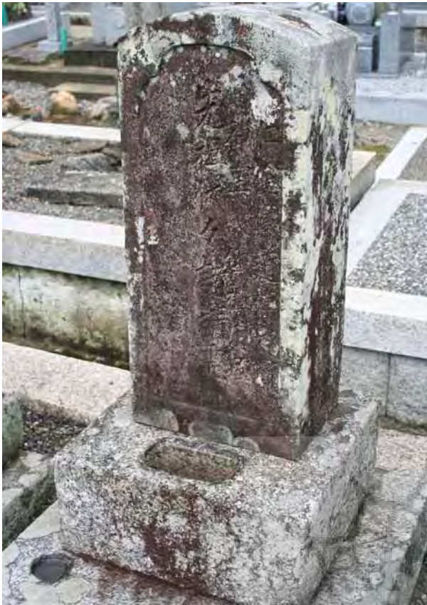
تصویر ۳- طشت آب در ژاپن.