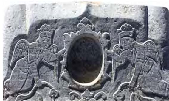
تصاویر ۶ و ۷- طشت آب با فرشتگان، آرامگاه آرامنه و تخت فولاد.