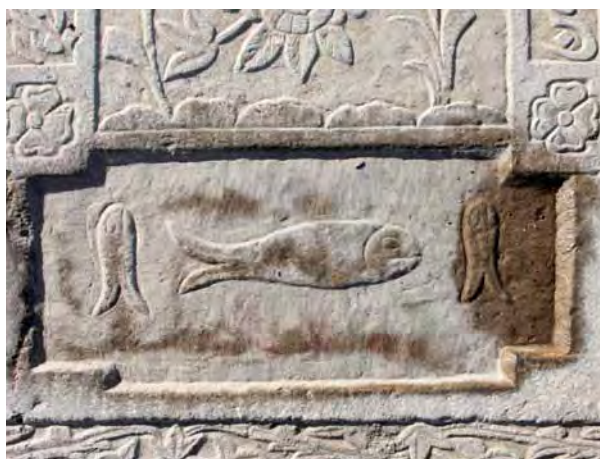
تصویر ۲۰- طشت آب و ماهی، آرامگاه تخت فولاد.