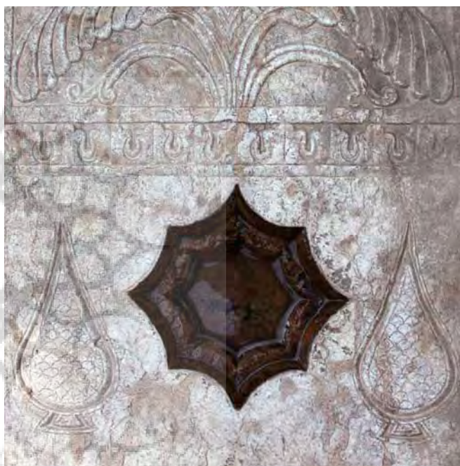
تصاویر ۱۸ و ۱۹- طشت آب و سرو، آرامگاه ارامنه و تخت فولاد.

در قرون اول میلادی) نقش بسته بود، نمونه‌ای از آن در کنار طشت آبها و روی قبور ارامنه اصفهان به دست نیامد.