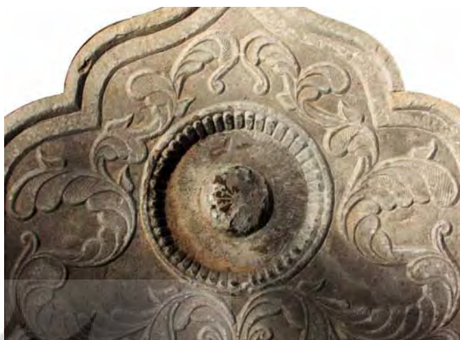
تصاویر ۱۱ و ۱۰- طشت‌آب گل نیلوفر، آرامگاه آرامنه و تخت فولاد.