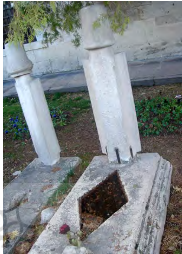
تصویر ۲- طشت آب در ترکیه.

همچنین از توجه و احترام به عناصر اربعه ناشی می‌شود. اما به طور قطع در بستر هنر و آداب ایرانی-اسلامی، طشت آبها به نحو زیبایی تلطیف شده‌اند، به گونه‌ای که هم وجوه مادی و ظاهری و هم ابعاد معنوی طشت آبها به درستی لحاظ شده است.