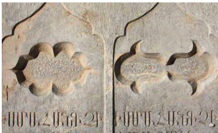
تصاویر ۱۶ و ۱۷- طشت آب های زوجی و قرینه‌ای، آرامگاه ارامنه و تخت فولاد.