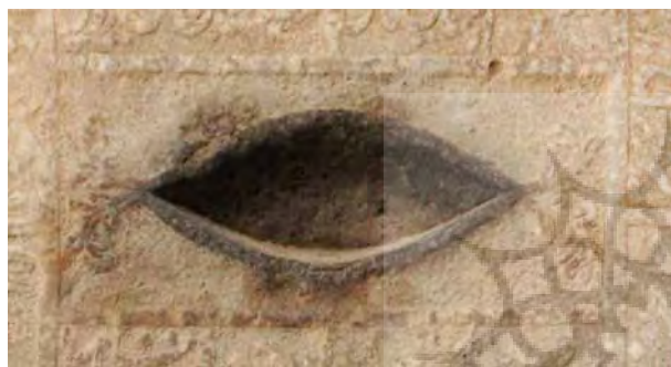
تصویر ۲۲- طشت آب کشکولی، تخت فولاد.