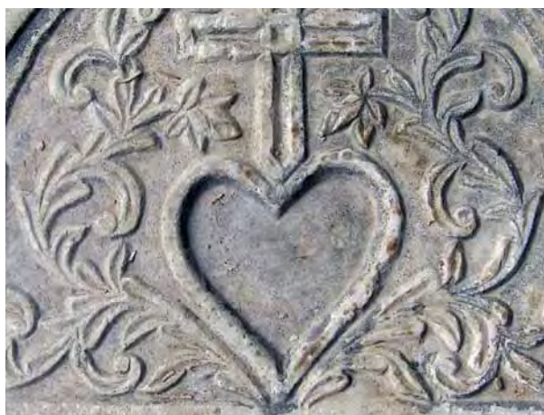
تصویر ۲۱- طشت آب به فرم قلب، آرامگاه آرامنه.