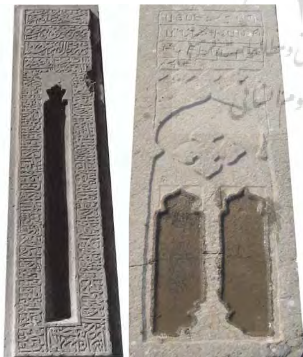
تصاویر ۸ و ۹- طشت آب محرابی، آرامگاه آرامنه و تخت فولاد.

در فرهنگ اسطوره‌ای، آب نماد اقیانوسی بود که کیهان از آن آفریده شد و نیلوفری که روی آب در حرکت بود به مشابیه زهدان آن به شمار می‌رفت (هال، ۱۳۸۰، ۳۰۹). از طرفی نیلوفر در فرهنگ ایران باستان از جایگاه ویژه‌ای برخوردار بود و برای آن جشن برگزار می‌شد. از کنار هم قرار گرفتن آب و نیلوفر دو ایزدمهر و ناهید پدیدار می‌شوند که ارتباط نزدیکی با هم دارند. در اساطیر ایرانی آناهیتا یا ناهید ایزد آب است و نماد آن گل نیلوفر می‌باشد و مهر (ایزد نور و روشنائی) خود از گل نیلوفر یعنی ناهید، زاده می‌شود (بلخاری، ۱۳۸۴، ۷۸-۸۱). در اساطیر ارمنی «آناهید» همان نقش آناهیتای ایرانی را دارد که ایزد بانوی باروری و ثمردهی است. «میهر» یا مهر نیز از دیگر ایزدان مهم ارمنستان است که نماد نیروی حیات بخش آتش است (نوری‌زاده، ۱۳۷۶، ۲۰۳). هنرمندان